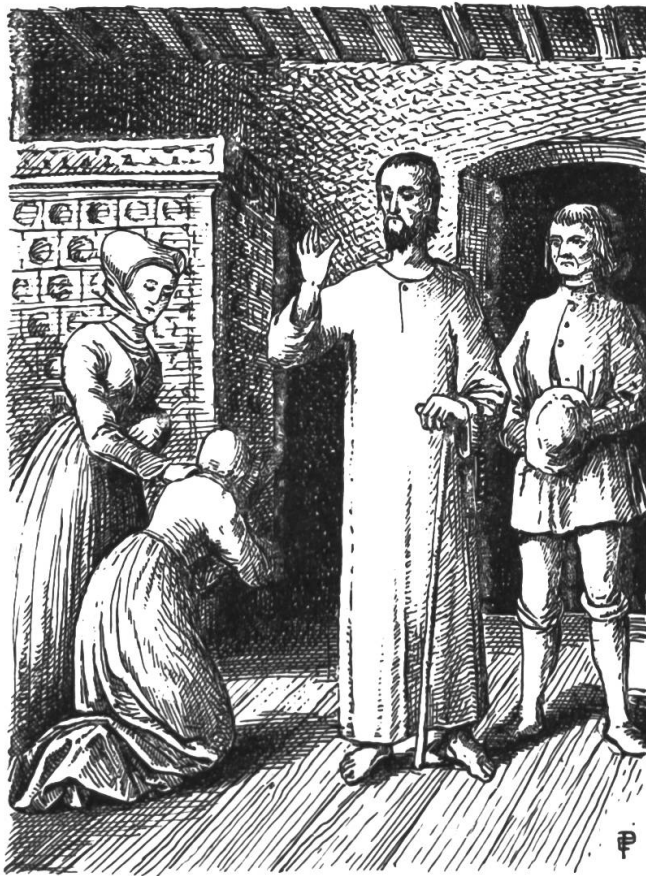
!„Weib, ich kenne deinen Kummer!“

eine Mutter der Gnaden, eine Mutter Christi, des allmächtigen Gottes und Menschen. Ich bitte dich unverkehrte edle Jungfrau und getreue würdige Mutter Maria, du wollest uns gegen deinen lieben Sohn, unsern Herrn und Richter Jesum Christum eine kräftige Fürsprecherin sein; daß er seine grundlose Barmherzigkeit uns armen Sündern in diesem Jammerthale mitteile und aus diesem Elend nicht scheiden lasse, wir haben denn zuvor seinen wahren, zarten Frohleichnam mit rechter Beicht und lauterem Herzen empfangen. Amen.“ — Amen, hallte es leise vom Gewölbe der Kirche nieder und langsam erst