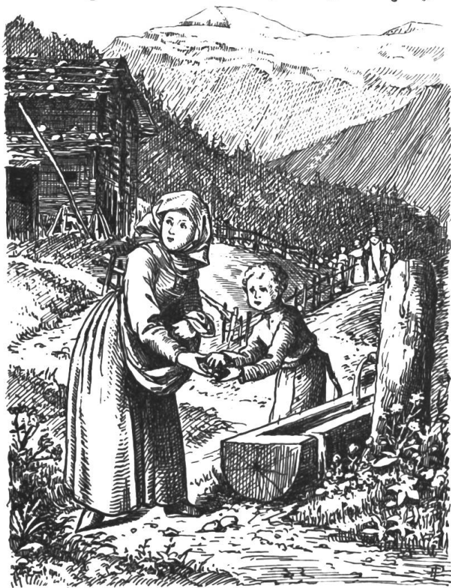
„Nimm das schnell, guter Bub!“

Obwohl die Thalleute dem Gotteshaus versprochen, daß ein jeder Thalmann ihm eine Menne, d. h. ein Fuder Holz, das ein Rosz ziehen oder tra-