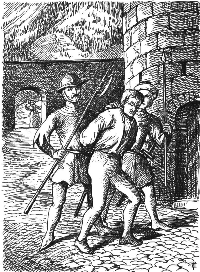
Zwischen zwei Bewaffneten wandelte er dem Turme zu.

einwerfen — wenn die Wachen nicht aufpassen?“ „Ja, aber darf ich das?“ „Gewiß, es sind nur ein paar Kleider, sonst sicher nichts. Ohne sie muß der arme Mensch schier erfrieren — gelt, lieber Kleiner, du thust mir den Gefallen, ich will es dir nicht vergessen und dürre Birnen sollst du bekommen, so viel nur deine Ruttensäcke zu fassen vermögen.“ Diese Aussicht war verlockend. „So gebt her,“ sagte der Klosterschüler, „ich will zum Fensterchen hinaufklettern, das hab' ich auch schon gethan und im Klettern nehme ich es mit jedem auf!“ Sogleich nahm der Kleine das Bündelchen in Empfang und wandte sich der Kloster-