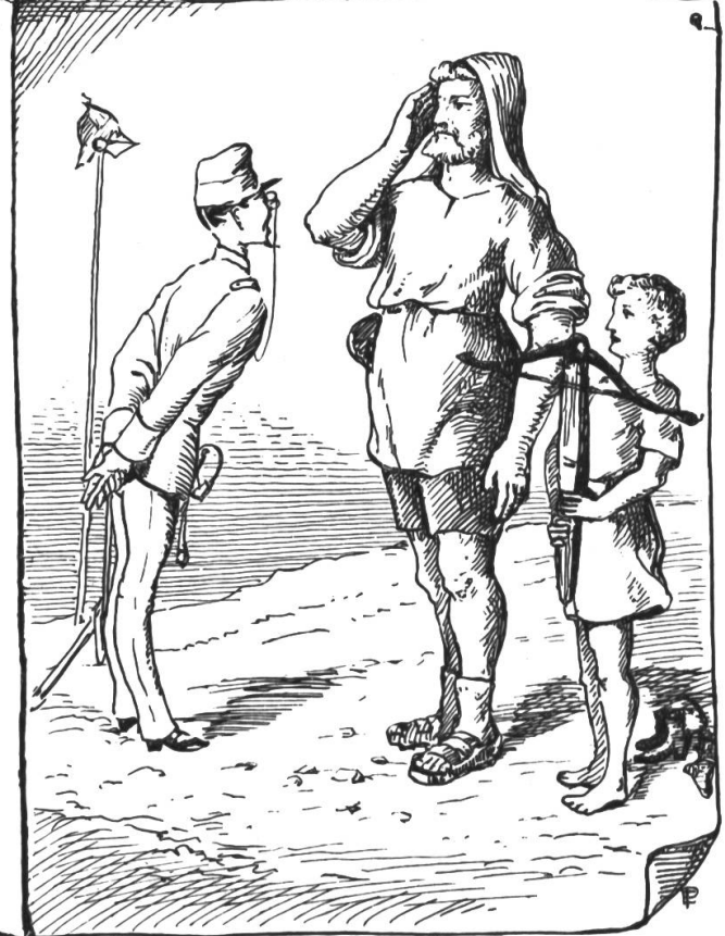
Wie sich der Rekrut Sepp-Migi die alten Schweizerhelden bei einer militärischen Aushebung vorstellt.