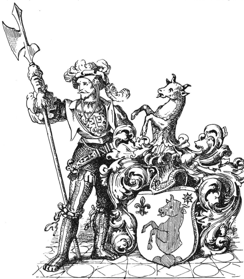
Wappen der Zelger.

Da besonders die Urner und Unterwaldner die Viehmärkte ennet dem Gotthard fleißig be- suchten, so gerieten sie mit den italienischen