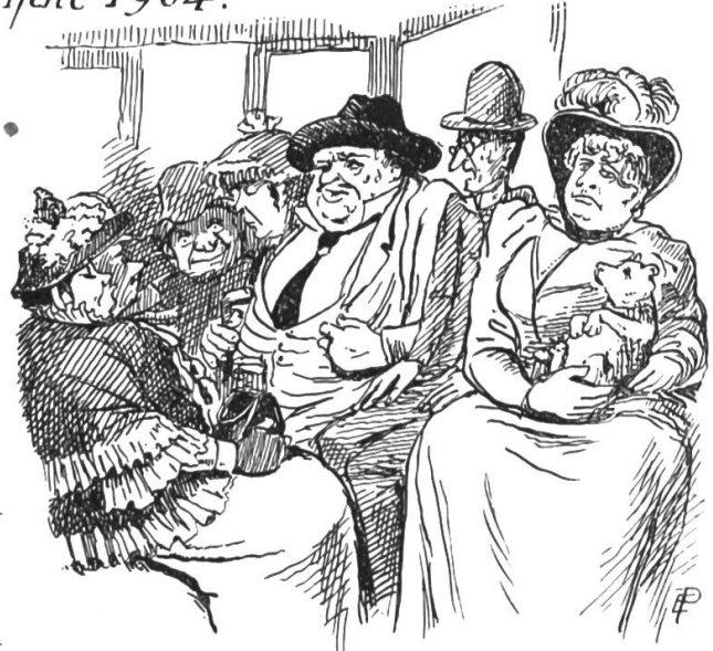
In der Bahn.