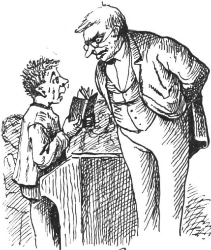
In der Prüfung.