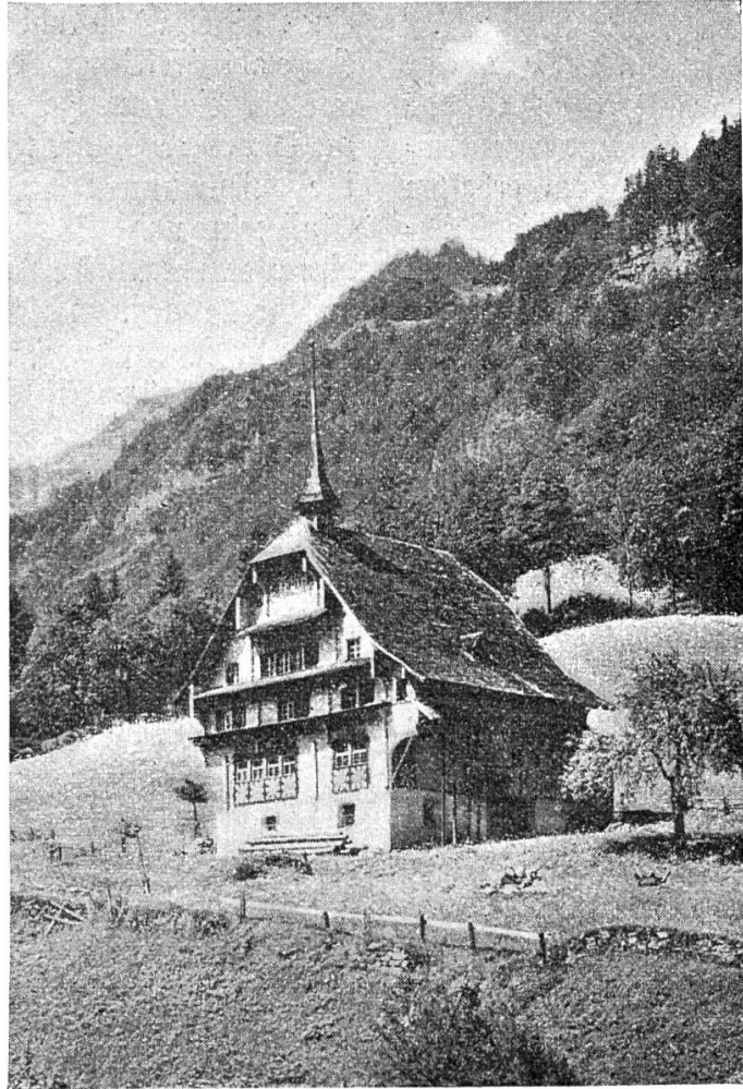
Das Hochhaus in Wolfenschießen.

Schon im Januar 1596 hatte der dortige Rat beschloßen, daß der Nuntius nicht abgewiesen, sondern aufgenommen werden solle und am 22. Juni gab derselbe dem Boten für die Tagsatzung die Weisung, dahin zu wirken, daß demselben auch von Glarus und Bünden Paß und Geleit gegeben werde. Von Luzern verfügte sich della Torre nach Stans, der spanische Gesandte begleitete ihn. Schon am See wurde der Nuntius von einer