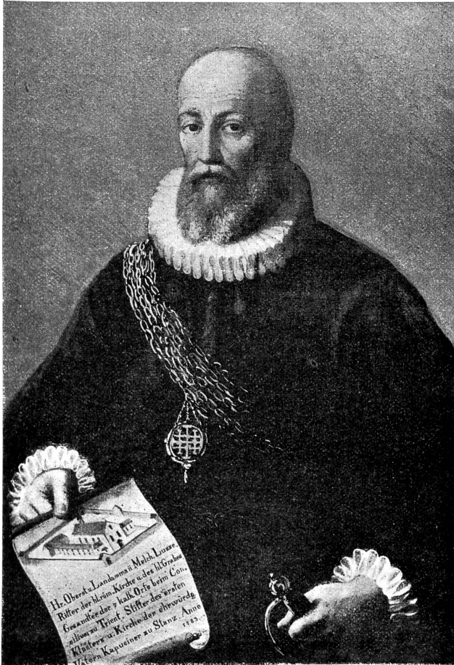
Melchior Lussy, Stifter des Kapuzinerklosters in Stanz, 1583.

bei einem solchen Anlasse an Stelle seines Vaters 1572 vor Papst Gregor XIII. gehalten, ist folgenden Jahres im Drucke erschienen. 1590 verreiste Lussy nach der Wahl Gregors XIV. neuerdings zur Gratulation und Obedienzleistung in die ewige Stadt und schon im folgenden Jahre traf er wiederum als Gesandter dort ein. Er stellte bei diesem Anlasse an den Papst Gesuche um Erneuerung der Ablässe u. s. w. Frau in Sarnen, für die Pfarrkirche in Stanz, für die Kapelle St. Anton in Kerns u. s. w. Schon früher hatte er in Rom für den Abt von Engelberg das Recht ausgewirkt, bei kirchlichen Handlungen die Inful zu tragen, aber das bezügliche Aktenstück wollte immer noch nicht eintreffen. Im Juni 1579 erneuerte die Regierung von Nidwalden beim Nuntius Ringuarda dies Gesuch und fügte demselben die Bitte an, dem damaligen Pfarrer Diethelried von Stanz, die Vollmacht zu geben, Paramente und Glocken weihen zu dürfen. Am 8. August 1579 antwortete der Staatssekretär dem obgenannten Nuntius, das erste Gesuch sei gewährt und dem Abt auch die für den Pfarrer von Stanz nachgesuchte Vollmacht übertragen, weil es nicht Brauch sei, dieselbe an gewöhnliche Pfarrer zu verleihen. Es bedurfte aber noch verschiedener Briefe Lussys und der vielvermögenden