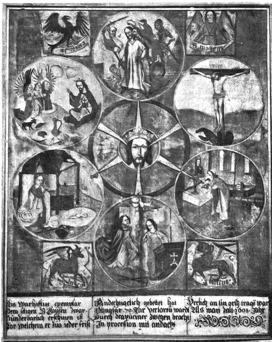
Die Betrachtungstafel des sel. Bruder Klaus.

den Sühnetod des göttlichen Heilandes sehen kann und weil die Früchte des bitteren Leidens und Sterbens unseres Herrn uns gerade durch das hl. Messopfer zugewendet werden, so ist also in diesem Bilde das Symbol der christlichen Hoffnung zu erblicken. Wie bei den ersten zwei Bildern