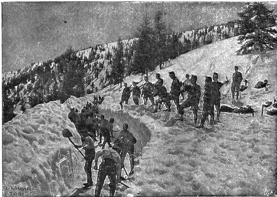
Von der Grenzwehr 1917. — Schneebrucharbeiten im Tessin.

klopste. Der Balz ging bedächtigen Schrittes an die Haustüre und fragte: „Was isch?“ „I bis, Balz, dr Hubelheiri.“ „So, so“, lams gedehnt zurück. „Was witt?“ „Land mi inä, i wett eppis mid iich redä.“ Da öffnete der Balz die Türe. Der Heiri kam mit kurzem: „Guaten Abig“ hinein und ging schweigend dem Balz in die Stube nach. Das Annili ging hinaus und hörte dann die beiden Männerstimmen laut miteinander sprechen, ja, der Heiri lärmte einmal laut auf, so daß das Annili einen jähen Schrecken bekam. Aber dann wurden die Stimmen leiser, und auf einmal ging die Türe auf und