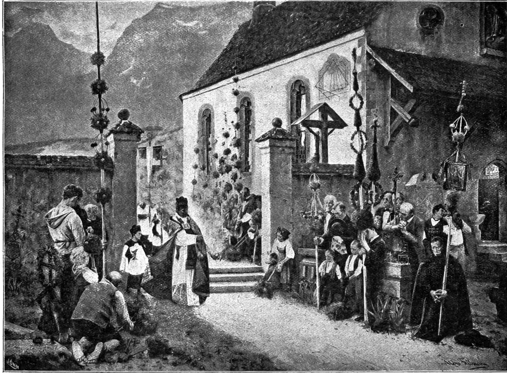
Die Palmenweibe am Seelen Sonntag. Nach einem Gemälde von H. Fellmann.