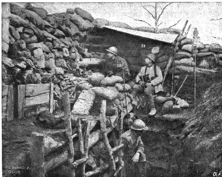
Vom Weltkriege. — Im vordersten französischen Schützengraben