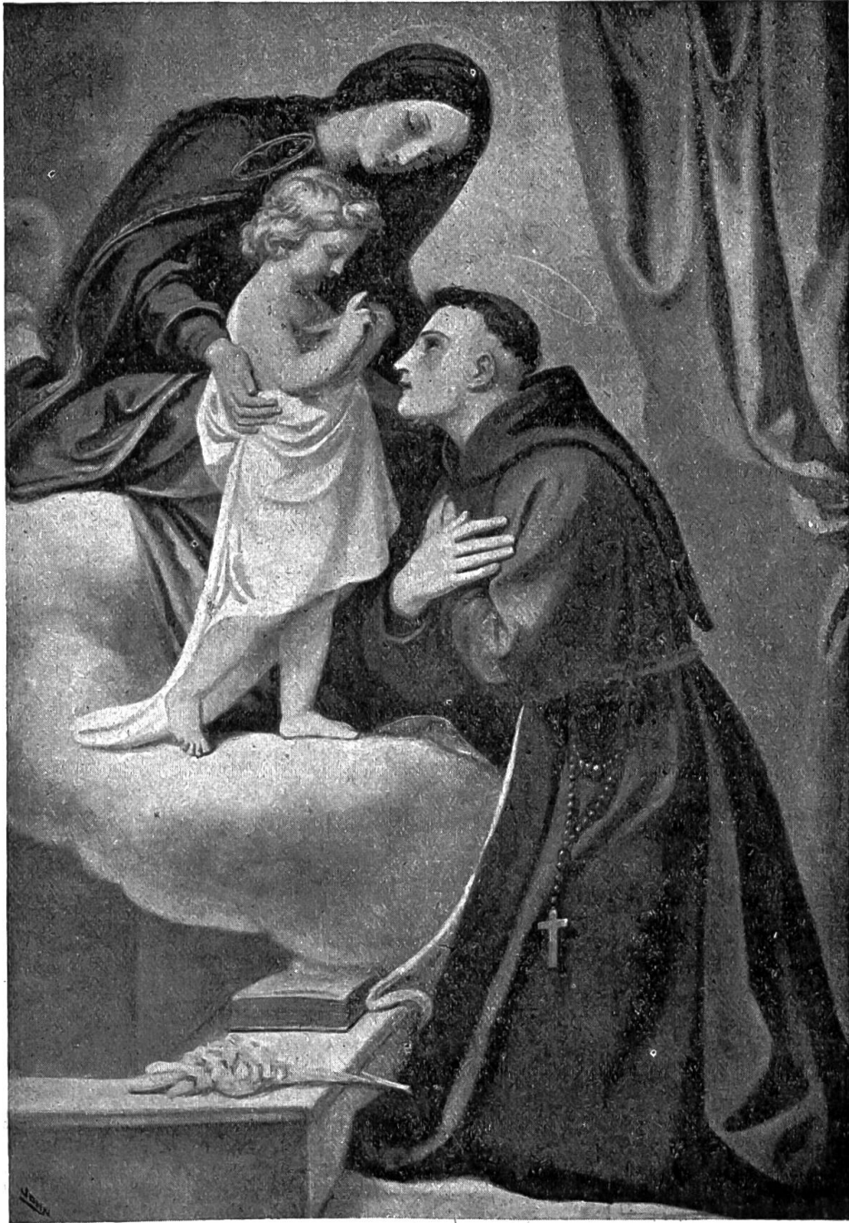
Der hl. Antonius. Nach einem Gemälde von Paul von Deschwanden.