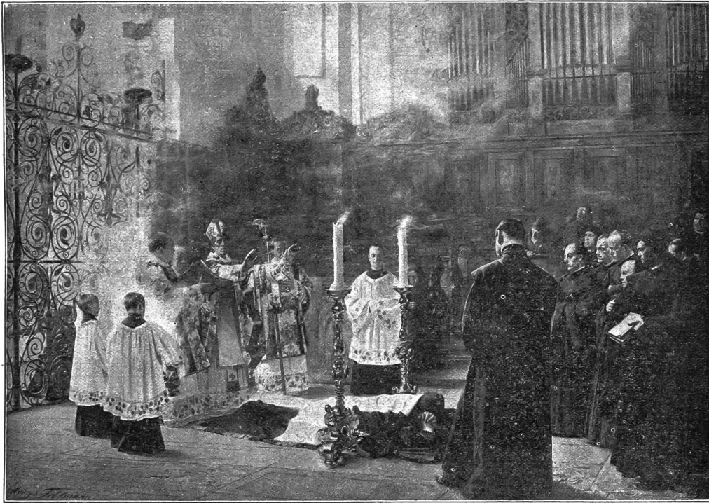
Eine Professefeier im Kloster Engelberg. Nach einem Gemälde von Al. Fellmann.