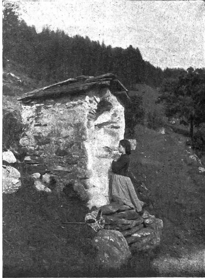
Ein Ave Maria beim Bildstöcklein.