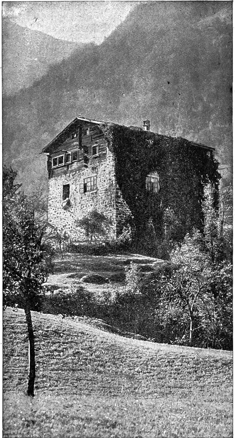
Das Haus des Walter Fürst in Attinghausen.

Wann ist aber in einer Zusicherung des Verkäufers eine abfichtliche Täuschung enthalten? Ein Verkäufer, der im Bewußtsein der Unrichtigkeit seiner Angaben schriftlich oder auch nur mündlich Zusicherungen bezüglich Eigenschaften oder Mängel eines verkauften Tieres gibt, macht sich unter allen Umständen der abfichtlichen Täuschung schuldig. Sehr oft wird es sich nicht nachweisen lassen, daß die Täuschung eine bewußte und beabsichtigte gewesen sei; der gesunde Sinn des Volkes versteht es aber gut, den Betrug aufzudecken und den Betrüger zu brandmarken.