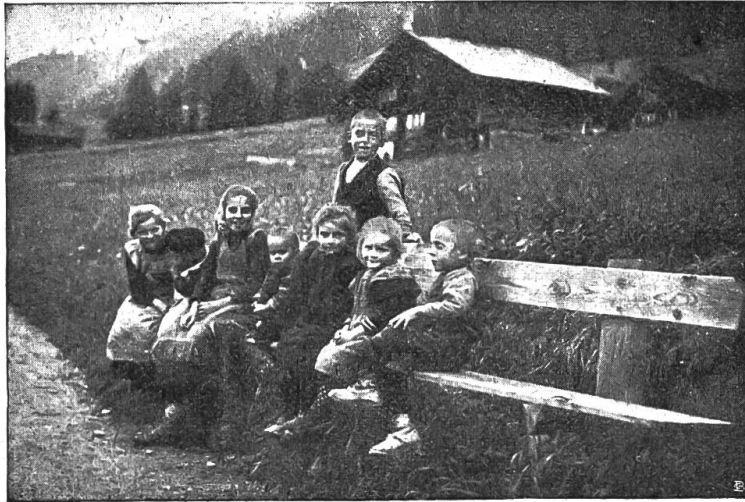
„Wir sitzen so fröhlich beisammen . . .“

Die Mutter ging mit ihm bis zur Post und drückte ihm noch zwei Goldstücke in die Hand, „von wegen der Vater werd' ihm