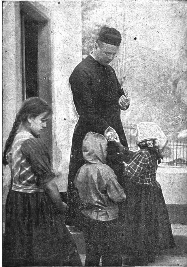
„Grüß Gott Herr Pfarrer! ..“

paar Tage nachher hat mancheiner, der etwas spät in der Nacht vom Bären heimgekommen ist, sich damit entschuldigt, der Ludi sei eben aus der Fremde heim und hab' beim „Bären“ eine Flasche getrunken u. von der „Fremde“ erzählt; und der könne erzählen, daß man ihm die ganze Nacht „ablosen“ möcht'. Und so war es; aber nicht nur am ersten Abend, sondern fast so manchen Abend, als Gott gab. Da hat er denn erzählt, was er gesehen und erlebt und wie es in der „Fremde“ ganz anders sei, als daheim und die Leut' seien viel ge-