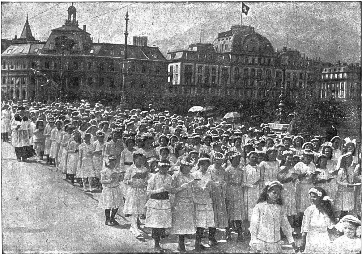
Aus der Fronleichnamsprozession in Luzern.

Sie hatte noch nicht ausgeredet, so ging die Türe auf und es kam das Moden-Franzi.