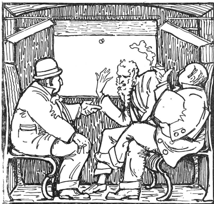
„Da in Nidwalden mache ich es so“.

fache Bauersleute. „Teuer!“ ruft der Mann, daß das ganze Haus ertönt. Man sollte doch gar nicht vom Preise reden, wenn man den Vater selig wieder bekomme wie lebend. Da sei einer braven Familie doch kein Preis zu hoch. Uebrigens, es möge sich ja nicht vertragen. Er wolle es ihnen aus reinem Mitleid ganz billig machen, daß er selber noch fast verspiele daran. 8 Fränkli koste das Bild nur. „Acht Franken?“ denkt die Mutter. „Da habe ich doch zu große Angst gehabt; das ist ein ganz rechter Mann. Acht Franken, das darf ich wagen; es ist wahr, der Vater gehört daher. Und so bestellt