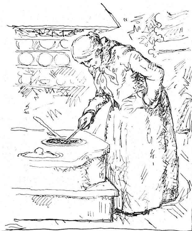
Die Marthe steht am Herd und sinnt. . .

hinab. Sie hat eine schlechte Nacht gehabt. Den ganzen Vormittag schafft sie über Bauisch und Bogen, damit ihr — der Lötcherbub nicht in den Sinn kommt. Sogar die Schnupftabakdose, die der Marthe doch so unentbehrlich ist, wie dem Bauer die Pfeife, hat sie in der Kammer droben liegen lassen. Sie will nicht und doch hält sie oft mitten in der Arbeit inne, legt das Messer, mit dem sie Kartoffeln schält, weg. Mitten im Hühnerhof stehend, schaut sie wie abwesend gegen Marbach hinunter, ohne daß sie den Hühnern das Futter reicht, ohne auf ihr Gefrächze und Geschrei zu hören, bis die hungrigen Tiere ihr auf Arm und Nacken hüpfen und