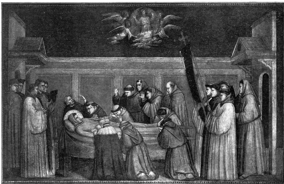
Der hl. Franz von Assisi auf dem Totenbett. Nach dem Fresko von Giotto in Santa Croce in Florenz.