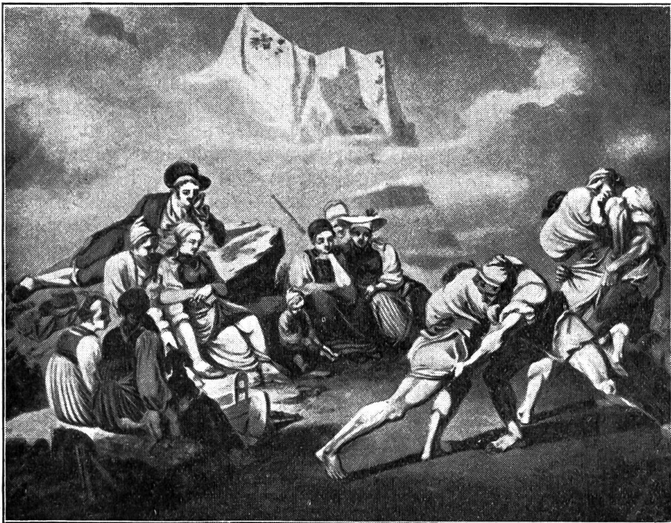
Helferschwinget. Nach einer Lithographie von J. Volz.

Diesmal schaute er alles so klar und lustig aus der Höhe herab an. Die paar Stümpchen von Menschen auf dem grünen Bödeli unten, — zwei, drei Firsten, die nicht mehr Firsten zu nennen waren. Ein par Leute winkten, ein Knecht schwang die