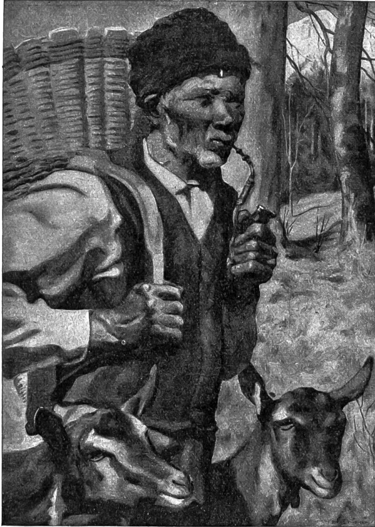
Der Geißpeter. Gemälde von Hans Widmer.

Mund zu einem Pfeifen und trampete mit großen Schritten in die Stube hinaus. Er hatte ein gezwungenes Lächeln auf der Zunge und ein Wort: — was wird er sagen? Alle schauten ihn an. Er ruzte: „Auf jetzt! wieder ans Holz! Die Täg ergeben nicht wohl.“