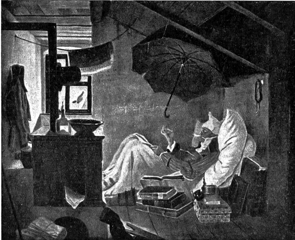
Der arme Dichter. Nach dem Bilde von C. Spitzweg.

Der Drahtseilschmied war ein kleiner breiter Mann mit einem festen Tellenkopf. Sah man den Mann an einem Tisch sitzen, so dachte man: welch ein Riese; stand er aber auf, so hatte er nur kurze Beine und war klein. Aber das schöne männliche Ge-