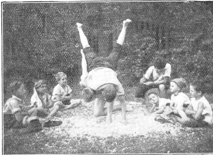
Kranzschwinger der Zukunft.

Drei Wochen später war große Hochzeit im Nelsgau. Der Enzengruber hat an der Mandl ein prächtiges Weib gekriegt und sich das Glück ins Haus gestiftet. Dem Stelzenhofer wurde die Tausendfrankenlast abgenommen und er braucht jetzt nicht mehr sich vor dem Enzengruber zu flüchten.