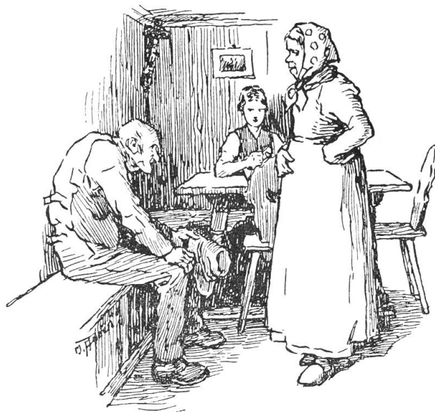
Zuletzt stellte sie sich breit vor den Besucher hin.