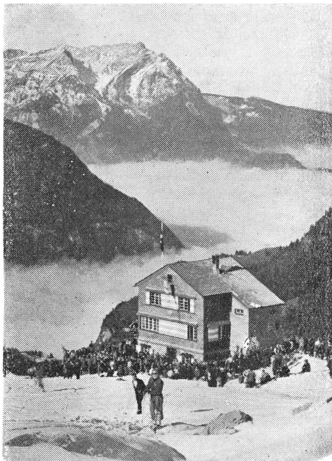
Das Brisenhans, eine der schönsten Clubhütten wurde letzten Winter eröffnet.

Stadtleute haben uns Vieles voraus, was Umgangsformen und Besuchsroutine anbelangt. Der Geometer blieb auch kaum eine Stunde auf Sonnenberg, ließ sich aber die