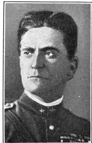
General Graziani wurde Vizekönig von Abessinien

südlichen Nachbarn Italien zu hören. Mussolini suchte Raum für sein Volk. Er klopfte nicht bescheiden an die afrikanische Türe, klopfte auch nicht bescheiden an die Türe des Völkerbundes, nein, er klopfte auf seinen Schreibtisch und auf die Brust seiner Soldaten und sagte: „Neue und alte Rechnungen sind zu begleichen. Auf Kameraden! begleichen wir sie!“ Die ganze Welt schrie und lärmte vor Entrüstung. Der Völkerbund vermittelte, drohte, verbot und nahm Italien langsam in die Sanktionen-Zange. Der Regus in Abessinien klagte, rüstete, kämpfte, rief um Hilfe. Mussolini schaute nicht links noch rechts, er hörte nicht auf Drohung, nicht auf Jammern. Er setzt, ohne zwischen Gut und Böse, Recht und Unrecht zu entscheiden, alles auf eine Karte, auf die Eroberung Abessiniens. Ein unerhörtes Wag-