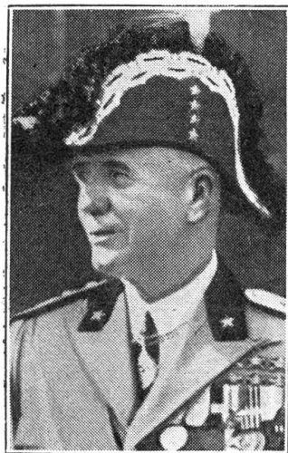
Marshall Badoglio der Sieger und Oberbefehlshaber in Abessinien

die Weitsicht nicht verlieren. So wie es rings um uns kracht und lärmt, müssen wir mit schlimmen Zeiten und mit wildgewordenen Nachbarn rechnen und um das Schweizerhaus einen zünftigen Hag machen. Die Wehranleihe kommt nun und fragt jeden Schweizer: „Willst du auch helfen „hagen“?“ Und da antworten wir: „Ja, ein guter, fester Hag muß her, daß die Nachbarn wissen, da ist der Schweizer zu Hause, ist da allein Meister und läßt sich nichts darein reden und befehlen.“