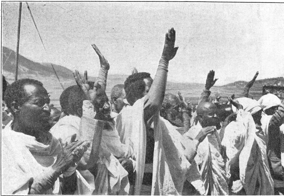
Unterwerfung Eingeborener in Abessinien.

noch nicht festgestellt, wie zahlreich die tieftrauernden Hinterlassenen sind, sicher ist nur, daß an seinem Grabe viele Tränen fließen werden. Der neue abgewertete Schweizer-Franken wird trotz seinem berühmten Vater ein schweres Leben haben. Schon bei seiner Geburt wurde mehr geflucht als gejubelt.