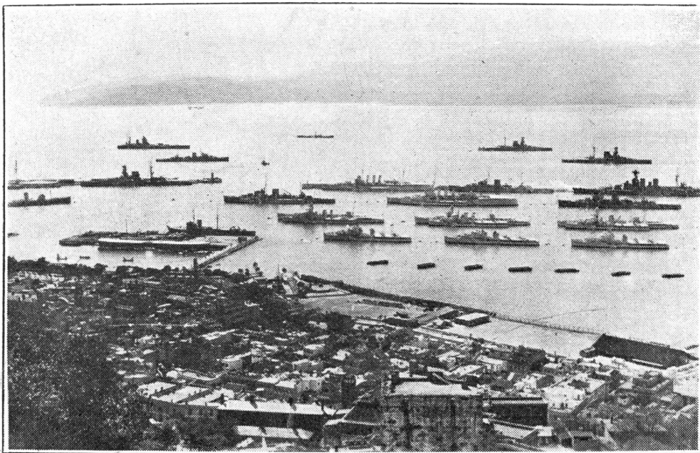
Schlachtschiffe und Kreuzer der englischen Flotte in der Bai von Gibraltar Kriegsbereit für den Fall, daß in Nordafrika die englischen Rechte verletzt würden.

sagt zwar dem Ausland: „Wir haben kein Geld, wir können nicht zahlen.“ Aber für Kanonen, Flugzeuge, Bomben, Uniformen und Gas haben sie Milliarden. Dann hat Hitler auch den Locarno-Pakt in Fetzen gerissen und ist mit seiner waffenstarrenden Reichswehr in die entmilitarisierten Rheinlande eingezogen. Da hats