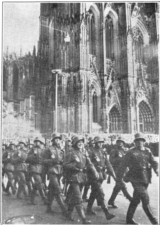
Einzug der deutschen Truppen in Köln am 7. März 1936

gekracht auf dem Pflaster der Rheinland-Städte vom preußischen Tattschritt, so fest, daß der Boden bis nach Paris und London gezittert hat. Frankreich hat gespuckt, geschrien, gehustet, aber zuletzt hat's halt doch schlucken müssen. Solche Heldentaten des Führers imponieren dem deutschen stolzen Volk. Dafür schluckt es dann wieder gehorsam die bitteren Pillen aus der Apotheke Hitler-Rosenberg und Co. Denn was diese sich auf kirchenpolitischem Gebiet erlauben, ist schon richtig zum Erbrechen.