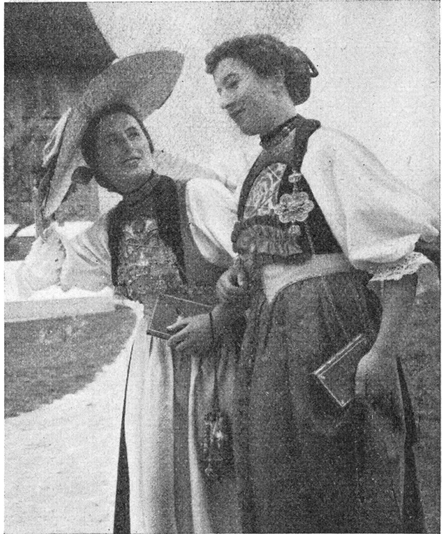
Abb. 3 „Wenn d'Stanfer Meitschi z'Chile gand...“ Sonntagstracht 1938

Die Empire-Mode, der das erste napoleonische Kaiserreich den Namen gab, brachte die Tendenz in Schwung, die Linie der Taille nach oben zu verschieben, die Frau schlank und groß erscheinen zu lassen. Auch der Nidwaldnertracht brachte sie eine neue Linie und ein neues Trachtenstück: den Gürtel (Abb. 2). Er verdrängte die schönen Schürzenbündel und verdeckte die Schneppe des Vorsteckers. Vorn wurde der Gürtel breiter, mit Bändern und Rüschen verziert. Der Vorstecker wurde als Brusttuch nur noch so weit bestickt, als es über dem Gürtel sichtbar blieb. Der „Brisnestel“ wurde kreuzweise über das Brusttuch geschnürt und hielt so das Mieder zusammen. Die alte Sitte, nach der die Frauen nur weiße Leinengöller trugen, fiel weg, und seither, also zirka 1825, waren bei Frauen und Töchtern farbige Göller üblich, welche