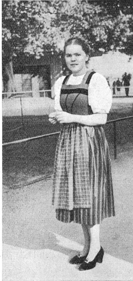
Abb. 5 Werktagstracht 1939

Nachdem die Krinoline bis zirka 1860 regiert, der Rock etwa acht Jahre in vernünftigen Formen sich gefallen hatte, suchte und erfand man neue Modetorheiten. Die Tunika kam in Mode, fing an, sich um die Hüften zu bauschen und entwickelte sich zur Tournaire. Das war jene Epoche, die nochmals unsere Tracht wesentlich veränderte. Die Hüften wurden durch Reuschen künstlich erweitert und gehoben und man trug über diesen Polstern eng gefälte, meist selbst gewobene karierte oder gestreifte Röcke. Die Ärmel, die bisher weich und luftig fielen, werden steif geplättet, gefaltet und „gehandorgelt“. Die Vorderarme schmückte man mit filochierten „Santeli“. Das ist die Tracht, wie sie in letz-