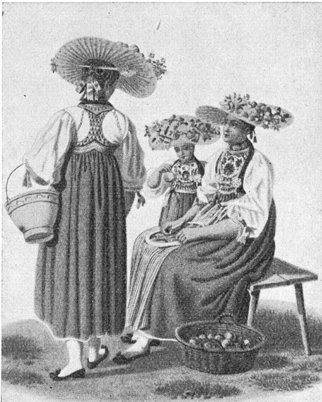
Abb. 2 Nidwaldner Trachtenmädchen um 1830 Aquarell von M. G. Vorn (Sammlung Odermatt-Luffh)

sich im Schnitt gleich blieben bis heute. Rock und Mieder aus Tuch wurden in ungleichen Farben getragen; man liebte abstechende Farben. Am meisten trug man blaue Mieder und rote Röcke. „Scharlachrot und blai, gid ä scheeni Buiräfrai!“