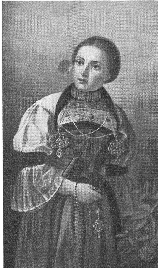
Abb. 4 Nidwaldnerin um 1850 Gemälde von Louis Niederberger (hist. Museum, Stans)

Diese Mode beeinflusste neuerdings unsere Bauerntracht. Auch die Bauersfrau wünschte und zog sich eine Wespentaille und trug die Krinoline. Eine Nidwaldnerin mit Pfeil und Göllerketten in der Krinoline sah wahrhaft wunderbar genug aus. Wer sich davon überzeugen will, betrachte die vergilbte Foto