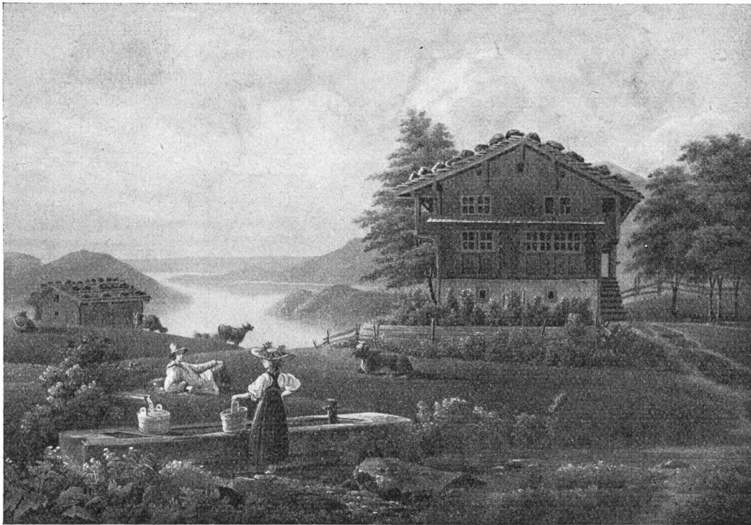
Bauernhaus in Emmetten

Nach einem Stich von M. G. Lory 1839 (hist. Museum, Stans)