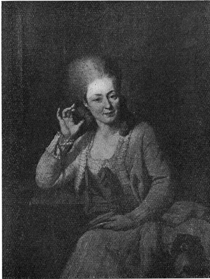
Porträt der Frau Zelger gemalt von J. M. Wyrsch, Buochs

Dann nahm er endlich festen Wohnsitz in Besançon. Im Jahre 1773, nach langen sorgfältigen Vorbereitungen und mühsamen