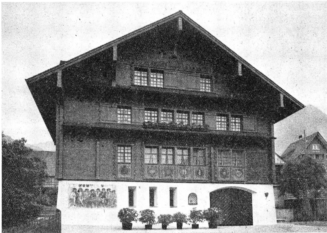
Das renovierte Haus Isenringen zu Beckenried

Vor und zur Zeit der Gründung der Eidgenossenschaft besaßen „Die von Isenringen“ das Burghaus und drei Matten in der Uerte „Enderdorf“ später Isenringen genannt. Das heutige Beckenried bestand damals wie aus dem Engelberger-Urbar von 1190—1197 zu entnehmen ist aus den vier Uerten Mettindorf (Ketschrieden), Oberdorf, Beggenriet und Enderdorf (Isen-