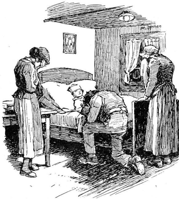
Dann sank der starke Mann neben dem Bettchen in die Knie

vielleicht so früh aufhören müssen mit Deinem Leben, Margritli, weil wir die Mutter nicht ehren? Sind wir an Deinem Sterben schuld, Margritli?“ — Er schaut in die Abendröte der Berge hinauf, als wollte er vom letzten Himmelblau eine Antwort erwarten. Dann sprengt er Weihwasser und geht. Eine paar Schritte weit weg bleibt er stehen, sucht in den Taschen, schaut sich um, ob niemand in der Nähe sei. Er schleicht zurück zum kleinen Grab, packt ein Papier aus, kniet nieder, gräbt mit seinen Händen und setzt die mitgebrachten Wurzeln ein. „Margritli“, sagt er, „sie werden schön blühen bei Dir, liebes Kind.“