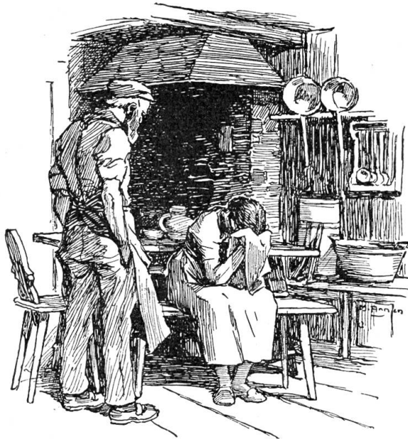
„Oh je! Was habe ich mir für ein Unglück aufgeladen!“

Solche Spässe waren begreiflicherweise nur für den Augenblick angenehm. Nachher mußte Heiri erfahren, daß bei Madlen eine gewisse Kälte an der Tagesordnung war. Er konnte noch so freundlich „Guten Tag“ sagen, mehr als ein kurzes Nicken und ein spitzes „Auch guten Tag“ bekam er nicht zurück. Das spukte in Heiris Kopf wie ein Teufelchen. Je kälter Madlen schien, umso