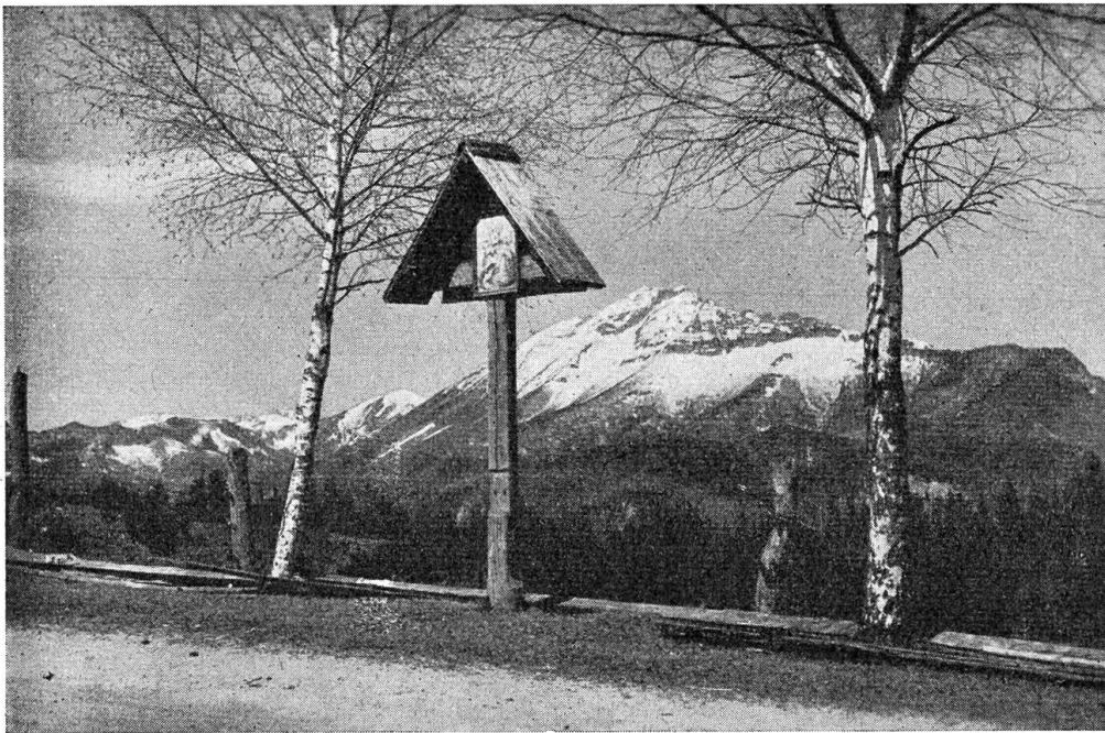
Das Wegkreuz zwischen den Birken