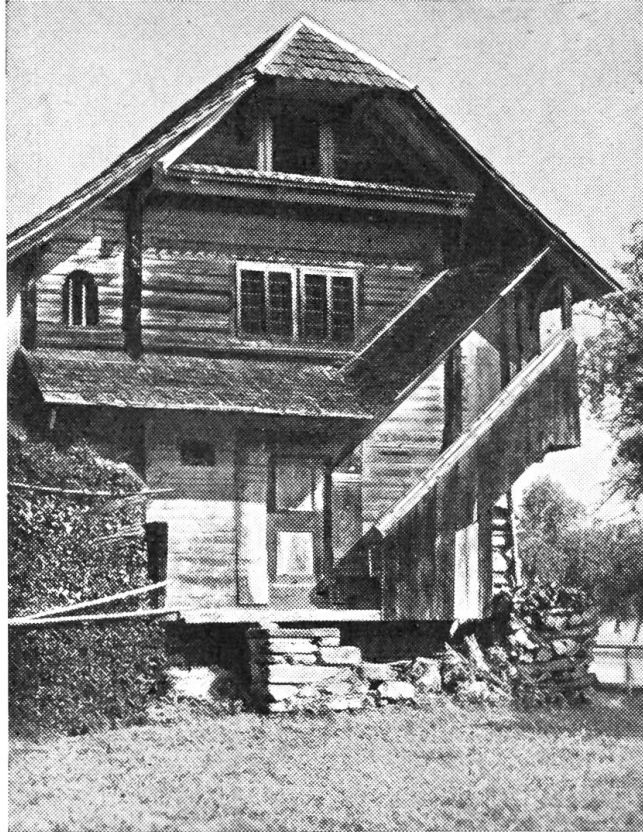
Alter Speicher bei Waldbrücke

Er schaut vor sich hin in den Busch. Eine Spinne spannt ihren Faden von Zweig zu Zweig. Geht zurück, spannt einen zweiten.