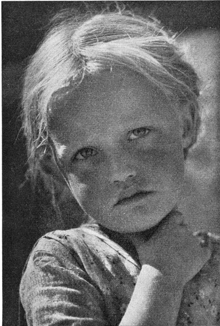
Lieb und verträumt

Hochzeitsfahrt zur Verfügung stellen. — Heiri stieg langsam und bedächtig im Schilthaus die Stiege hinauf. Vielfältige Erinnerungen und vielerlei Gedanken wirbelten ihm durch den Kopf. Und aus dem Herzen stieg die herrliche Freude, am glücklichen Ziel zu sein. Er klopfte bescheiden an die Türe. Die Magd öffnete einen schmalen