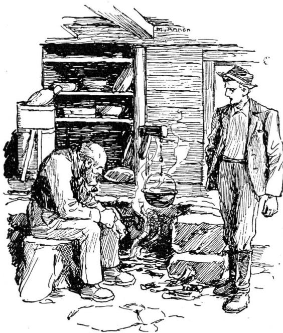
Drinne saß der Mell am Herdfeuer und starrte in die Glut

Mell wollte etwas rasten und setzte sich. Heiri stellte sich breitspurig vor ihn her und sagte: „Mell, Ihr könnt mich zu Grunde richten oder ins Glück hineinlüpfen. So wie Ihr jetzt wollt, wird mein Leben sein.“ Mell meinte: „Mache keine langen Sprü-