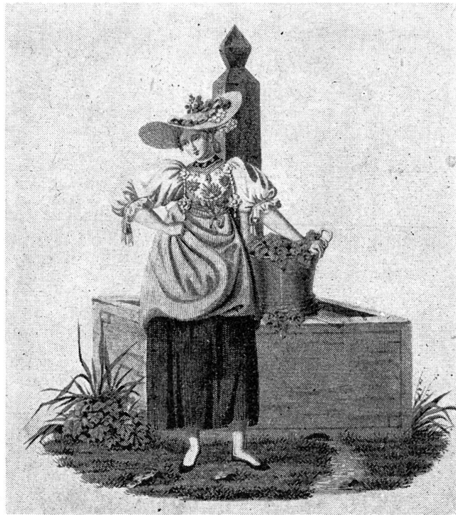
Nidwaldner Trachten-Mädchen im Jahre 1830 (nach einem alten Stich)

Heiri saß in einem andern Dorf in der Hinterstube der Wirtschaft „Zum schwarzen Ochsen“ und aß mit einem gutgekleideten Herrn durchzogenen Bauernspeck, trank feinen Wein und rauchte eine dicke, schwarze Zigarre. — Dieser Herr sprach mit dem Heiri wie ein Freund, schenkte ihm ein und bestellte wieder nach. In der Nacht brachen beide auf und gingen fort. Kurz vor Mitternacht kam Heiri allein in den „Schwarzen Ochsen“ zurück. Oder besser gesagt, er kam nicht ganz allein zurück, denn er hatte ein kleines Käuschlein bei sich, ein übermütiges, lustiges Alkoholteufelchen. Er hätte am liebsten die ganze Welt umarmt. Ein-