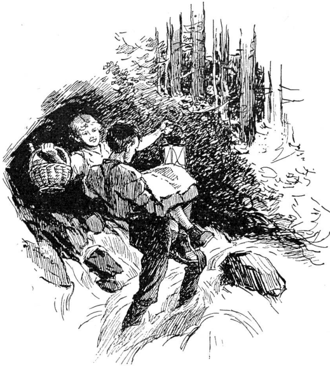
Heiri nimmt im Hui das Mädchen auf die Arme und trägt es in das Wasser hinein

Ruedi schaut einmal hin, warum denn die Großmutter nicht antwortete. Was ist denn das? Sie liegt ja am Boden. Er nimmt den Wurm und eilt zu ihr hin: „Was machst Du da, Großmutter, warum schläfst Du?“ Sie ist vom Stein geglitten und zusammengefunken. „Schau doch den roten Wurm, den schönen roten