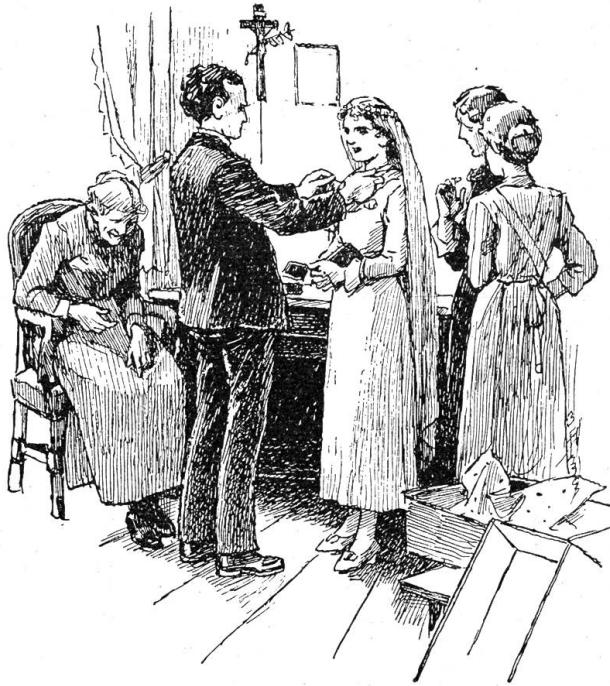
Herrlich lag das Gold auf der weißen Seide

hast.“ Heiri wollte ausweichen, wollte von seinen Arbeiten sprechen. Madlen gab diesmal nicht nach. Tapfer und mit Geduld zwang es seinen Mann zum Reden: „Sag mir alles, was Dein Herz drückt, ich will und darf alles wissen. Du weißt noch nicht, wie gut ich Dir vielleicht helfen kann.“ Heiri setzte sich endlich an den Tisch zu seiner lieben Frau und begann: „Ich habe mit Deinem Vater geredet, damals, da ich um Dich angehalten habe; Du weißt alles, was ich ihm versprochen habe, nur etwas weißt Du nicht. Dein Vater hat eine Bedingung gestellt. Er hat gesagt, ich bin mit der Hochzeit einverstanden, — wenn Madlen nicht zu den Deinen in den Unfrieden einziehen muß, wenn ihr beide allein wohnen und leben wollt. Ich habe das versprochen. Wir haben das Häuschen nur für uns zwei gebaut, für uns zwei allein. Und jetzt ist es so, daß die Großmutter in einer Hölle leben muß in der Schmelde. Jetzt ist es so, daß die Stiefmutter nicht aufhört zu fordern, die Großmutter müsse aus