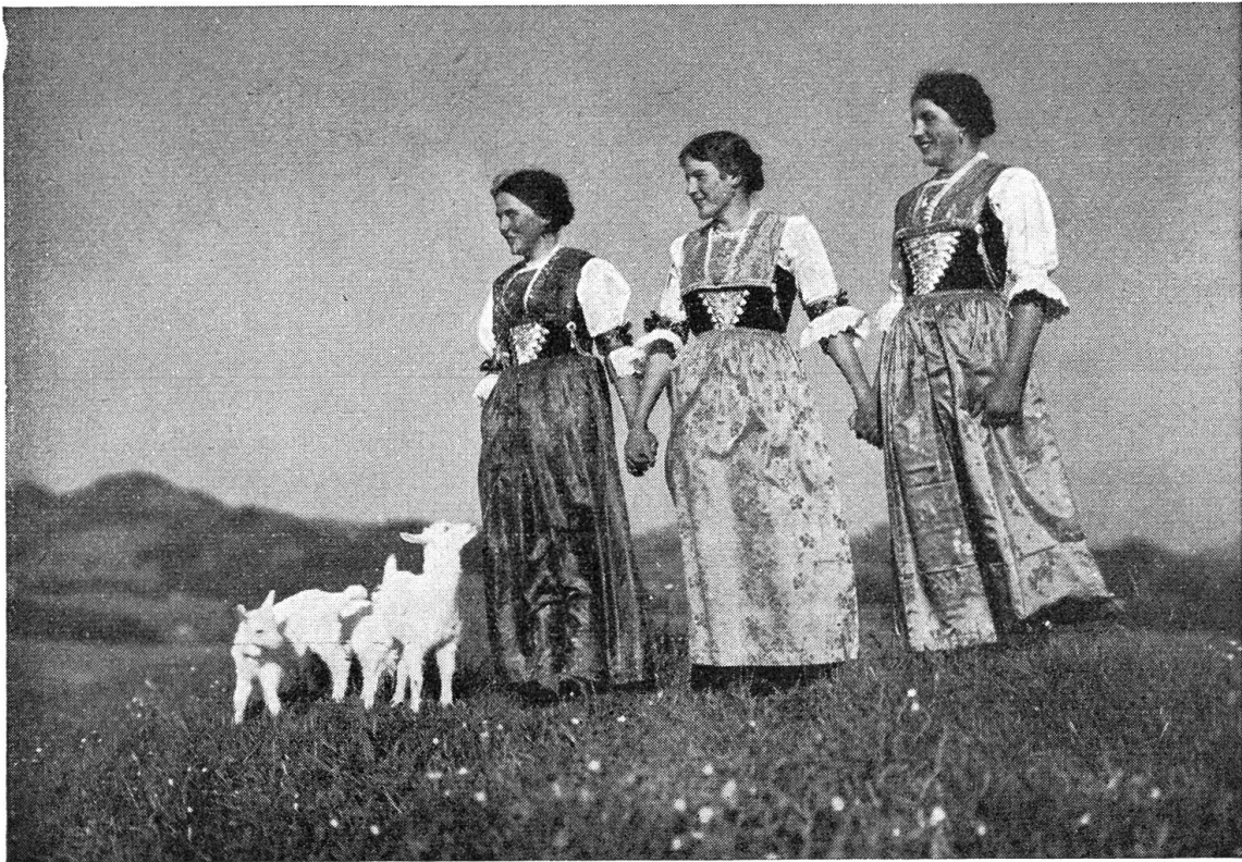
Frohe Appenzellerinnen in der Sonntagstracht

So hat es angefangen. Hans hat schließlich die Kinder in die Stube gejagt und hat gebrüllt, daß diese dort und die Leute auf der Straße jedes Wort verstanden haben. Dann ist er lange Zeit in der Küche hin und