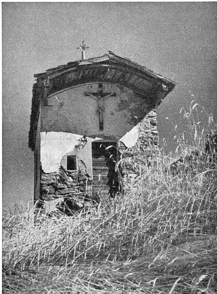
Kapelle St. Martin im Wallis

Die Arbeiten gingen dem Ende entgegen. Ein Fest sollte veranstaltet werden. Melf wollte am Donnerstag persönlich die erste offizielle Fahrt vornehmen. Wie bei einem