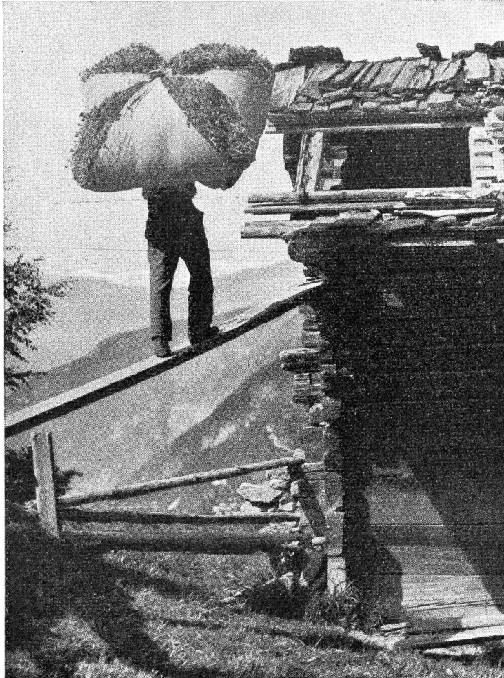
Ein Gifischtal-Bauer trägt sein Emd ein

die ganze Nacht beim großen Nußbaum. Heiri.“ Das Streichholz war längst erloschen. Vom Fenster her kam kalte Luft. Madlen stand unbeweglich mit dem Papier und dem Stein in der Hand. Es wagte sich nicht zu rühren. Es glaubte sein lautes Herzklopfen müsse die Eltern wecken. Es getraute sich nicht mehr ins Bett zu schlüpfen, weil das Krachen der Bettstatt Lärm machen könnte. Und die Schranktüre, wie langsam mußte es öffnen, damit nicht das Quietschen der Angeln sein Ankleiden verraten.