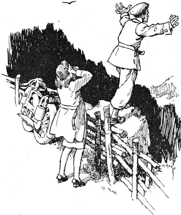
Marie schrie laut auf und bedeckte mit beiden Händen das Gesicht.

Wie einfach war der Diebstahl offenbar geworden. Frau Doktor hatte die Fünzigernote vermisst und gesucht, die sie verlegt hatte. Die Post brachte einen Brief vom Uhrengeschäft, mit dem sie selbst oft verkehrt hatte. Sie achtete sich nicht genau auf die Adresse, öffnete den Brief und sah die Quittung für