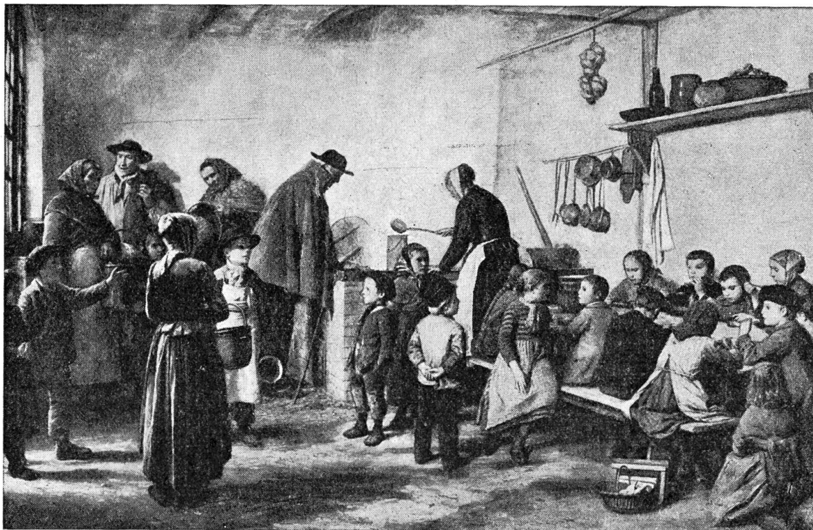
Armenjuppe. Gemälde von Albert Anker.

Fritz wußte auch diese neue Situation zu seinen Gunsten auszuwerten. „Kümmere Dich doch nicht um das Geschimpf und Gezetter“, sagte er zu May, „laß doch die verdrehte Schachtel jammern. Für eine solche Blutsaugerin gibt es nur einen Grundsatz und der heißt: wenn Du mich beleidigst, dann schade ich Dir; Du kannst es doch gut so einrichten, daß sie für jedes böse Wort bezahlen muß. Du kannst das Fleisch in der