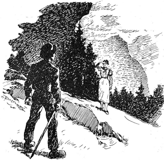
Von der andern Seite kommt eine Gestalt in die Wiese hinein.

und fragt. Und Marieli erzählt eine lange Geschichte: Der Schneetoni ist da gewesen und hat mit mir geredet. Er ist zweidreimal auf dem Erlenmoos gewesen, bis er mich allein getroffen hat. Er hat mich gefragt, was ich für einen Kummer habe. Nun, ich habe gesagt, ich hätte keinen Kummer. Er wollte nicht nachlassen, sagte, er sehe mir das Herzweh in den Augen. Es hat keinen Wert, dem Schneetoni zu widerreden. Er hat mir ein Mittel angegeben, wie das Herzweh plötzlich und immer verschwindet. Du gehst in der Maien-Vollmondnacht auf die Wiese unter der schwarzen Fluh. Dort, nur dort wächst das Kräutlein, er hat es mir beschrieben und gezeigt. Du wartest bis die Uhr die Mitternachtsstunde schlägt.