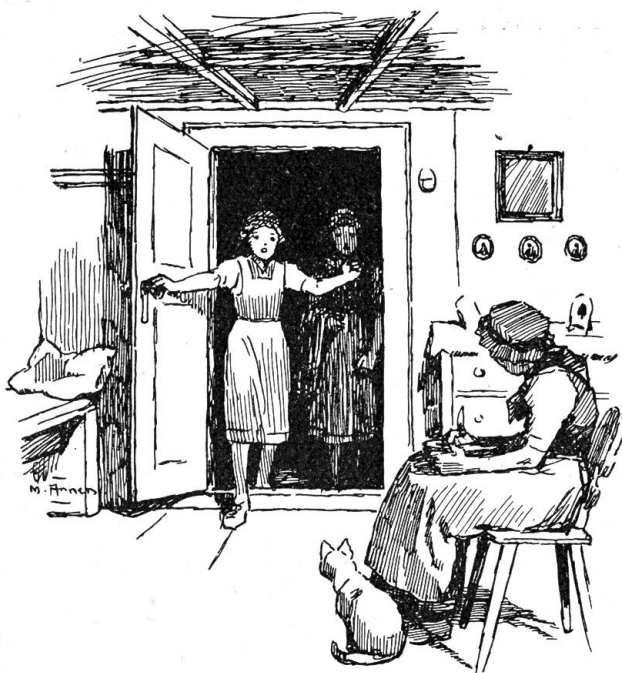
„Vater, Mutter, s'Marie kommt!“

den Schirm und entschuldigte sich. Es wolle ihm auch noch einmal herzlich danken. Ob er nicht tropfnaß geworden sei, ob er auch nicht gedacht habe, es sei schlecht und undankbar, den Schirm nie zurückzubringen. Sepp sagte, er habe den Schirm auch ganz vergessen. Und wegen dem Napfwerden sei es nicht böse gewesen in jener Nacht. Aber was er angetroffen habe zuhause, das sei böse und traurig gewesen: „Mein Vater ist mir in jener Nacht gestorben, ich kam gerade heim zum End. Er war noch gesund und fröhlich, da ich am Morgen fort ging, um die Geißen zu holen.“ Marie konnte so nicht sofort wieder fortgehen, wurde in die Stube gebeten,