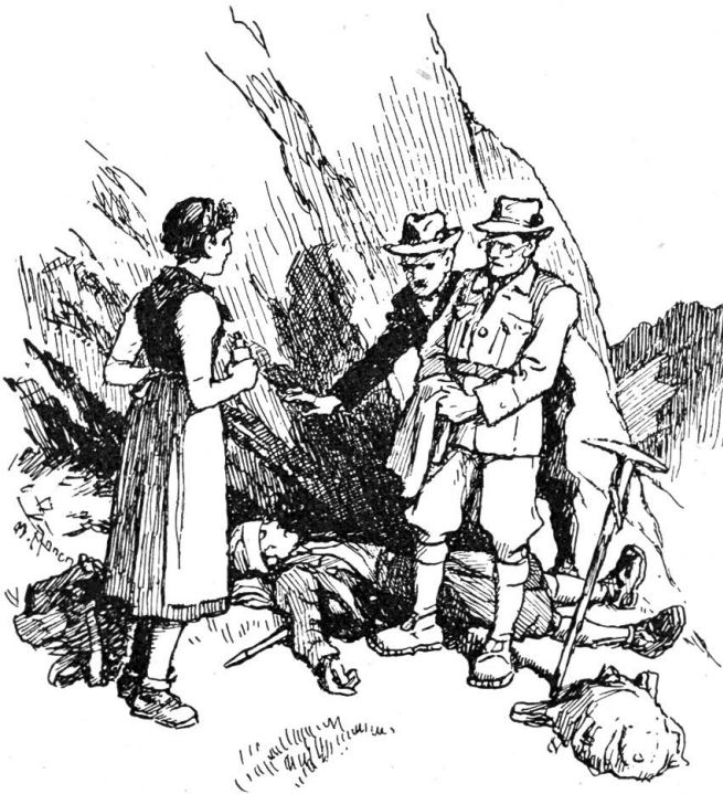
Immer wieder schaute der Arzt in das gesunde, sonnenverbrannte Gesicht

Wenn im Sommer die schweren Gewitter über die Berge ziehen. Wenn der Blitz in die wilden Zacken niederfährt, die schwarzen Wolken gelbe Fahnen und Franzen vorausschicken, der Donner in den Schluchten nimmer aufhört, grollt und rumort, dann hält Mensch und Vieh in Berg und Alp still. Wenn es nur gnädig vorüber geht. — Dagegen kann menschliche Kraft nichts tun. Jetzt sind wir den wilden Gewalten schonungslos ausgeliefert. Es wird dunkel mitten am Tag. Der Regen hängt sich wie eine Wand zwischen Haus und Wald. Nur im Zucken der Blitze sieht man, ob das Haus des Nachbarn