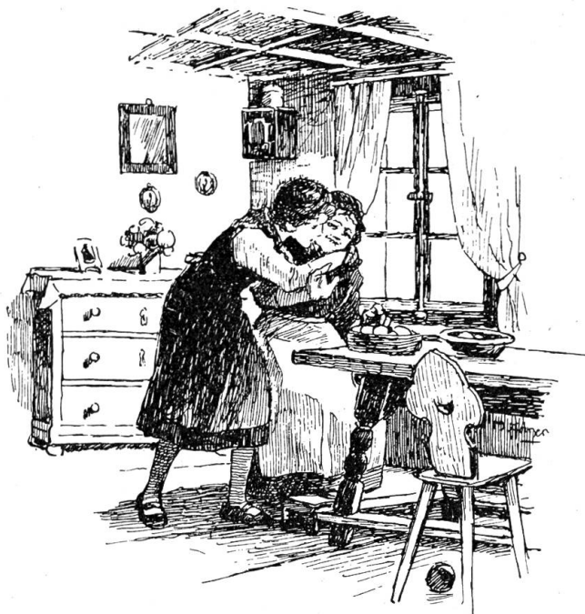
Es schlang beide Arme um ihren Hals

Sie saßen beisammen in der Stube, alle um den Tisch, ruhig und gelassen. Der Sepp erzählte von dem Kreuzifix, das sie an der Haustüre gefunden und wie die Mutter gesagt habe: „Gott will bei uns