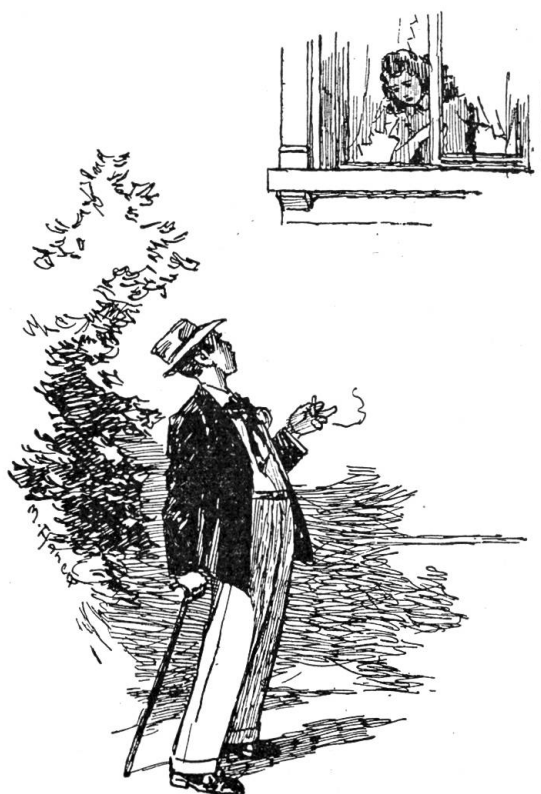
„Kommt herunter, ich habe Dir etwas Wichtiges zu sagen“

Samstag, wenn die Arztfamilie in den Tessin oder in die Bündnerberge verreiste, oder zu Besuch fortfuhr nach Basel oder Genf, dann sagte wohl die Frau Doktor: „May, hören Sie, Sie können dann in die Konditorei gehen und sich etwas Kuchen holen, damit Sie auch etwas haben.“ May bekam so allerhand Gutes für Gaumen und Magen. Aber ihre Einsamkeit in dem großen weiten Hause wurde nur schwerer. Wenn sie stundenlang müßig herumsaß, keine andere Aufgabe hatte, als auf das Telefon zu warten, in allen möglichen Büchern herumschnüffelte und las, dann kamen ungewohnte und gefährliche Gedanken in den hübschen Mädchenkopf. Im Schlafzimmer der Frau Doktor lagen Zeitschriften herum in verschiedenen Sprachen. May verstand nicht viel davon, aber die Bilder genügten, um ihre Phantasie in die wildesten Träumereien zu locken. Eine Welt zeigte sich ihr, von der sie nie etwas gewußt, die aber aufregend und interessant zu sein schien. Eine Welt, zu der auch das Arzthaus gehörte, die Frau Doktor mit den schillernden Kleidern, den prickelnden