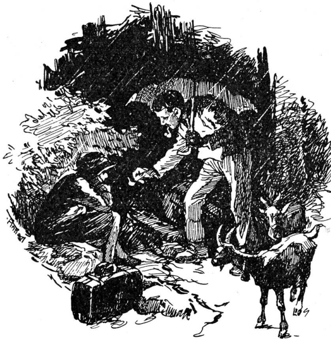
Das Licht des Streichholzes flackerte hell auf

den hatte nun auf seinem Weg ins Tal und auf der andern Seite wieder den Berg hinauf kurzweil genug. So ein feingekleidetes, tropfnasses und verweintes Jüngferlein traf man nicht oft im dunkeln Wald. „Hat keine gute Heimkehr, das Marie“, dachte der Sepp und spürte Mitleid mit dem Mädchen. Er wußte ja nicht, daß er selbst, ohne noch davon zu wissen, auch eine schrecklich traurige Heimkehr erleben mußte. — Marie trat aus dem