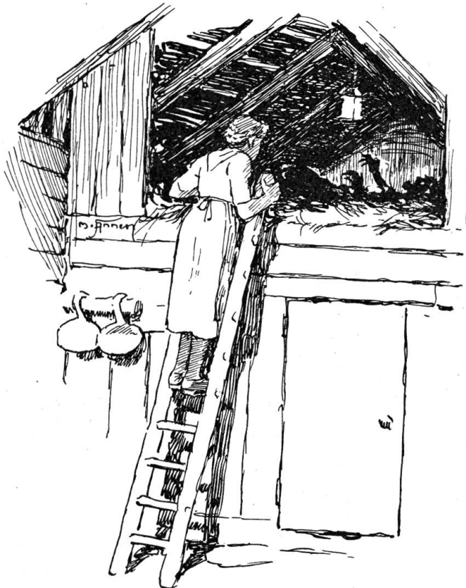
Statt einer Antwort kommen schmerzliche Laute

worden. Hatte sich als Hüterbub und als Sagenfeiler seinen Unterhalt verdient. — Der Waisenvater hatte ihm in seinem Zuegaden ein Zimmer einrichten lassen. Im Sommer war er seit vielen Jahren Hüt auf dieser Kinderalp, die oberste und wildeste Alp weitem. Er war immer ein Einsamer gewesen und ein Eigener. Aber da er für die Arbeit von Haus zu Haus, von Heimen zu Heimen zog, hatte er viele Leute kennen gelernt, in viele Verhältnisse Einblick bekommen. Er hatte eine