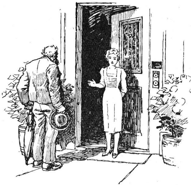
„Also Grüß Gott, Frau Doktor, ich komme wegen der Marie.“

elegant und modern. Mädchen aus wirklich feinen städtischen Verhältnissen. Diese ließ er alle links liegen, nur weil er halt nicht gegen sein gutes Herz handeln könne. Das Herz, das halt ganz ihr gehöre, der May! — Marie wurde bleich und schlank. Die Arbeit wurde ihr zur Last. Müde aus der Stadt heimgekehrt, schaute sie schon wieder nach einem neuen Vergnügen aus. Nur die Zeit, da sie dem Doktor in der Praxis helfen konnte, gefiel ihr.