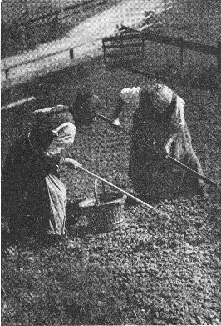
Unermüdlige Hände bei der Kartoffelernte

Kühl war es in der kleinen Bergkirche. — Marieli kniete ganz allein in den vordersten Bänken und betete. Es hatte der Muttergottes so viel zu sagen und viel zu danken. „Liebe Muttergottes, ich habe Dir einmal in großer Not angehalten, Du wollest mir helfen, daß ich Verzeihung erlange. Du hast mir mehr gegeben. Ich danke Dir.“ In so schlichten Worten redete es im Stillen, und versprach, sein Leben immer vor ihr auszubreiten und in ihren Schutz zu stellen. Lange Zeit kniete Marieli dort. Es hörte kaum, wie hinten ein schwerer Männer-