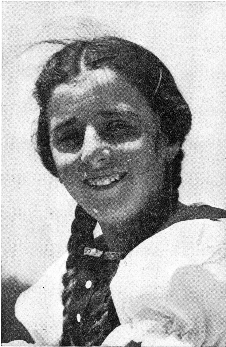
Wind im Haar und Sonne im Gesicht

An jenem schönen Morgen, da die Berge lauter und klar in den blauen Himmel hinaufragten, von den Gletschern ein silberiger Schein, ein hauchdünner Schleier sich