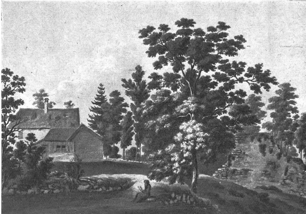
Das Wacht haus auf dem Rogberg mit der Waldbruderklause

eine Treppe führte in die Kammer im Siebel. In der Stube hielt der jeweilige Waldbruder Schule. Weil das Stubli so winzig war, durften nur sechs Buben aufs mal zum „Unterricht erscheinen“. In der Haustüre war ein vergittertes Fensterchen, daraus der Waldbruder Bescheid und Antwort geben konnte. Die Fenster, eines auf jeder Seite, waren umrankt von Reben. Im Herbst hingen weiße und blaue Trauben in Fülle an den sonnenwarmen Wänden. Fremdländische Blumen und Früchte wuch-