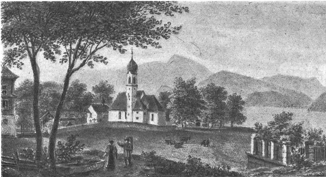
Die Kirche von Hergiswil vor 120 Jahren