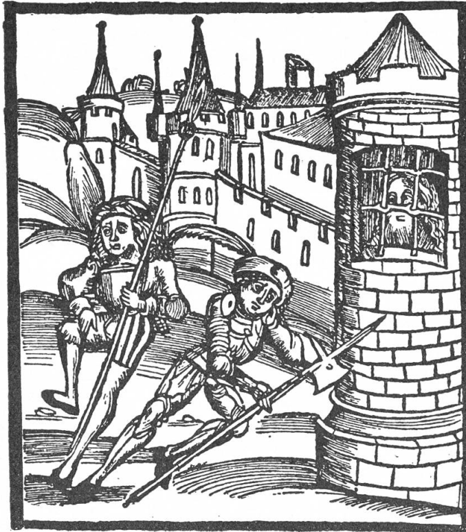
Tollhaus mit Gefangenen und Wache Holzschnitt aus dem Jahre 1507

Gefindel haufte, wo vor Jahrzehnten als letztes Opfer ein Mann ruchlos und unbarmherzig mit Nadelstichen (zweirappigen Gufen) zu Tode gequält wurde. Der Rauch des Lagerfeuers zeigte den Häschern den Standort. Die letzten Räuber aus dem fährenwald verloren auf dem Richtplatz von Obwalden ihr Leben. Der Kernwald war der Sammelplatz zum Aufmarsch nach Gersau an die Feder-Rilwi. Gersau war das Mekka der fahrenden Leute. Aus der ganzen Schweiz, aus dem Welschland und