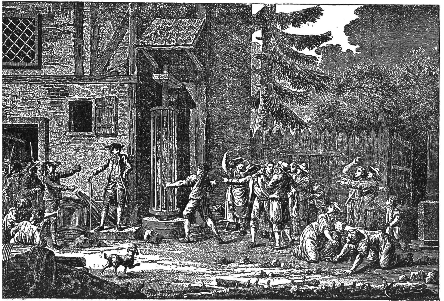
Die Trülle zu Bern Kupferstich vom Jahre 1780

Ort zu heiß geworden — flugs — war er mit einem Sprung in Schutz und Gerichtsbarkeit eines andern Herrn. Im Schwarzwald wimmelte es von Bettlern und Taugenichtsen, von da war der Weg frei in die Eidgenossenschaft, die mit den verschiedenen souveränen Kantonen die gleichen Vorteile bot wie Schwaben.