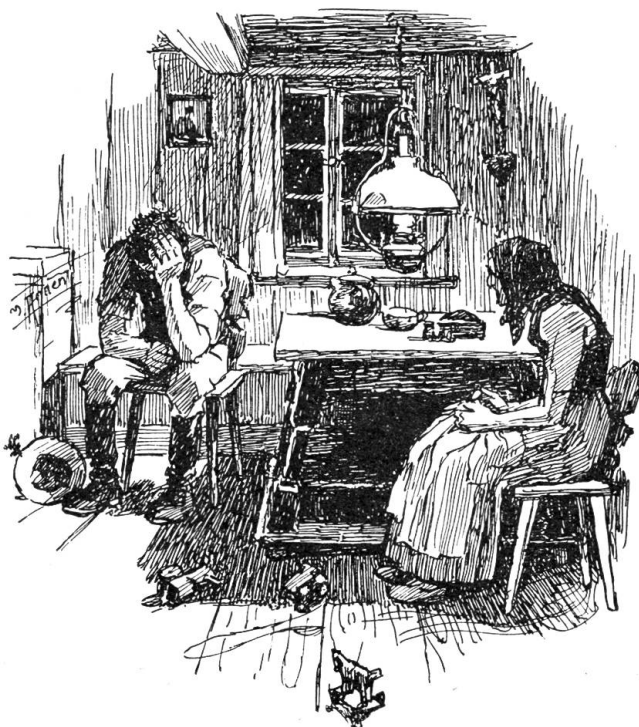
„Mutter, mir geht es schlecht!“

kaputt am Boden. Die Lampe rußte. Soll es nun immer so bleiben? Er stützte die Ellbogen auf die Knie, verschränkte die Hände und starrete auf den Boden. Die Mutter schaute einige Mal verstohlen zu ihm hinüber, sagte aber nichts. Nur ihre Lippen bewegten sich unaufhörlich. Lenz, der starke, stämmige Lenz, der beste Holzzer weit im Tal, der waghalsige unerschrockene Kerl, weinte. Aus seinen weit offenen Augen rannen Tränen, fielen auf seine Hände und auf den schmutzigen Boden hinab: „Mutter, mir geht es schlecht!“ Die Mutter legte die Arbeit vor sich auf den Tisch. Sie, die ihm immer abgeraten, die immer gewarnt und schwarz gesehen hatte,