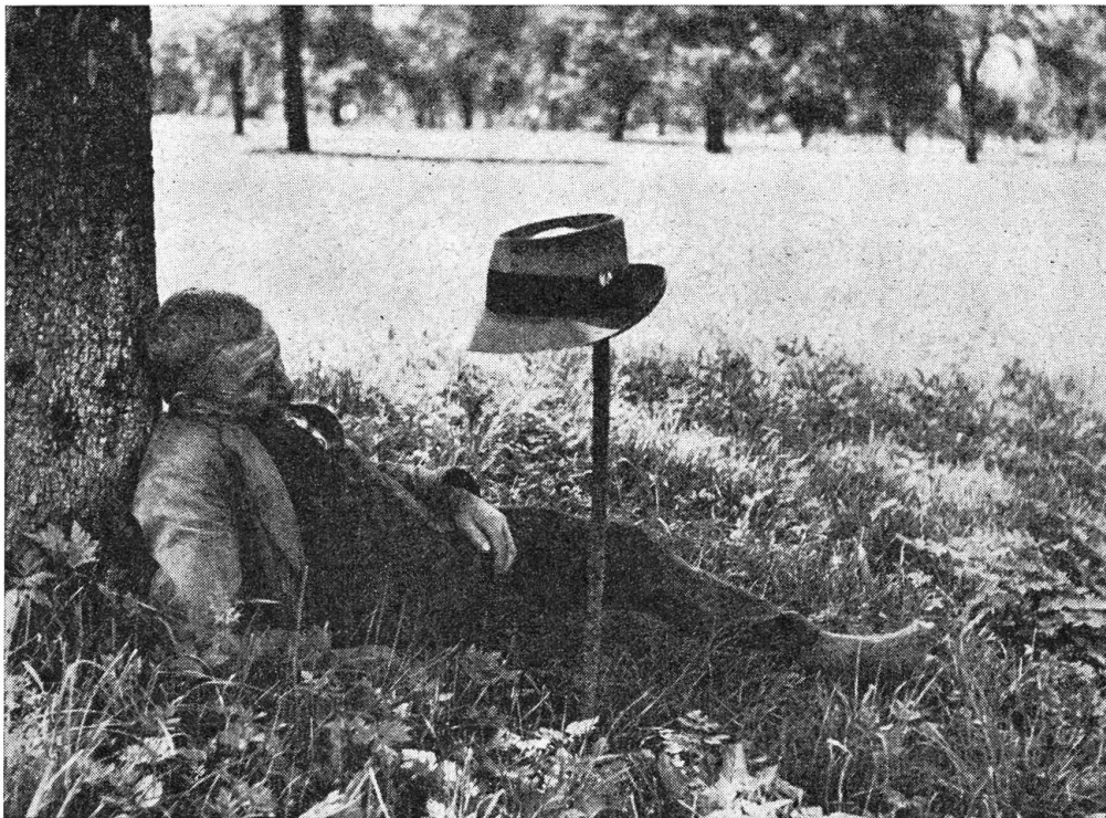
Ein Ruhestündchen im Schatten