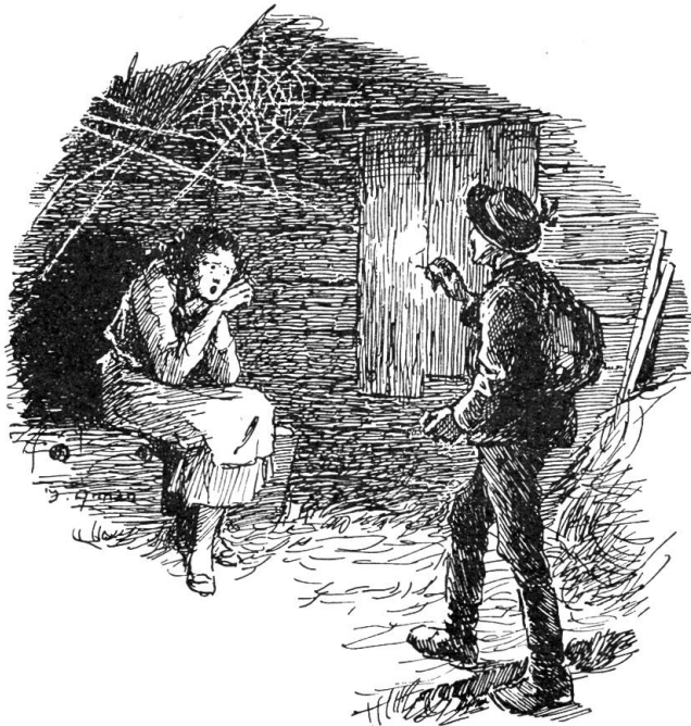
Er geht mit seinem flackernden Streichholz näher

Im Winter sah man die Gerichtsherren auf das Rathaus zur Sitzung gehen. Dort hatten sie über des Brunnen-Thades an-