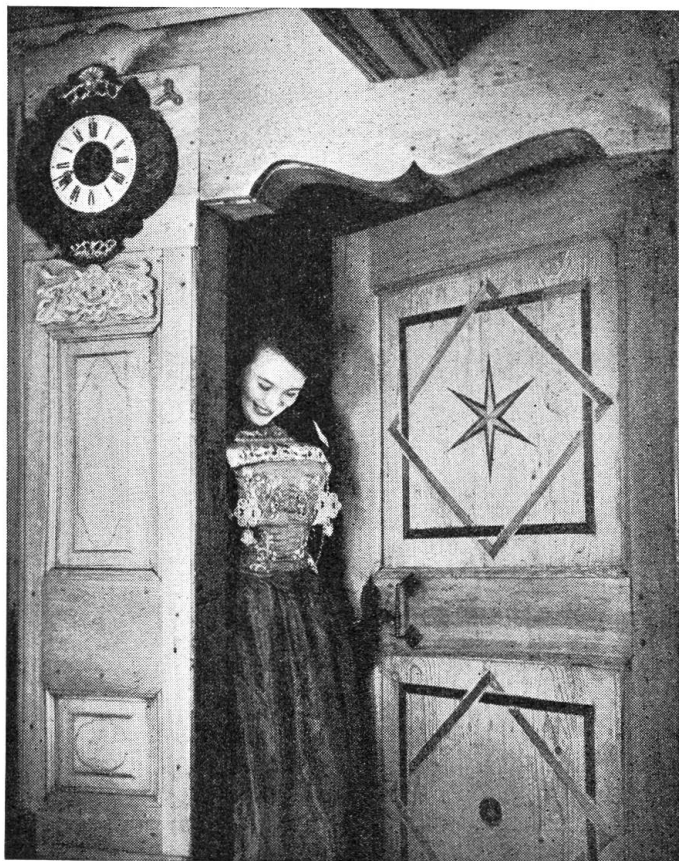
Zwischen Kammer und Stube im schönen Nidwaldnerhaus

Lenz packt seinen Rucksack, gießt vom Frühstück Milchkaffee in eine Flasche, nimmt