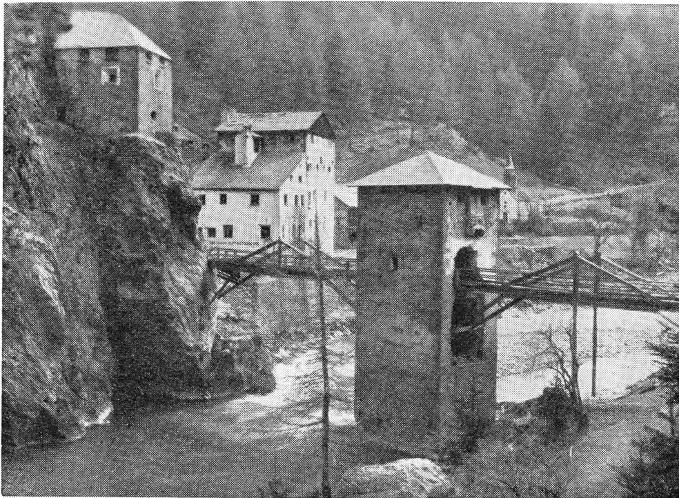
Die historisch bedeutungsvolle und auffallend eigenartige Brücke über den Inn, die das Bündnerland mit dem Tirol verbindet, wurde ein Raub der Flammen

Nicht nur im Hinterbühl, überall im Dorf und im ganzen Tal wurde die Mel-