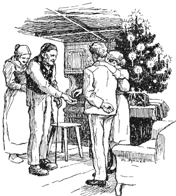
In seiner Hand glitzerte golden der Widerschein vom Christbaum

nassen Augen verbergen wollte. Später kam er wieder an den Tisch und sagte: „Ich habe nach dem Wetter geschaut und da habe ich gesehen, wie die Balken unseres Gadens in den gut fünf Jahren schon braun geworden sind. Lenz, Du kamst damals zum Aufbauen zum ersten Mal zu uns. Aufbauen, wahrhaft und wahrhaft aufbauen soll immer Dein Beruf sein.“ — Die Mutter brachte Gläser und Wein, Teller und Kröpfli. Der Bruder stand auf und sagte dem Elsi im