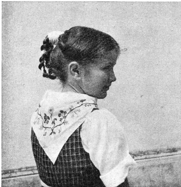
Ein liebes Urnerli

Seite vertrieben, kamen sie auf der andern Seite wieder herzu. Könntest dem Lenz alle Schulden bezahlen und eine Existenz gründen. Ach, was für eine Riesenfreude hätte der Lenz. Mußt wohl sonst warten, bis Du alt bist, kannst dann gleich eine alte Griesli-Frau werden. Probiers doch einmal, schlaf ein wenig, wenn Du dann noch rechtzeitig erwachst, kannst Du dich immer noch besinnen. Eine einzige Spritze weniger bringt ihn nicht