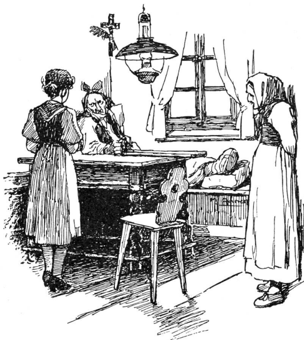
Ihm war so leid um den Vater

wahrhafte, unveränderliche Sicherheit: lieber in Not und Elend hinein gehen, aber mit dem Lenz zusammen gehen. — Nur das Herz nicht töten lassen. Nur jetzt nicht ein Versprechen ablegen und dem Lenz untreu werden. Der Vater geriet immer mehr in Aufregung. Die Mutter kannte ihr Brenili nicht mehr. So hatten sie es noch nie erlebt. Ihr liebes Mädchen, das sonst immer so fügsam, so heiter, hilfsbereit, so anhänglich und vorsorglich gewesen war.