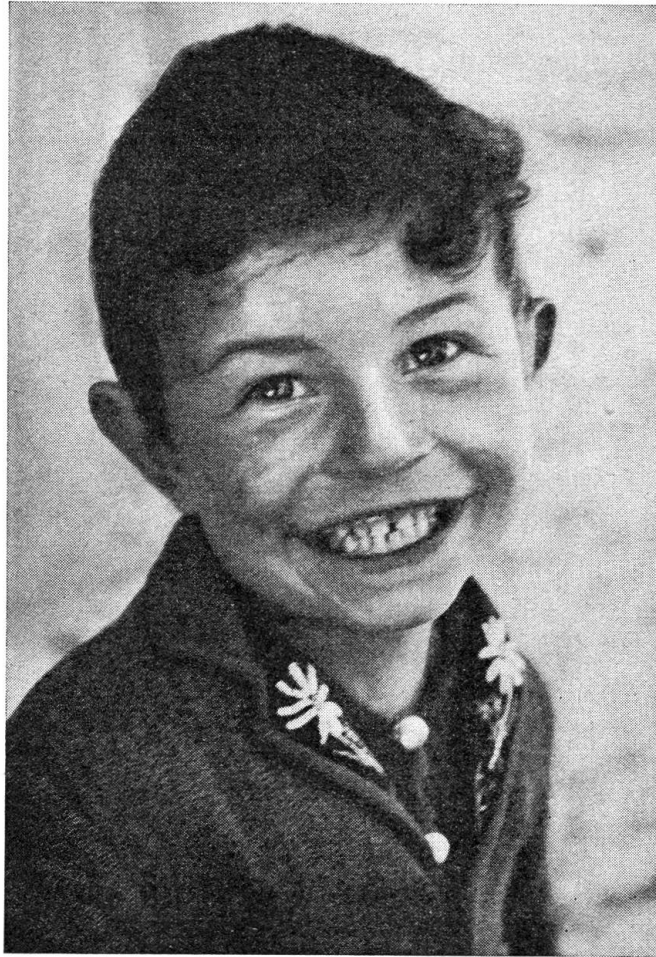
Ich bin-e lustige Ländlerbueb

das und das machen, und ich kann es einfach nicht, habe es nie gelernt und weiß in aller Welt nicht, wie man das machen kann. Bin ich dann verpflichtet, das trotzdem zu tun?“ „Nein“, lachte Lenz, „zu so etwas kann Dich kein Mensch, nicht einmal Gott im Himmel verpflichten.“ „Ist das wahr, ist das ganz sicher wahr?“ Feierlich sprach Lenz mit tiefer Stimme: „Ja, das ist wahr, wie der Bundesbrief.“ Da jubelte Brenili: „Ei, jetzt weiß ich Bescheid, jetzt bin ich aber ganz ganz sicher. Ich hab's nämlich probiert. Die ganze Woche lang habe ich es probiert und es ist mir einfach nicht ge-