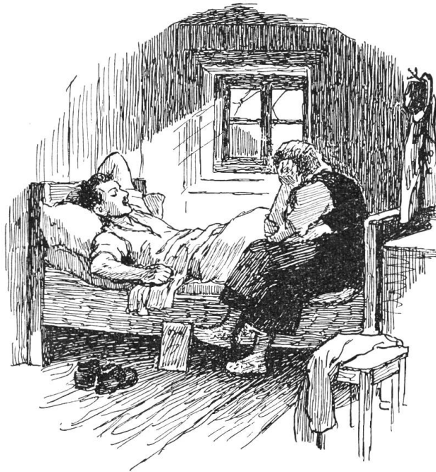
„Armer Lenz“, sagte die Mutter still

blonden, wilden Haare, die glatte braune Haut, der eigensinnig geschwungene Mund mit den schmalen, roten Lippen. So hatte der Vater ausgesehen, so frisch und so lieb, da er zu ihr kam als junger Freier. Damals der stolze Bauernsohn. Wie oft hatte sie ihn später in seinem glücklichen Schlummer zugegesehen, konnte nicht genug auf dieses liebe Gesicht hinunterschauen. Dann kam der Kummer und die Not und grub Furchen in die frische Haut, und dann die Krankheit, höhnte die Wangen aus und welkte die Haare. Was wird wohl aus dem lieben Gesicht, das jetzt so frisch und so glücklich schlafend vor ihr liegt.