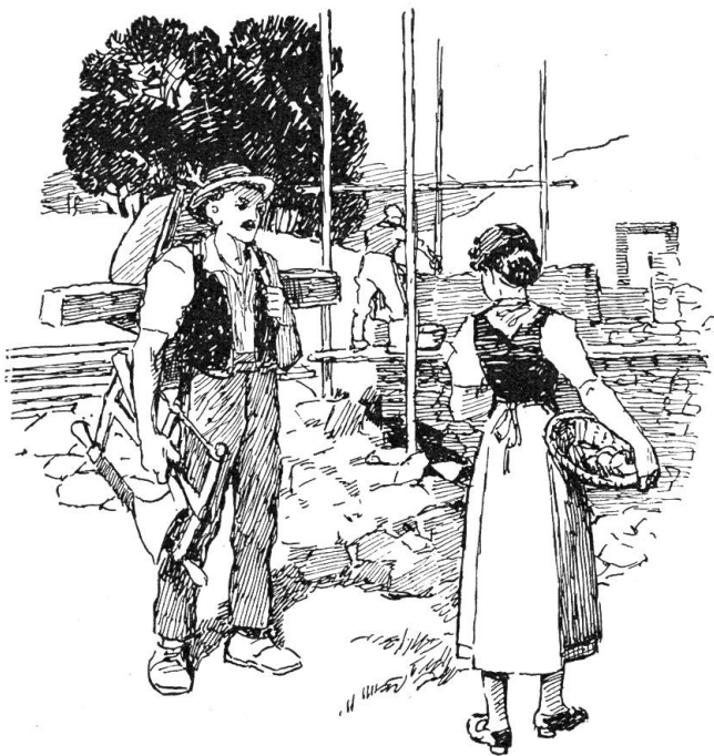
„Griß Gott, Fräulein!“

in jede Ritze und jeden Spalt, verglich die Pläne und Maße. Sein einziger Sohn war eben von der landwirtschaftlichen Schule heimgekommen. Er wurde auch zu allen Beratungen zugezogen. Die älteste Tochter Elfi freute sich nicht so sehr an dem Bau. Die vielen Leute, die dadurch ins Haus kamen, brachten Schmutz und Dreck in die Stuben und vermehrte Arbeit. Elfi benahm sich gern etwas zimperlich. Es schützte seine glänzend schwarzen Haare vor jedem Stäubchen mit einem bunten schmucken Kopftuch. Es ärger- te sich über jeden Wassertropf auf seiner weißen Bluse und pflegte seine Hände jedesmal nach dem Geschirrabwaschen mit einer Creme. Elfi war hochgewachsen und von anmutiger Gestalt. Sein Gesicht war auffällig schön. Diese Schönheit trug Elfi selbstbewußt und wirkungsvoll zur Schau. Die jungen Burschen im Dorf nannten das Elfi: des Hinterbühl-Melken-Pfau. Brenili, seine jüngere Schwester, war ein einfaches Kind. Viel-