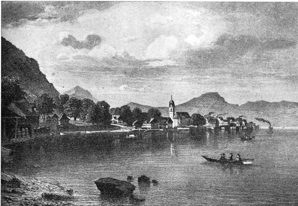
Beckenried nach einem alten Stich

Schönheitsgefühl, aus der Tradition heraus gebaut. Die bestehenden Holzbauten wieder um etwas verbessert, in ihrer Art verschönert. Aber sie sind in der gesunden Linie geblieben. Jedes dieser Häuser sitzt wie aus dem Boden gewachsen in dem schönen Tal drin. Sie haben früher auch praktisch und bequem und sparsam gebaut, aber sie haben nicht nur praktisch, bequem und sparsam gebaut, sie haben für ein schönes Haus Sinn gehabt. Von diesen Leuten muß man lernen. Die haben wohl gewußt, daß ein