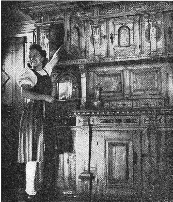
Der schönste Schmuck im Nidwaldnerhaus

Schmuck, wie aus dem Boden gewachsen, so bodenständig und wahrhaft auf dem weit herum sichtbaren Auslug und war nun zum Einzug bereit. Zuerst zog in das neue Haus der liebe Herrgott ein. Der Priester aus dem Dorf segnete den Eingang, durchschritt alle Zimmer, besprengte alle Räume. Lenz trug ihm den Weihwasserkessel nach. Feierlich, mit der Stola bekleidet, sprach der Priester die heiligen Worte. Die weißen Haare umrahmten sein würdevolles Gesicht. In der Stube war schon das Kreuzifix aufgehängt. Das war das Erste und noch das Ein-