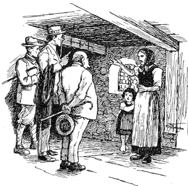
Die Herren fragen, was diese Kreuze zu bedeuten haben

Ein gutes Mädchen, lieb mit den Armen und wohlthätig. Das ganze Tal geriet in Aufregung. Leute meldeten sich freiwillig beim Turmherr. Die Regierung und das Gericht wurden aufgeboten. Nirgends fand man eine Spur. Nur eine Kräuterafrau wollte hier in der Nähe des Mädchens Stimme gehört haben, fürchterlich weinen und schreien. Die hohe Gewalt ließ das Haus hier auf dem Hochegg umstel-