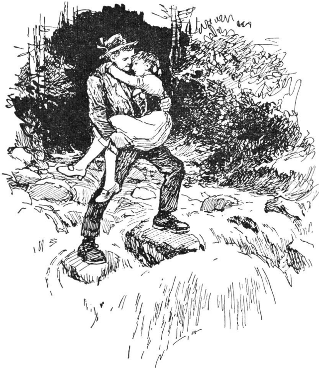
So trägt er es von Stein zu Stein