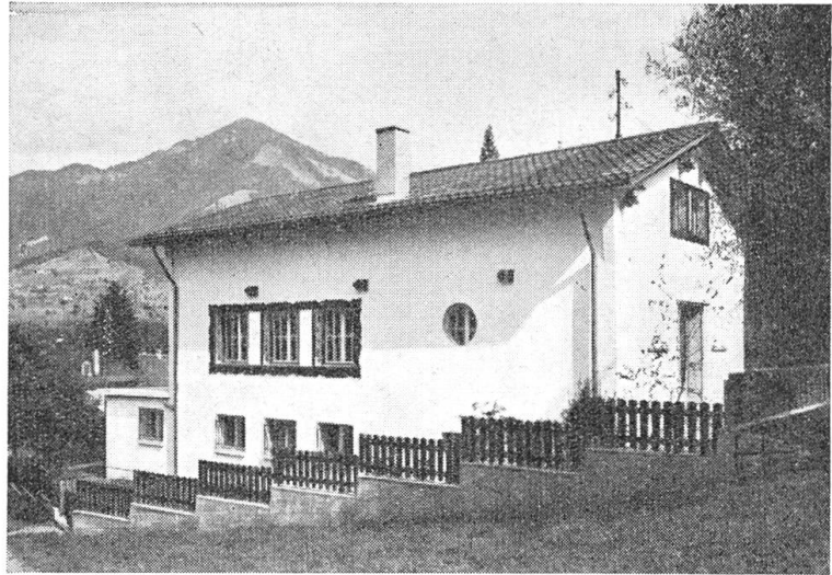
Gesellenhaus-Ansicht von der Westseite

Was die Gesellen in den Vorträgen gehört, was sie als Programm in ihren Sitzungen hochhalten, das haben sie in diesem Haus zur Tat werden lassen. Jeder Fensterrahmen, jedes Schmiedeisenstück, jedes Möbel, alle kleinen Einzelheiten zeigen Qualitätsarbeit. Geräumig und zweckmäßig, praktisch und leistungsfähig sind die beiden Werkstätten für Holz- und für Metallarbeiten. Geschmackvoll ausgebaut und heimelig eingerichtet ist der Vortragsaal, der durch eine bewegliche Wand in eine große und eine kleine Stube verwandelt werden kann. Eine wärschafte Balkendecke, schmucke Vorhängli, hübsch abgetöntes Holz, eine Eckbank zieren den gemütlichen Raum. Gegen den Winter zu und im frühen Frühling wird im offenen Kamin ein munteres Feuerlein bren-