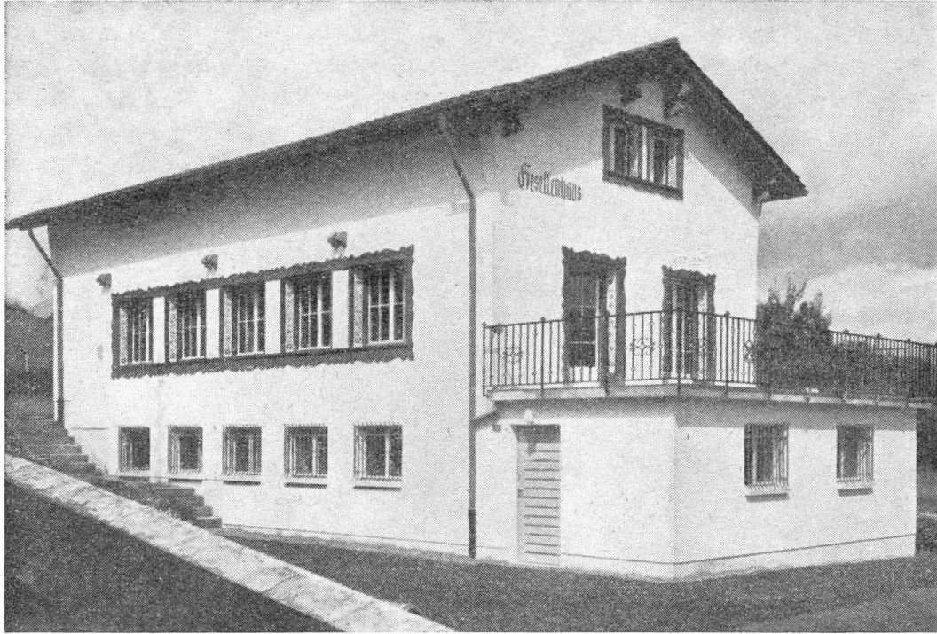
Das Gesellenhaus in Stans, von der Knirigasse aus gesehen