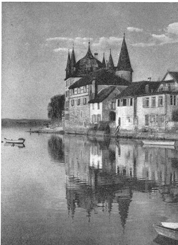
Idyll von Stebborn am Untersee

farbigen Blumen, einen knallroten schmalen Gürtel und kräftige Wildlederschuhe. Sie zeigte mit ihren feingliederigen Fingern elegant zu jedem Fenster, zu jedem Geranienstock, zu jedem gutgeformten Giebel hinauf. Der lange Herr kam hinterher, blieb immer wieder stehen und notierte und zeichnete in einen großen Schreibblock hinein. So sahen die Frauen zuhause mehr von