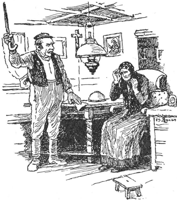
Den Stock hob er in die Luft und drohte zu schlagen.

kam Madlen so ganz selbstverständlich aus dem Gespräch heraus auf den Grund seines Besuches zu reden: „Ich bin eigentlich gekommen, um eine wichtige Sache mit Euch zu besprechen. Ich möchte Euch eine ganz neue Idee zum Ueberdenken vorlegen. Der Professor und seine Frau sind reiche Leute und möchten hier ein Haus kaufen, um im Sommer da zu wohnen. Und nicht nur deshalb. Der Professor ist ein Forscher und ein Sammler, er sammelt alles, was mit seiner Wissenschaft zusammenhängt, alte Trachten, alte Kübel, verzierte Brennten, Bilder von Volkszenen, alte Stiche, und weiß der Himmel was. Er schreibt dann Bücher darüber. Diese Sammlung möchte er hier im abgelegenen Tal sicher unterbringen, das braucht sehr viel Raum. Dabei muß im selben Haus jemand das ganze Jahr wohnen, weil ja diese Sammlung sehr wertvoll sei. Nun ist er auf die Idee gekommen, daß Euer großes Haus und die Anbauten für seine Zwecke außerordentlich dienlich sein würden.“