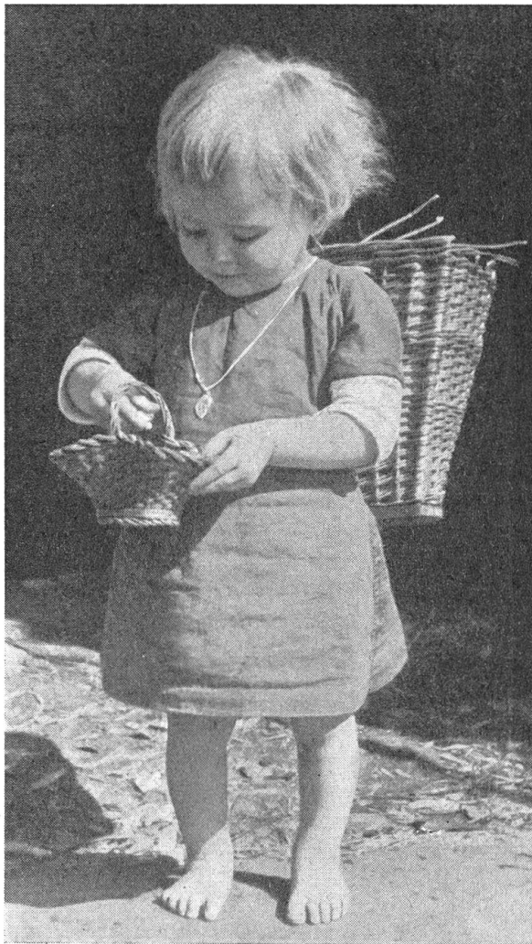
Vom Einkaufen zurück

Madlen hatte gedacht, im Pfarrhof ein ruhiges gleichmäßiges Leben zu finden. Abgeschlossen vom Zanf der Welt. Nun erlebte es, daß der Streit der Parteien und der ewige Unfrieden hier erst recht Einlaß begehrt. Von beiden Parteien kamen die hitzigen Vertreter und verlangten vom Pfarrer eine entschiedene öffentliche Stellungnahme für ihre Interessen. Oftmals verlangten sie ein Recht das unrecht war.