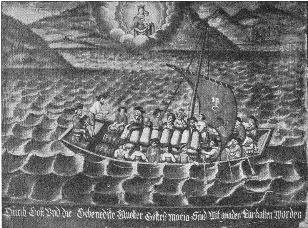
Nidwaldner Marktmauen in Seenot Totivbild in der Niedlikapelle bei Beckenried

Da soll so ein Mädchenkopf Wahrheit und Spintifizerei, Richtiges und Falsches schön genau auseinanderhalten können. —