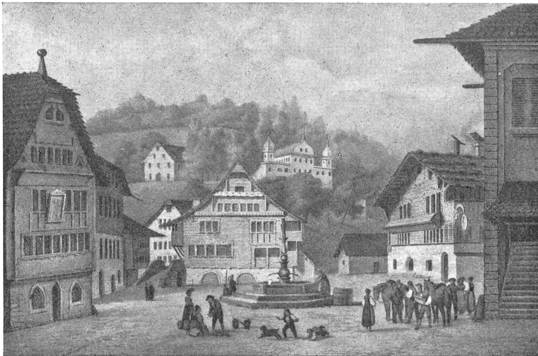
Der Dorfplatz von Sarnen nach einem alten Stich

Die schmale Straße war hier an die rechte Felswand gedrückt. Links säumte ein halbverfaultes Holzgeländer den rauhen Weg. Martin dachte daran, daß man notwendig wieder einmal das Geländer ausflicken sollte. Aber in diesem ewigen Sprühregen vom Bach herauf verfault ja das beste Hartholz. Das Brausen und Toben des Baches und das Sausen und Pfeifen des Windes hüllten ihn ein. Einen Augenblick zwar glaubte Martin über sich einen Klang zu