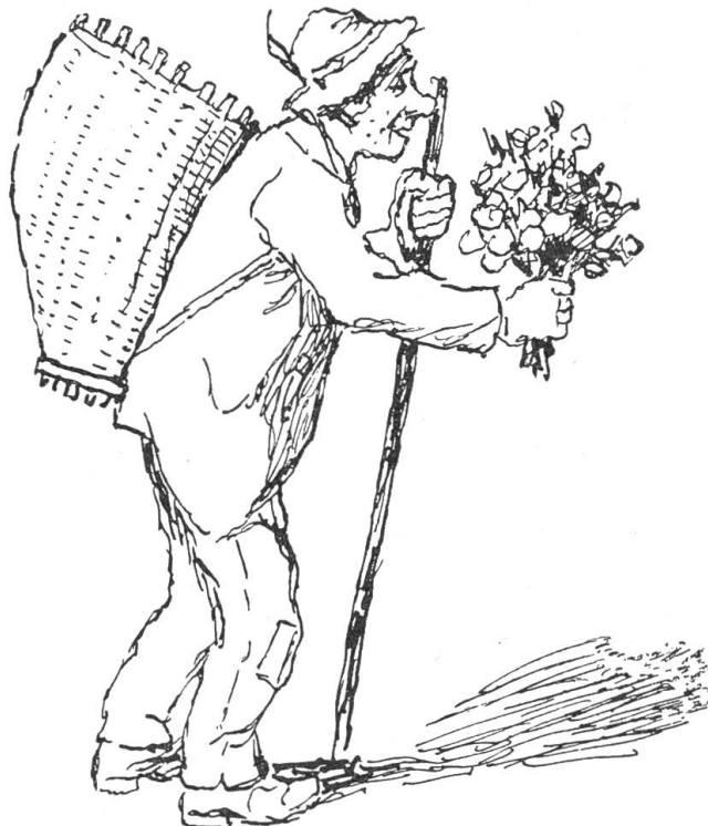
Durch die Menge drängte sich ein Mann in schmutzigem Arbeitskittel, in verrußten Händen hielt er einen Blumenstrauß.

an. Bald aber wurde er sicher und ruhig und schaute gelassen über die paar tausend Köpfe hin. Er erzählte von dem späten Frühling und dem frühen Herbst im Ribimoos. Von dem kleinen Stück Land, das bei ihnen zu jedem Heimen gehört. Aber nur kurz streifte er diese Tatsachen. Dann sprach er von den Fronarbeiten und dem Mut, den sie bewiesen, immer wieder auf eigene Kraft anzufangen. Dann bekam seine Stimme die volle Kraft: „Jetzt stehen wir vor