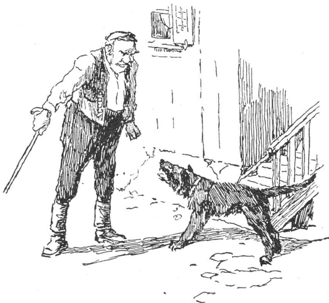
Der Sageler geht mit seinem Stock unbekümmert auf den Kläffer zu.

das Gesicht von einem tiefen Schmerz. Die kräftigen Glieder, der mächtige kraftstrotzende Körper liegt lahm und hilflos da. Langsam kommen kräftigere Atemzüge, aber kein Wort. — Dann hört man das Auto des Arztes. Scheinwerfer blenden hinein. Die Autotüre schlägt zu. Der Arzt tritt in die Stube, kniet neben der Bahre auf den Boden und untersucht. Die Männer gehen hinaus. Sie warten in der Küche. — Der Arzt