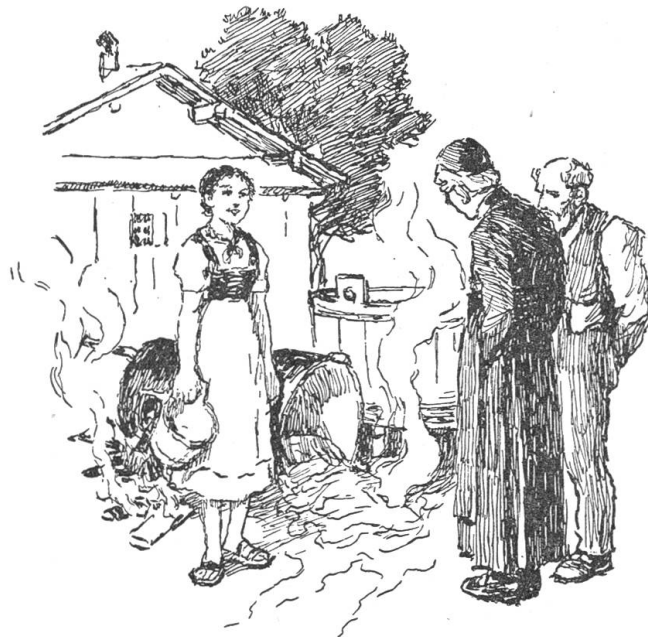
„Ich kann Euch die Hand nicht geben Herr Pfarrer.“

Dir gut, Madlen?“ „Ich kann Euch die Hand nicht geben, Herr Pfarrer, so eine pechschwarze Hand. Aber sonst geht es mir gut.“ Es schaute an sich hinunter, auf die bloßen Füße in seinen Holzschuhen und auf die Bescherung ringsumher und dann lachte es dem Pfarrer froh ins Gesicht: „Ausgenommen, daß Ihr gerade dazukommen müßt. Das ist jetzt so etwas wie mein Hauswirtschaftsexamen. Aber es ist nicht so schlimm, Ihr könnt ja, wie niemand sonst ein Geheimnis bewahren.“ Der Pfarrer nickte und bot ihm trotz dem Ruß die Hand. Dann kam die Mutter und s'Bethli. Wie vom Schrecken angenagelt blieb sie stehen, einen Augenblick lang verhüllte sie mit bei-