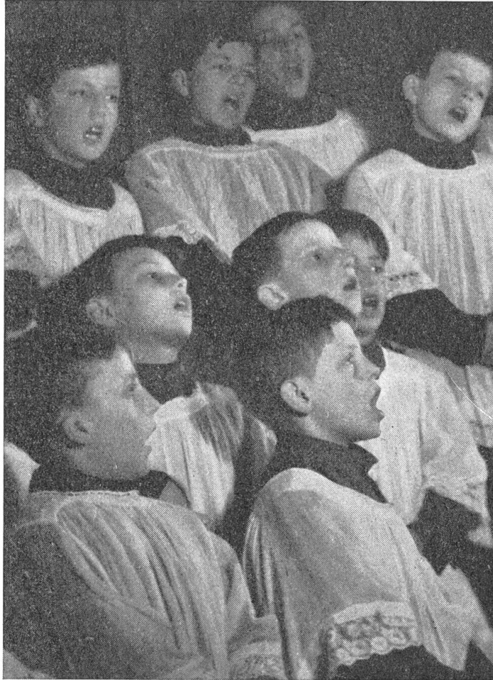
Die Fryburger Singbuben

Madlen kam nicht aus dem Staunen heraus. Ja, ist denn das wirklich wahr,