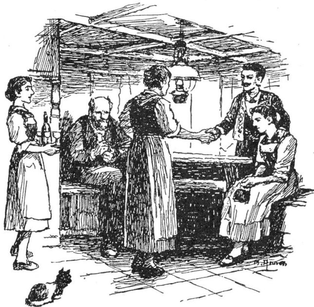
Die Mutter besann sich auf einmal, daß sie das auch schon lange hätte tun können.

Ein sehr tiefster Sonntag ging über das Dorf hin. Eine Mahnung, die von Jedem verstanden wurde. Eine Warnung, die bis zu unterst ins Herz hinein drang. Am andern Morgen rief die Totenglocke wieder, rief alle Leute, aus jedem Haus, vom äußersten Heimen und von der hintersten Hütte zusammen, zum Leichengebet und zur Beerdigung. Sie kamen alle. Ein langer Zug bewegte sich von der Sagi her zum Friedhof hinauf. Und dort geschah etwas, was seit Menschengedenken nicht mehr vorgekommen war. Der Pfarrer wendete sich