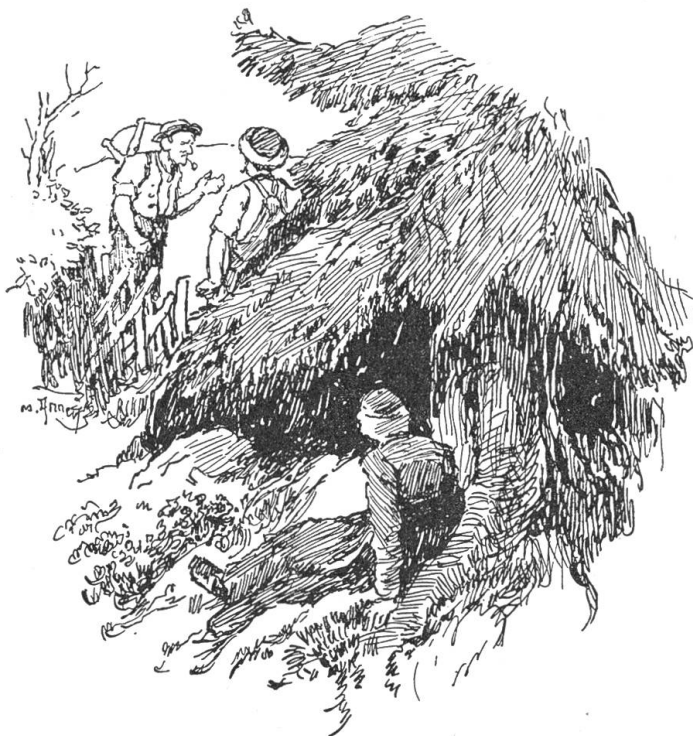
„Aber wenn einer vom Teufel geritten wird, dann...“

ecke herüber, stellte ihm ein Glas Wein und einen Teller voll Mailänderli hin. Bald mußte Bethli den kleinen Konradli und das Marieli ins Bett bringen. Immer noch kam der Pfarrer nicht mit seinem Anliegen daher. Er redete davon, wie die drei größeren Meitschi doch prächtig gedeihen. Es sei eine wahre Freude diese aufblühende Jugend zu sehen. Dann blieb er wieder stumm und wartete, bis die andern sprachen. Madlen merkte gut, wie der Pfarrer um eine Sache herumrede und fragte, ob er gerne hätte,