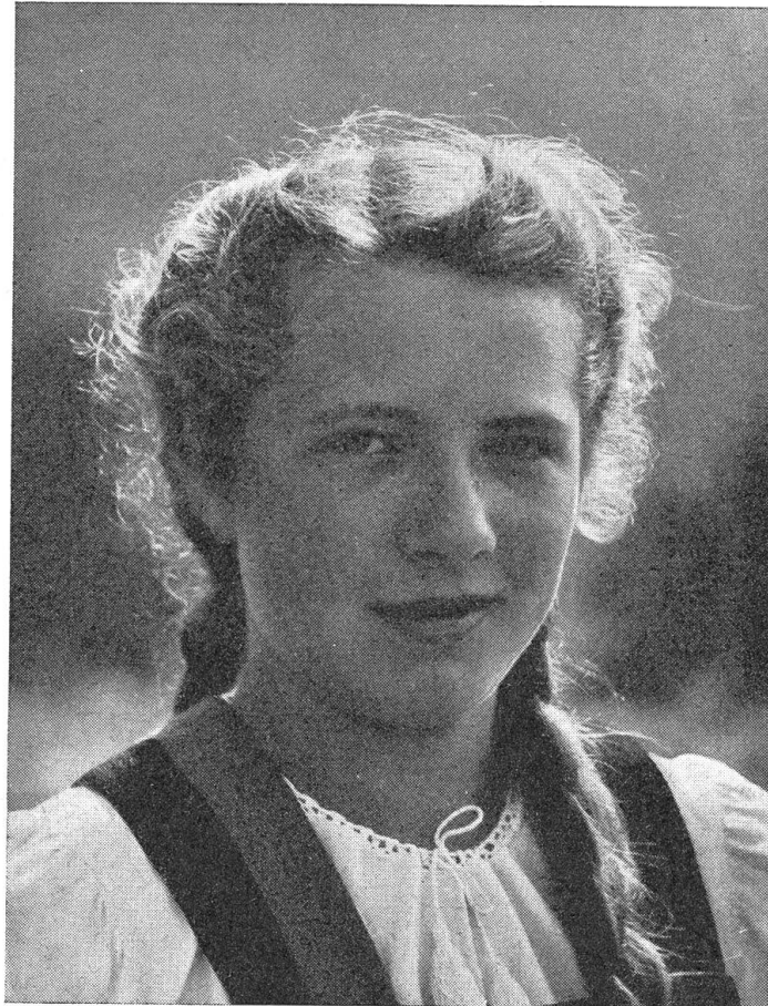
s'Martili ab der Birg

ihm, nun kann er den gnädigen Herrn spielen, kann zum Mitfahren einladen und die schwere Last auf den Wagen nehmen. Und überdies ist das gar keine gebückte runzelige Frau, das ist ja das Madlen vom Haselboden. Heissa, wie er das Paket und den Rucksack hinausschwingt und dann mit einem sanften Ruck das Mädchen neben seinen Platz hinsetzt. „Hü Fanny, hü, das ist jetzt aber ein wunderbares Gfekl, daß ich Dich grad treffe da, wo es so stotzig bergauf geht. Wie auf die Sekunde, wie im Fahrplan.“ Und Madlen meint: „Besser kann mans wirklich nicht haben. Schön eben aus zu Fuß und bergauf mit zwei starken Rossen, das ist wie ein Kindertraum.“ — Karli legt die Geißel neben sich hin, er braucht die nicht mehr. Die Gäule gehen ihm so schon schnell genug. Er pfeift wieder und schaut in die Matten hinaus und verstohlen dreht er den Blick immer wieder zu dem Mädchen hinüber. Wie es so schön brav dasitzt, die Hände im Schoß. Welch zartweicher Glanz liegt auf den braunen Backen und der hohen Stirne. Die Brauen zeichnen feck geschwungene Bogen über die Augen. Und die roten Lippen sind wie eine seltene aufquellende Frucht. „Träumst Du viel“, fragt er. „Warum?“ „Ja weil Du so genau weißt, wie ein Kindertraum ist. Ich meine nur so, wie träumst Du denn seit Du erwachsen bist?“ „Selten, fast nie.“ Karli pfeift wieder einen langen Satz und dann