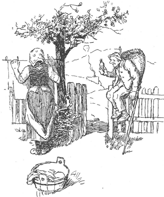
„Schaut einmal diesen Enzenschnaps, lauter wie Kristall.“

sagte resolut: „Jetzt kannst gehen, jetzt ist's genug, da hört der Spaß auf. Paß Deine sieben Sachen und verdufte.“ Franzzi griff nach seinem Tragkorb, holte eine Flasche heraus, hielt sie gegen das Sonnenlicht und sagte: „Schaut einmal diesen Enzenschnaps, lauter wie Bergkristall, und mild wie alter Burgunder und dann eine Wärme im Magen, eine wohlige Wärme, ein Seelenwärmer, Gottes beste Medizin... und billig, für Euch zwei Franken weniger, wegen dem heutigen Unglück. Eine Flasche? ... Zwei Flaschen?“ ... Aber er