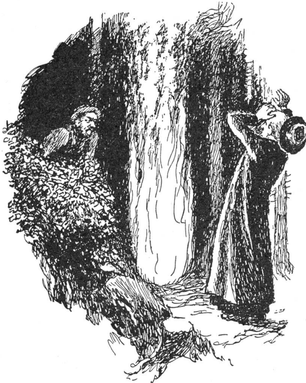
Urpötzlich zischte vor ihm ein helles Feuer, eine Riesenflamme vom Boden auf.

Das war falsch. Das hätte er nicht sagen sollen. Denn jetzt wird der Enzenfranzi bleich um die Nase, jetzt richtet er sich hoch auf. Seine Augen rollen und zeigen leuchtend weiße Ränder. Dann kommen Worte unter dem struppigen Schnauz hervor, die den Sageler bleich werden lassen. „Sag Du uns jetzt hier“, schreit der Enzenfranzi,