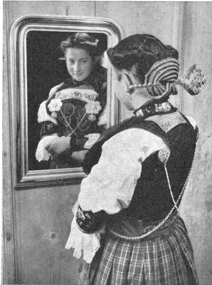
Midwaldner-Meitschi Photo Leonard von Matt

strahlt die Sonne wieder aus einem wolkenlosen Himmel. Nur in der Sonntagnacht kann der Wind nicht mehr aufschonen, wie er auch die Nußbäume zaust und strahlt. Sein Brausen ist übertönt vom fernen Donnern. Blitze fahren in die Wolken hinein, in die Wälder, in die Felsen. Weit her grollt und murrst das kommende Gewitter. Alle Fenster und Türen werden verschlossen. Die Lichter löschen aus. Vom Wald her kommt