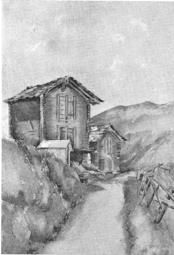
Am Weg nach Eggen im Wallis

— „Jawohl.“ — „Bravo!“ „Abstimmen.“ Die lauten Rufe nach der Abstimmung wollten nicht mehr aufhören. — Kein anderer Redner kam mehr zum Wort. Der Doktor plumpste schwerfällig von seinem hohen Standort auf den