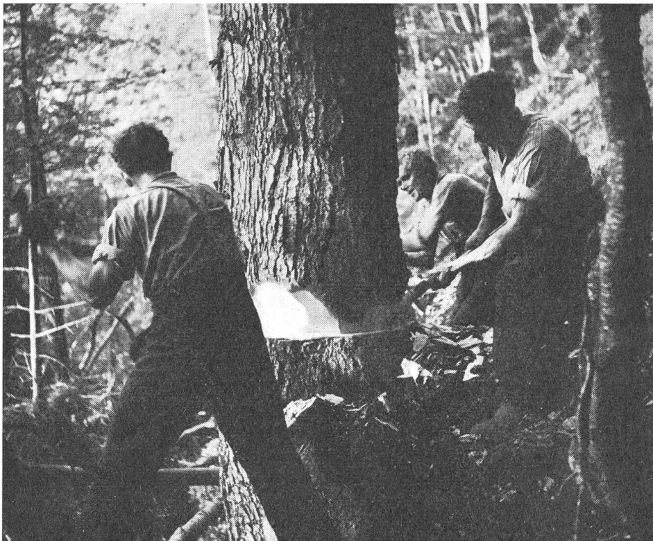
Holzer im Bergwald

hier auf dem Vogthaus sitzt und waltet und so dem Gesetz alles Vergänglichen getrotzt hat. Jedes Jahr führen die Leute mit der Madonna zu Tal zur Prozession, die nirgends sonst, nur in Tunderbach abgehalten wird. Und jedes Jahr kam sie in feierlichem Zug wieder zurück. Aber einmal drang im Herbst fürchterliche Kriegsnot ins Land. Die Franzosen verwüsteten Tal um Tal, brannten Kirchen aus und steckten die Häuser an, erstachen Kinder und Frauen