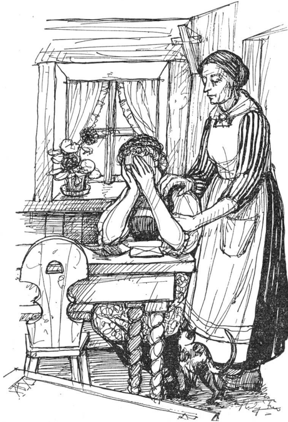
Da sie keine Antwort erhielt, trat sie näher.

Auf der Kommode in der Stube steht eine alte Uhr auf vergoldeten Füßen. Zier-