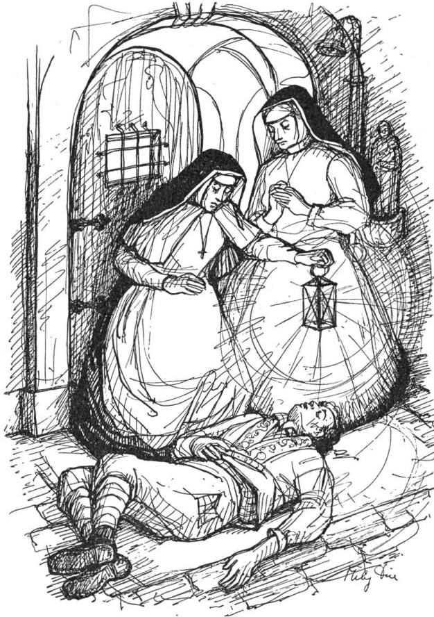
„Hilf, Himmel, ein toter Mann!“

sie da die Pforte öffnen? Die Mutter Priorin fragen und sie deswegen extra aus dem Schlaf aufschrecken? Zweifel und Angst plagten sie. Ach wäre sie doch nie Pförtnerin geworden! Solch außergewöhnliche Vorfälle zerstörten jeden Seelenfrieden. Auf der Treppe blieb sie zögernd stehen. Sollte sie hinauf zur Mutter Priorin, oder zur Pforte? Sie wollte warten, ob noch ein zweites Mal geläutet würde. Das