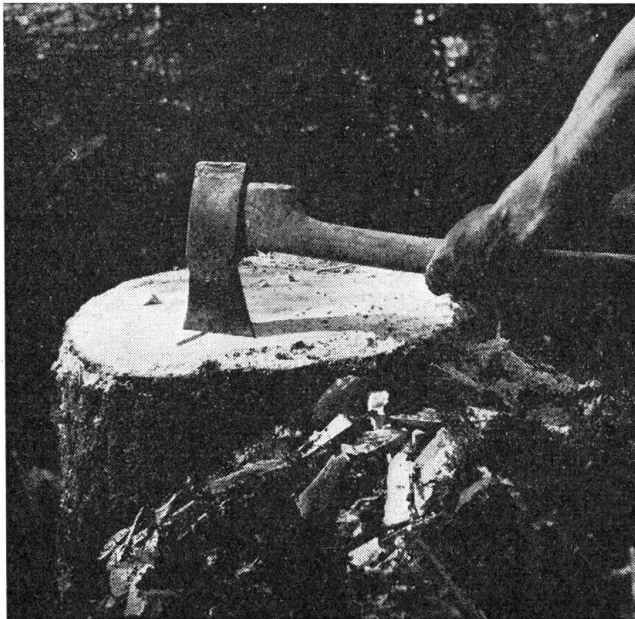
Das Holzerkreuz im Baumstumpf

Am Sonntag nach dieser wichtigen Genossengemeinde kamen die Männer vom langen Loch noch viel später zum Mittagessen. Wiederum hielt sie eine Gemeindeversammlung zurück. Aber nicht im kleinen Schulhaus, nein im großen Saal in Tunderbach. Das Dorf im Talboden, die Leute im langen Loch und auf Hohenau und die weit verstreuten Heimwesen gegen