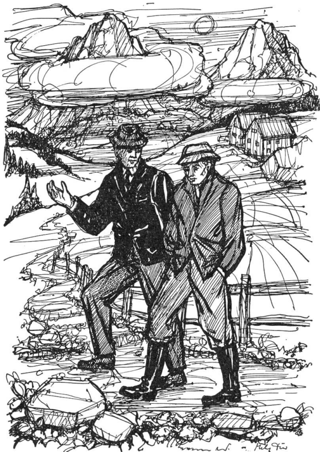
Bald fingen die ersten Flocken zu tanzen an.