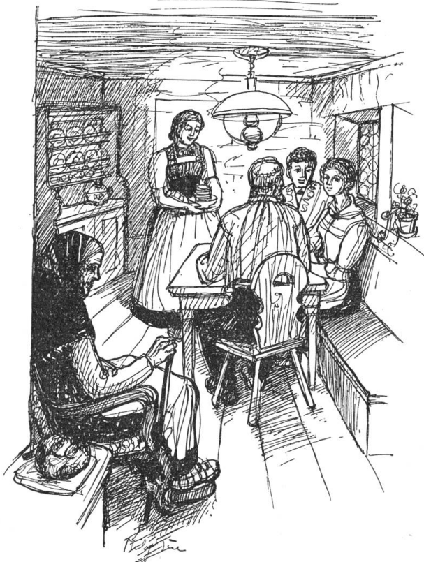
Nun kam in der Stube eine heitere Fröhlichkeit auf.