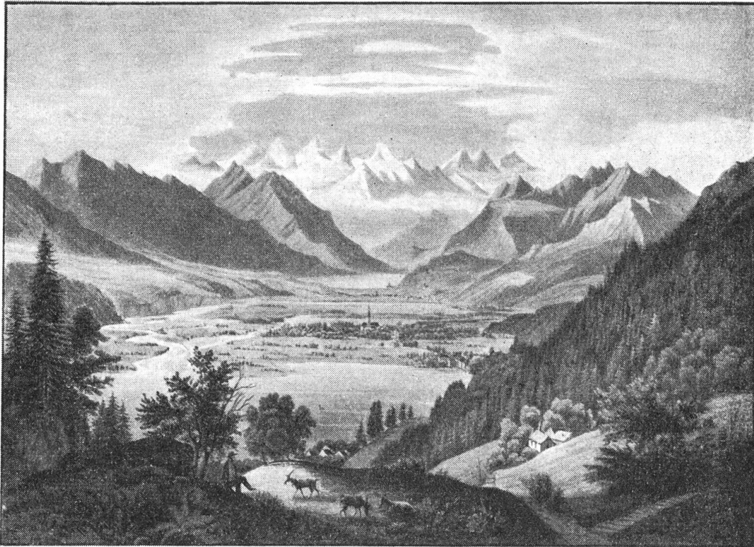
Blick auf Alpnach

Im langen Loh sind die Häuser einsam; wie wenn jedes auf einer eigenen Insel abgeschlossen wäre, liegt es hinter dem dichten