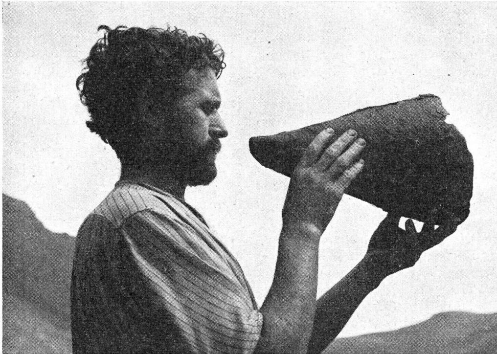
Der Betrüger auf Kernalp

Wieder schlugen die Gehässigkeit und die Aufregung hohe Wellen in Tunderbach. Im Amtsblatt wurde eine offizielle Erklärung veröffentlicht, daß dies Jahr in Tunderbach das Tanzen am Prozessionssonntag nicht erlaubt sei. Eine Woche später werde aber im bisherigen Rahmen ein Tunderbacher Tanzsonntag stattfinden. Männer und