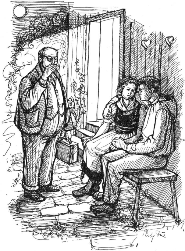
Sie sahen den dicken Doktor nicht, der laut hustend vor ihnen stand.

Weiß so weithin geleuchtet hatte, kam also in das behäbige Wirtshaus an der Marktgasse. — Das war eine Hochzeit, mit Pferden und Kutschen, mit Musik auf der Straße und im Gartenrestaurant, ein Rufen und Betteln der Kinder, die nahen Verwandten in steifen neuen Kleidern, der Bräutigam in einem eleganten Anzug vom Schneider in der Stadt. — Und die Braut mit einem Schleier, der zwei Ellen breit den Staub von den Bsetzistenen wischte. — Und erst ein Hochzeitessen, mit Braten und Fischen und Wildbrett, fünf Glä-