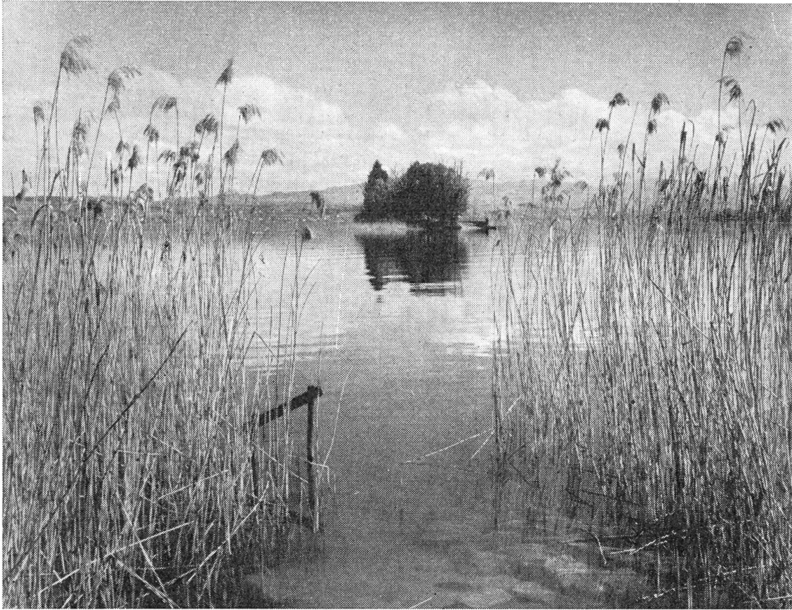
Insel bei Richterwil am Zürichsee