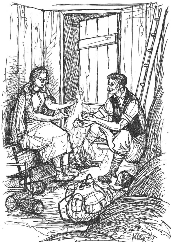
„Ich hab keinen Liebsten und will keinen Bratkäs mehr.“

auch noch gut dazu, ist mir aber momentan ausgegangen. — Schnaps ist wohl zu hitzig und zu scharf für Deine feine Kehle. Aber der Käse ist mild, wirst keinen Durst bekommen.“ Da sieht er erst den schweren Koffer in der dunkeln Ecke stehen, geht hin, hebt ihn prüfend auf und fragt: „Hast Du das schwere Ding bis da hinauf getragen, ganz allein?“ „Ja“. Das ist das zweite Wort, das er zu hören bekommt. Er bringt die zweite Portion Bratkäs. Das Mädchen beißt munter hinein. Die dritte ißt er selbst und sagt derweil: „Du hast Dich aber gemacht, bist groß und stark geworden in der