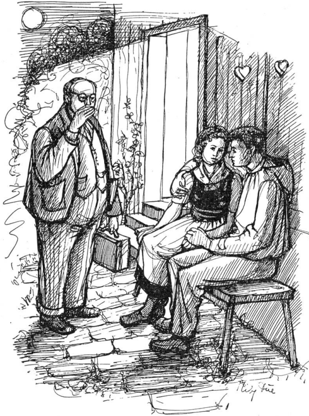
Sie sahen den dicken Doktor nicht, der laut hustend vor ihnen stand.

Weiß so weithin geleuchtet hatte, kam also in das behäbige Wirtshaus an der Marktgasse. — Das war eine Hochzeit, mit Pferden und Kutschen, mit Musik auf der Straße und im Gartenrestaurant, ein Rufen und Betteln der Kinder, die nahen Verwandten in steifen neuen Kleidern, der Bräutigam in einem eleganten Anzug vom Schneider in der Stadt. — Und die Braut mit einem Schleier, der zwei Ellen breit den Staub von den Bsetzistenen wischte. — Und erst ein Hochzeitessen, mit Braten und Fischen und Wildbrett, fünf Glä-