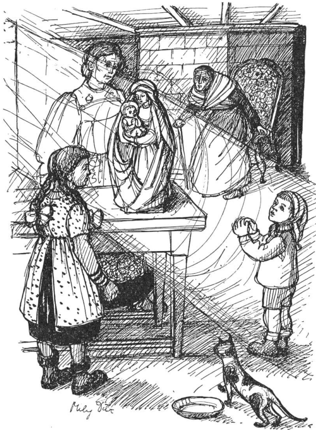
Die Großmutter erhebt sich von ihrem Lehnstuhl.

Schnee fällt wieder über den braunen Schutt und Dreck und deckt mit reinem Weiß den Ort der Verheerung zu. Lastwagen, Kipper, Krane und Traktoren rumoren und lärmen. Nach fünf Tagen reichen sich die Männer von beiden Seiten die Hand. — Bald leuchtet wieder das Licht auf, am Weg, in den Stuben und Ställen. Das Leben nimmt seinen Pulsschlag wieder auf. An einem der nächsten Sonntage gehen zwei junge Menschen zwischen den hohen, kalten Schneemauern der Lawine durch, die Straße hinauf gegen das lange Loch. Sie