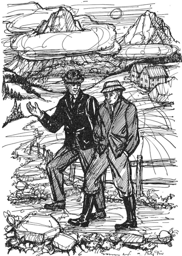
Bald fingen die ersten Flocken zu tanzen an.

und wie es jetzt der Mutter gehe und wurde dann plötzlich hinausgerufen. Kasi, im vollen Bewußtsein, dieser Tante einen mächtigen Eindruck gemacht zu haben, bestellte ein reichhaltiges Nachtessen, tätschelte der Kellnerin gönnerhaft die runden Arme, lehnte sich mit einer dicken Zigarre wohligh und großspurig zurück und schlug die Beine übereinander. Dem aufsteigenden Rauch nachschauend, sinnierte er über seine erfolgreiche Zukunft und über die ungeheure Bedeutung seiner Persönlichkeit. Der zweite halbe Liter half ihm diese Gedanken noch etwas höher hinauf zu schrauben.