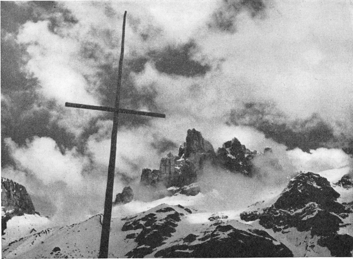
Bergkreuz mit dem großen Spannort