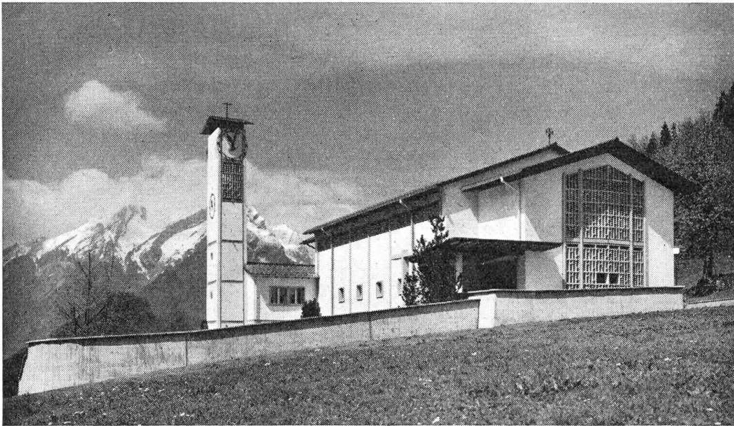
Die neue Kirche in Obbürgen wurde am 9. Mai 1954 eingeweiht

war die Stunde gekommen, da der Vater seinen Sohn wie mit Eisenklammern anfaßte. Kasi sah die dicken Adern am Hals und dachte: „Der Vater wird das nicht lange aushalten.“ Aber er rechnete sich damit. Gegen diese Kraft konnte der Junge noch nicht anstehen. Schließlich verbockte er sich ins Schweigen: „Ich habe alles gesagt, mehr kann ich nicht sagen“ und blieb stumm wie ein Toter. Langsam verebten die furchtbaren Vorwürfe. Lange Pausen folgten den Anschuldigungen. In einer solchen