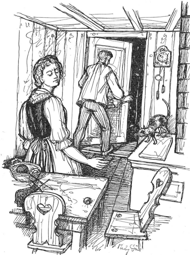
„Behüt Dich Gott und Dein Schutzengel“, sagte Christeli.

Wortlos ging die Mutter vom Tisch und in die Kammer. Schweigend hörten sie zu, wie die Mutter lange mit Schlüsseln und Schließern hantierte. Mit roten Backen und