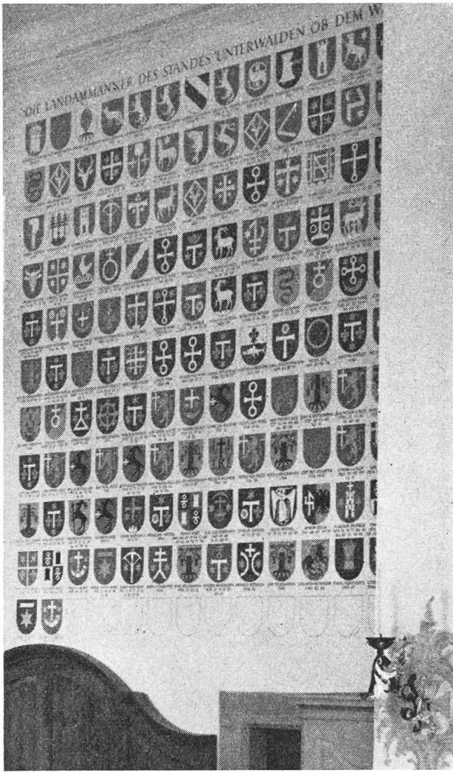
Die neuerstellte Wappenreihe der Obwaldner Landammänner

getreue Nachahmung des Heiligen Hauses zu geben. Das neue Patrozinium fand in der Statue der Gnadenmutter von Loreto auf dem Hochaltar seinen bildhaften Ausdruck. Zu ihr pilgerten nun die Obwaldner in allen Sorgen und Nöten. Viele Motivtafeln und -Gaben beweisen noch heute das innige Vertrauen und die gewährte Hilfe.