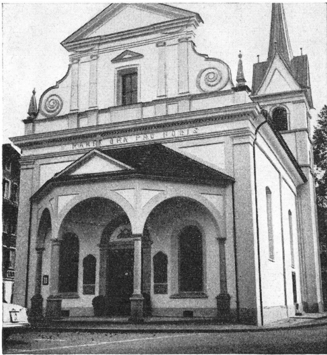
Die neurenovierte Dorfkirche Unserer Lieben Frau zu Sarnen

Wie sehr die Imfeld die Dorfkapelle als Familienverpflichtung betrachteten, zeigt die Stiftung einer Pfründe durch Landammann Melchior im Jahre 1605. Allerdings wurde diese zeitlich beschränkt durch eine Klausel, laut welcher das ganze Stiftungskapital beim Bau eines Kapuzinerklosters auf dieses übertragen werden sollte. Die Ansiedlung der Kapuziner war für Melchior Imfeld ein Haupt-