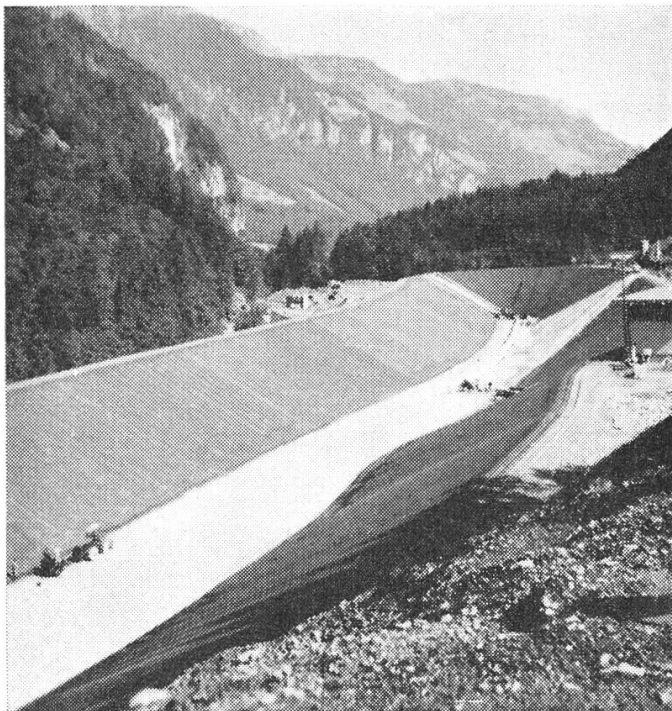
Das Staubecken in Obermatt beim Abschluß der bitumengetränkten Drainageschicht und des Beckenbetages auf den Böschungen und der Sohle

Das 25 m lange Stahlrohr-Aquadukt überbrückt die Engelbergeraas und leitet das Wasser vom Ausgleichsbecken in den 8,2 km lan-