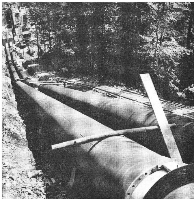
Die Druckleitung zum Kraftwerk Dallenwil 1,45 m Lichtweite, 242 m Länge