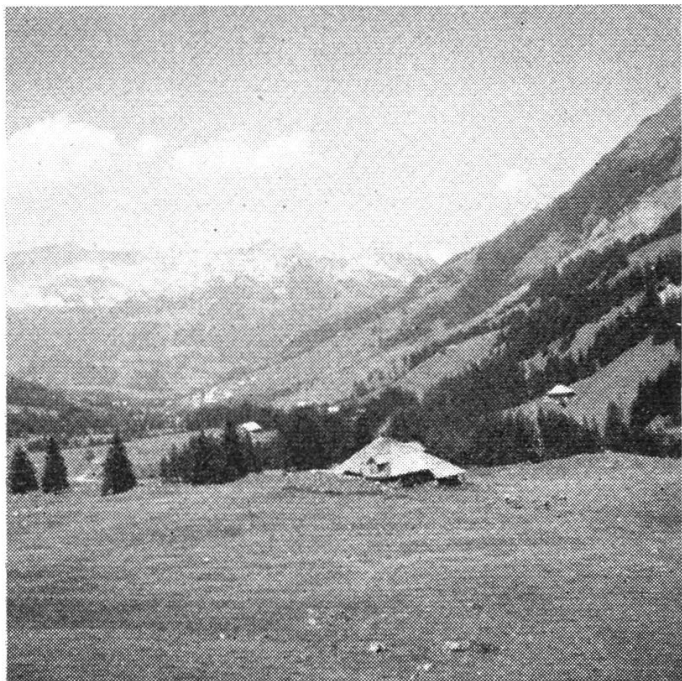
Im Sawinengebiet sind die einsamen Hütten durch Steinwälle geschützt.