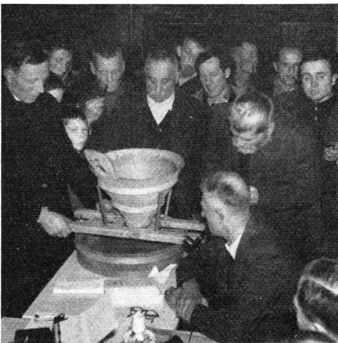
Ob Lungern wird um den Alpteil gewürfelt.

Wir kennen noch aus eigenem Erleben die niederen und lichtlosen Hütten und Ställe, wo man kaum aufrecht stehen konnte und der Wohnteil einen einzigen, rauchigen Raum bildete. Um die Jahrhundertwende ging man dazu über, eine Wohn-Schlafstube abzutrennen. Heute trennt man auch die Schlafräume von den übrigen Wohnteilen und erstellt über Stube und „Wellhuis“ die „Loibe“. Mehr und mehr führt man auch das fließende Wasser in die Hütte, versieht den Feuerraum mit einem sauberen Zementboden und läßt durch mehrere Fenster der Luft und dem Tageslicht ungehinderten Zutritt. Höhere Stallungen mit guter Lüftung, einem soliden Einbau und mehreren Zu-