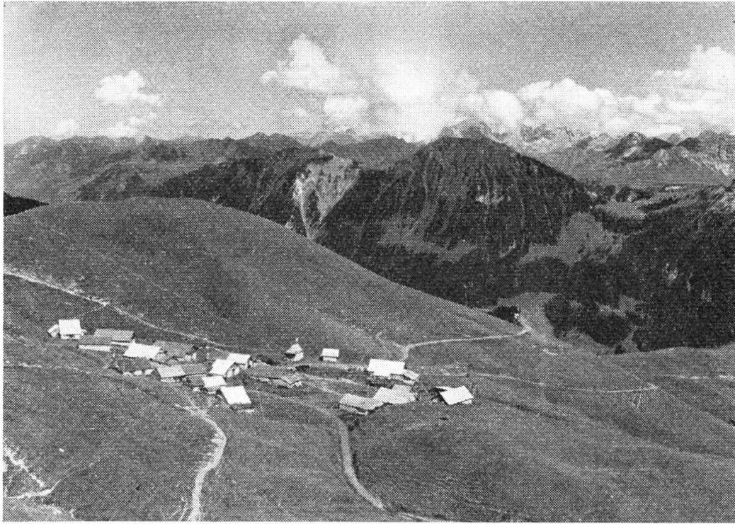
Im Flyschgebiet, zwischen Pilatus und Giswilerstock stehen die Alphütten meist dörflich nahe beisammen.