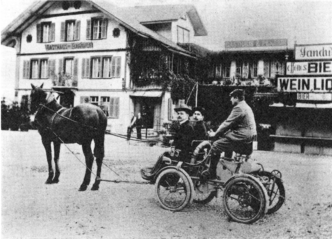
Kontrollstelle für die Automobilisten beim Bahnhof in Giswil. Dem Motorwagen ist bereits ein Pferd vorgespannt, um dem Gesetz zu genügen.

nerischen Brünigroute“ in die Hand gedrückt. Langsam sei er nun den Paß hinaufgefahren. In Lungern habe ihn ein Polizist angehalten und ihm gesagt, er sei zu schnell gefahren. Er dürfe nicht weiter fahren, müsse den Polizeidirektor von Sarnen erwarten, der in zwei Stunden ankomme, um ihm eine Strafe wegen Überschreiten der erlaubten Maximal-Fahrtgeschwindigkeit aufzubrummen. Und weil der Brünig für Automobile nur bis 4 Uhr nachmittags offen sei, müsse er zur Fortsetzung der Reise Pferde vorspannen.