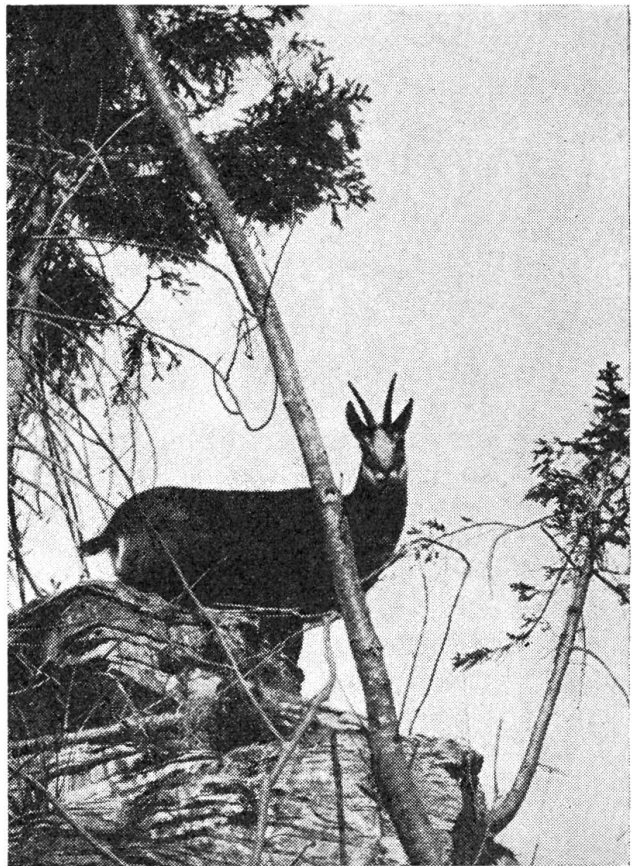
Junger, starker Gemsbock in einem unserer Bannberge. Ein herrlicher Anblick für jeden Naturfreund und weidgerechten Jäger, der die Notwendigkeit und den Nutzen der Schutzgebiete heute mehr den je anerkennen muß.

Erst am folgenden Dienstag, den 19. August, wie ich abends nach Hause kam, rief mich meine Frau nach dem Hausgange hinter, um daselbst zu vernehmen, wie sonderbar es an der Wand klopfe. Etwas unwillig zwar, aber alsbald nachsehend, hörte ich vom Küchenstüblein her an dessen Rückwand ein mehrmaliges Anklopfen von je 10 bis 12 Schlägen eigentümlicher Art, die sich gegen das Ende sehr rasch folgten, ähnlich, wie wenn Jemand, mit dem Finger ängstlich an eine Thür klopfend, raschen Einlaß begehren würde. Nach kurzen Pausen wiederholte sich dieses mehrmals. Ich suchte und fand, indem ich das Ohr auf die Wand legte, immer genau die Stelle, die übrigens mehrmals änderte. In der Meinung, es müsse das doch irgend etwas Lebendiges, etwa eine Ratte usw. sein, klopfte ich an die Wand, um es zu verscheuchen. Statt zu fliehen, gab es mir mehr denn einmal mit demselben Klopfen Antwort, wobei mitunter 1 bis 2 stärkere Schläge wie mit einer Faust folgten. Ich ließ mir eine Kerze geben, ging in das Stüblein und