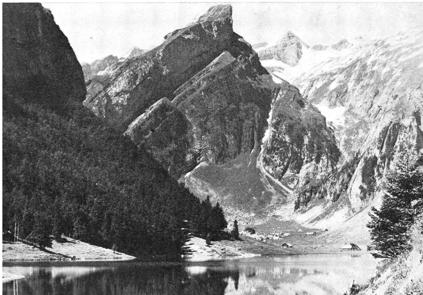
Der Seelalpsee mit der markanten Roßmad und dem Säntispifel

Die Frage, wann diese organisierten Genossenschaften entstanden sind, ist noch ungeklärt. Es ist aber wahrscheinlich, daß sie älter als ihre ersten urkundlichen Spuren sind. Auf jeden Fall wissen wir, daß