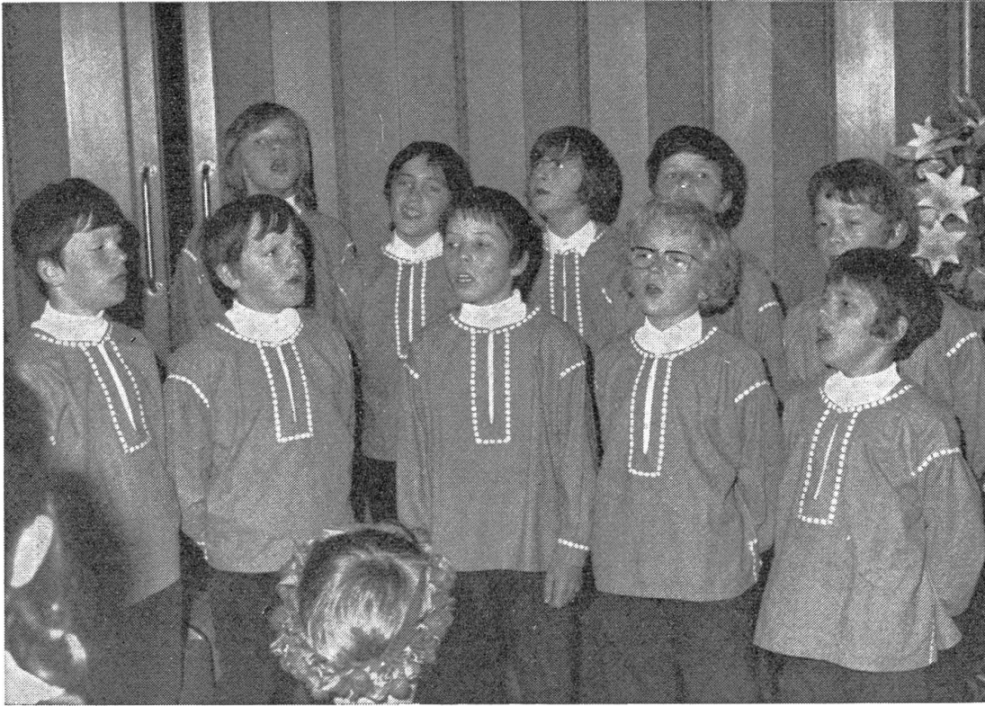
So sangen die Buben zur Freude eines Hochzeitspaares und seiner Gäste.

zugewiesen wurde. In einem großen Park stand uns auch ein herrliches Schwimmbassin zur Verfügung. Dort haben bald alle Buben schwimmen gelernt. Die ersten Tage wurde in Fernseh- und Schallplattenstudios gearbeitet. Dazu kamen verschiedene Direktsendungen am Radio. Jede Woche gab es einen Tag ohne Konzert. Diesen Freitag genossen wir besonders, versuchten den nötigen Schlaf nachzuholen oder das Land näher kennen zu lernen