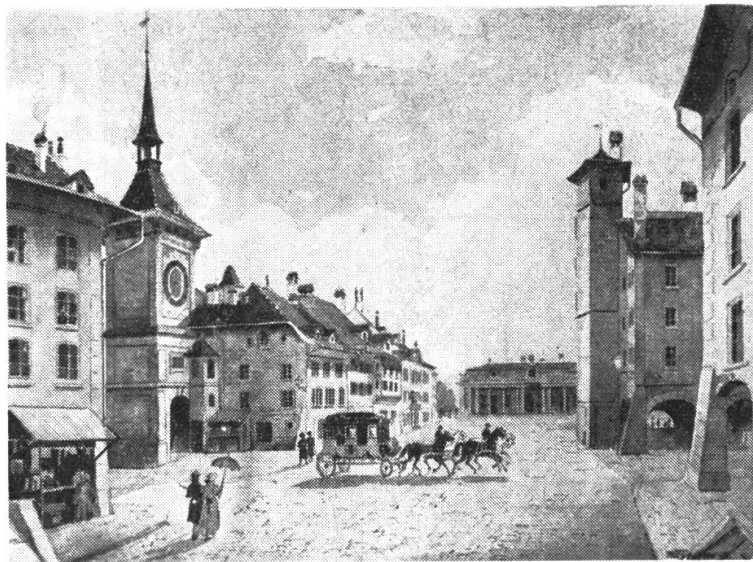
Diligence der Fischer'schen Post beim Zytglogge in Bern 1820 Original im PTT Museum in Bern

Zürich konnte aus verschiedenen Gründen auf eine so weit gehende Forderung nicht eintreten und kündigte am 31. Mai 1848 den Postpachtvertrag auf den 15. Mai 1849, nachdem Nidwalden bereits schon