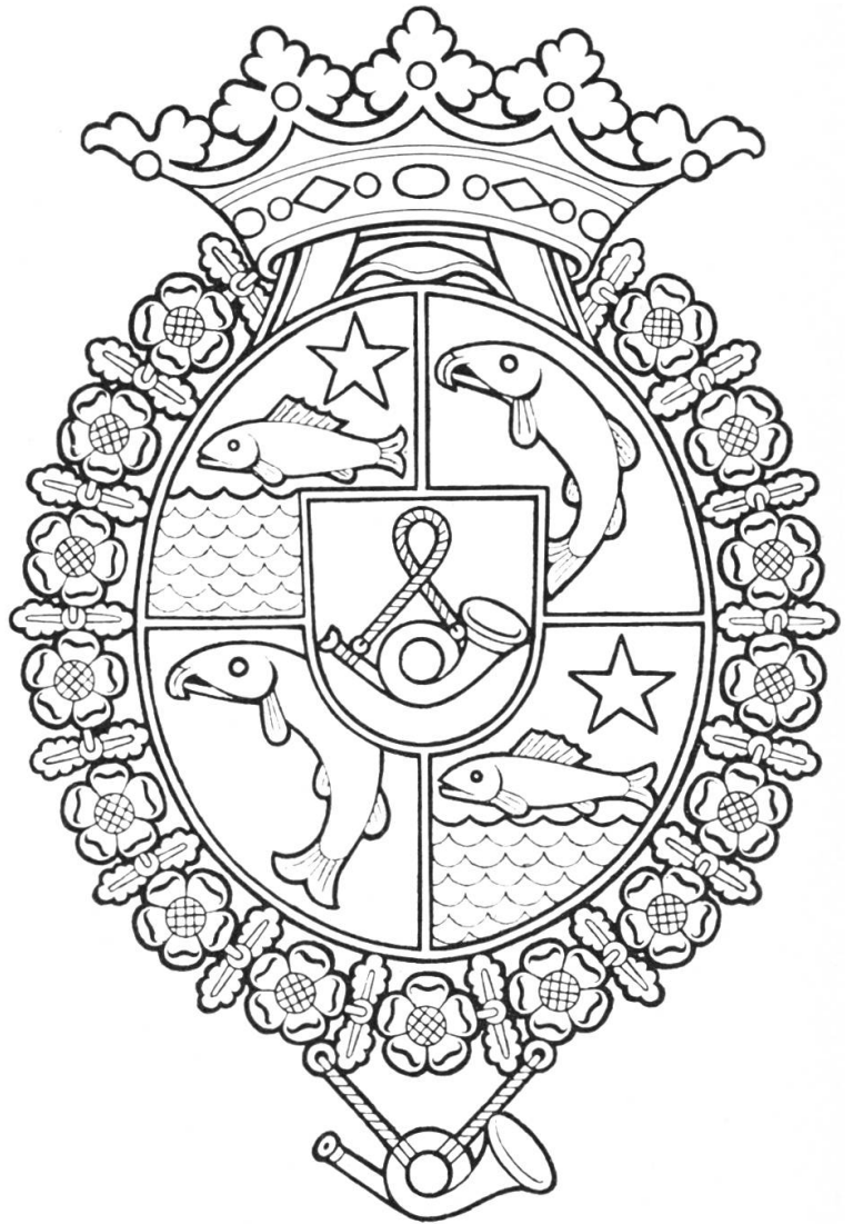
Wappen der Familie Fischer von Reichenbach Original im PTT Museum in Bern

Nach 1798, zur Zeit der Helvetik, war die Post zentralisiert. Die damaligen Beschlüsse der helvetischen Behörden sind für ihre Zeit bezeichnend. Ein Beschluß vom 26. April 1799 lautete: «Alle Boten, die bis anhin von den Klöstern zum Dienste ihres Briefwechsels gebraucht worden sind, werden hiemit abgeschafft, und die Klöster sollen ihre Briefe der Post und dem gewöhnlichen Boten übergeben.» Die Briefe wurden seinerzeit von einem Kloster an das andere oder von einem Kloster an irgendeine Privatperson geschickt. Die Klöster hielten also eigene Briefträger. Nach einem Beschluß vom 17. Juni 1799 mußten die Kuriere zu Pferde und die Postwagen mit Säbeln und Pistolen, die Kuriere zu Fuß aber mit einer Lanze und einer Pistole bewaffnet sein, um sich vor Überfällen schützen zu können. Die helvetischen Behörden waren mit gutem Grund ihrer Sache nicht ganz sicher und erließen daher besondere Schutzbestimmungen. Für unseren Bezirk hatte man (am 25. August 1799) folgende Regelung vorgesehen: «Am Dienstag geht wie bisher ein Bote von Sarnen nach Luzern und wieder zurück. Er bezieht bis zur endgültigen Festsetzung des Postwesens den bisherigen Jahreslohn und von jedem gewöhnlichen Brief hin oder her einen Schilling. Handelt es sich aber um obrigkeitliche Depeschen, kann er für jede einen halben Batzen dem Staate Rechnung