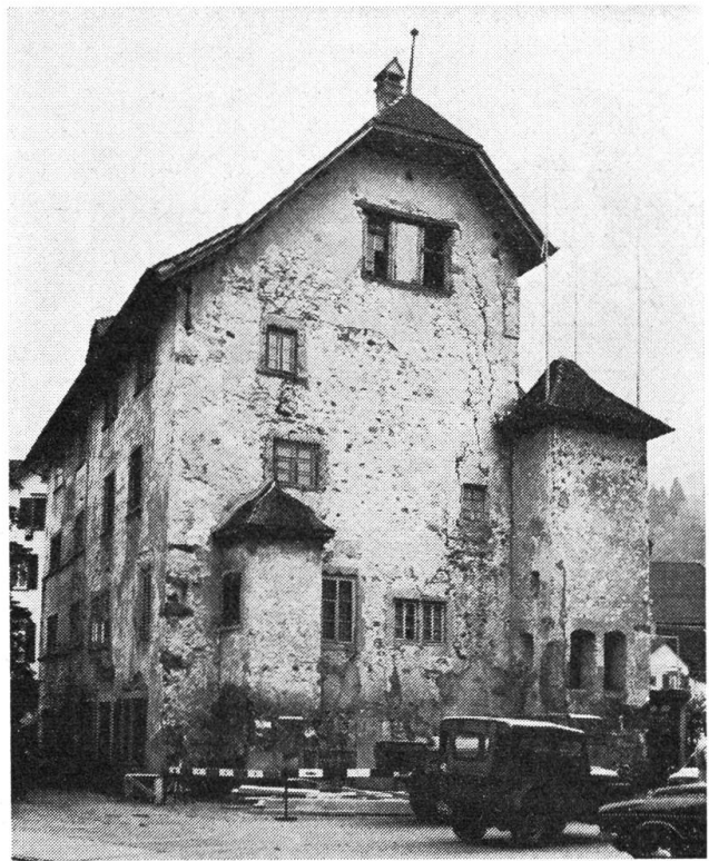
Altersschwach und verfallen sah das Höfli aus, als es vom Efeu befreit war.

Nach dem Kauf der Liegenschaft (mit Haus, Gaden und über 5000 m 2 Umschwung), musste die Höfli-Stiftung vorerst den im Verlauf der Jahrhunderte in vielen Stilarten gewachsenen Baukomplex archäologisch untersuchen lassen. Anschliessend musste in pietätvoller Planung das Gesicht gesucht werden, welches das Haus vor bald dreihundert Jahren zur Zeit von Landammann Keyser dessen vornehmen Besuchern präsentierte. Dann kam das langwierige Subventionierungsverfahren. Gleichzeitig wurden innerhalb und ausserhalb des Kantons die Geldmittel gesammelt, welche die Bezahlung des Kaufpreises und die Inangriffnahme der Bauarbeiten ermöglichten. Vor gut anderthalb Jahren konnte endlich mit der Aussenrestauration des Höfli-Hauses begonnen