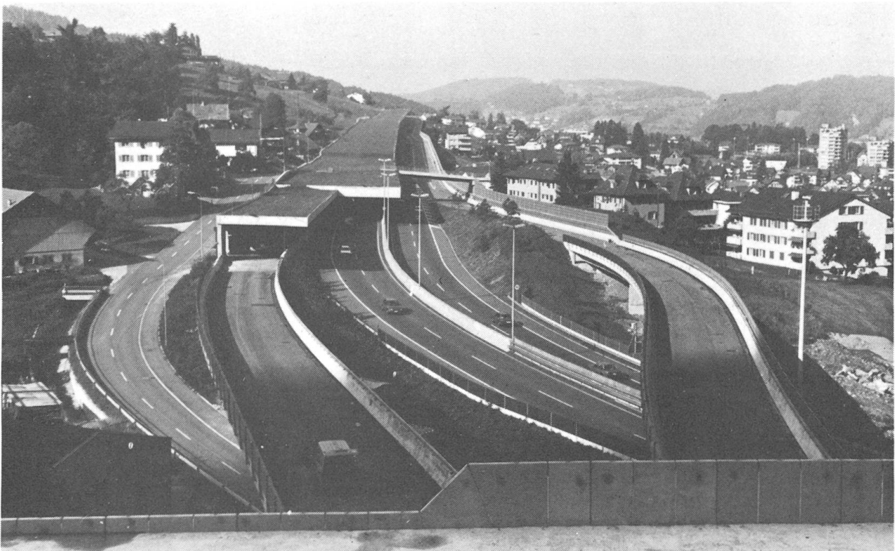
Das Anschlusswerk in Hergiswil. Von rechts nach links: Fahrbahn vom Loppertunnel auf die N2 Richtung Luzern, die beiden Fahrbahnen der N2, der Anschluss von der N2 zum Loppertunnel und eine Lokalstrasse von Hergiswil.