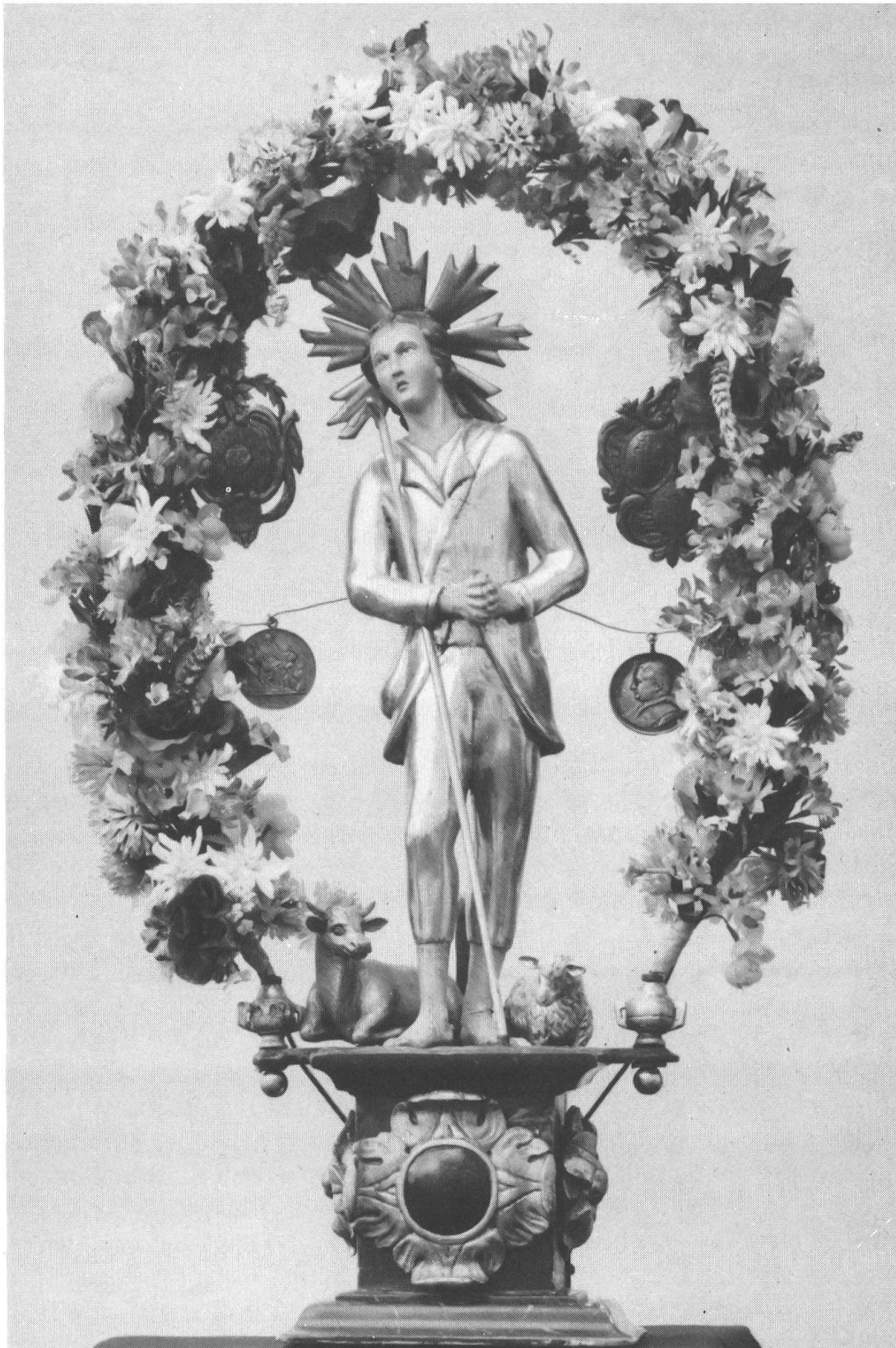
Der heilige Wendelin der Älperbruderschaft von Stans. Der Heilige wird am 20. Oktober gefeiert. Die Legende macht ihn zum iroschottischen Königssohn, der seine Heimat verließ, sich als Einsiedler und Hirt betätigte und Abt des Benediktinerklosters zu Tholey wurde.