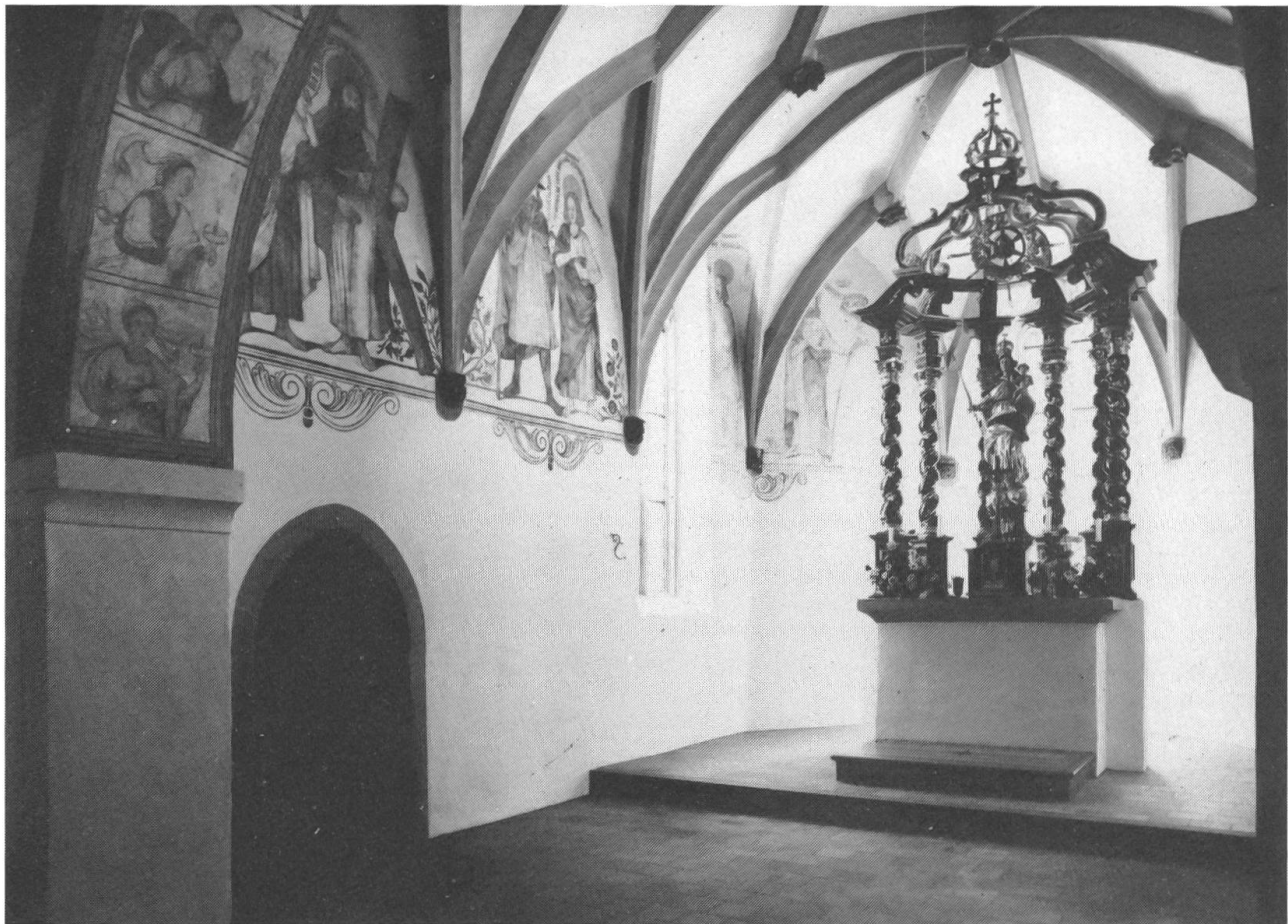
Blick in den spätgotischen Chor mit seinem Netzgewölbe, reichen Wandfresken und dem barocken Baldachinaltar.

Am 22. Juni 1504 vollzog der Konstanzer Weihbischof die Weihe der Kapelle zu Ehren der Mutter Gottes, der heiligen Magdalena, des heiligen Kreuzes und der 10000 Ritter. Die gleichen Titel trug ja schon die obere Kapelle und damit wird deutlich, dass eine Tradition fortgesetzt werden sollte. Im Verlaufe des 16. Jahrhunderts wurde die Kapelle mit Wandgemälden in Chor und Schiff bereichert. Joachim Eichhorn, der Biograph von Bruder Klaus, bezeichnete das Gotteshaus 1607 als das schönste religiöse Bauwerk von Unterwalden. In der lichtungsrigen Barockzeit hat man im Schiff ohne Rücksicht auf die Wandmalereien zusätzliche Fenster ausgebrochen. Der ele-