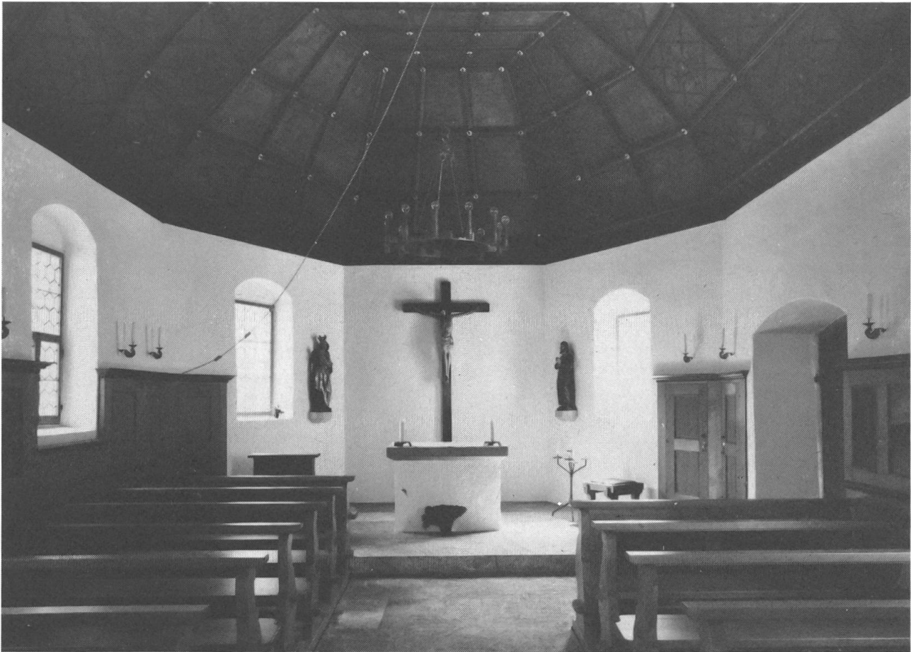
Inneres der oberen Ranftkapelle mit bemalter Holzdecke und wertvollem Kruzifix aus dem 14. Jahrhundert.

Dankesbezeugungen eine Auswahl treffen, damit das kleine Gotteshaus nicht unter einer Tapete von Täfelchen aller Art erstickt. Die Auswahl spiegelt die jahrhundertealte Verehrung des Heiligen und führt uns vor Augen, mit welcher vielfältigen Anliegen und Sorgen sich die Menschen an Bruder Klaus gewandt haben.