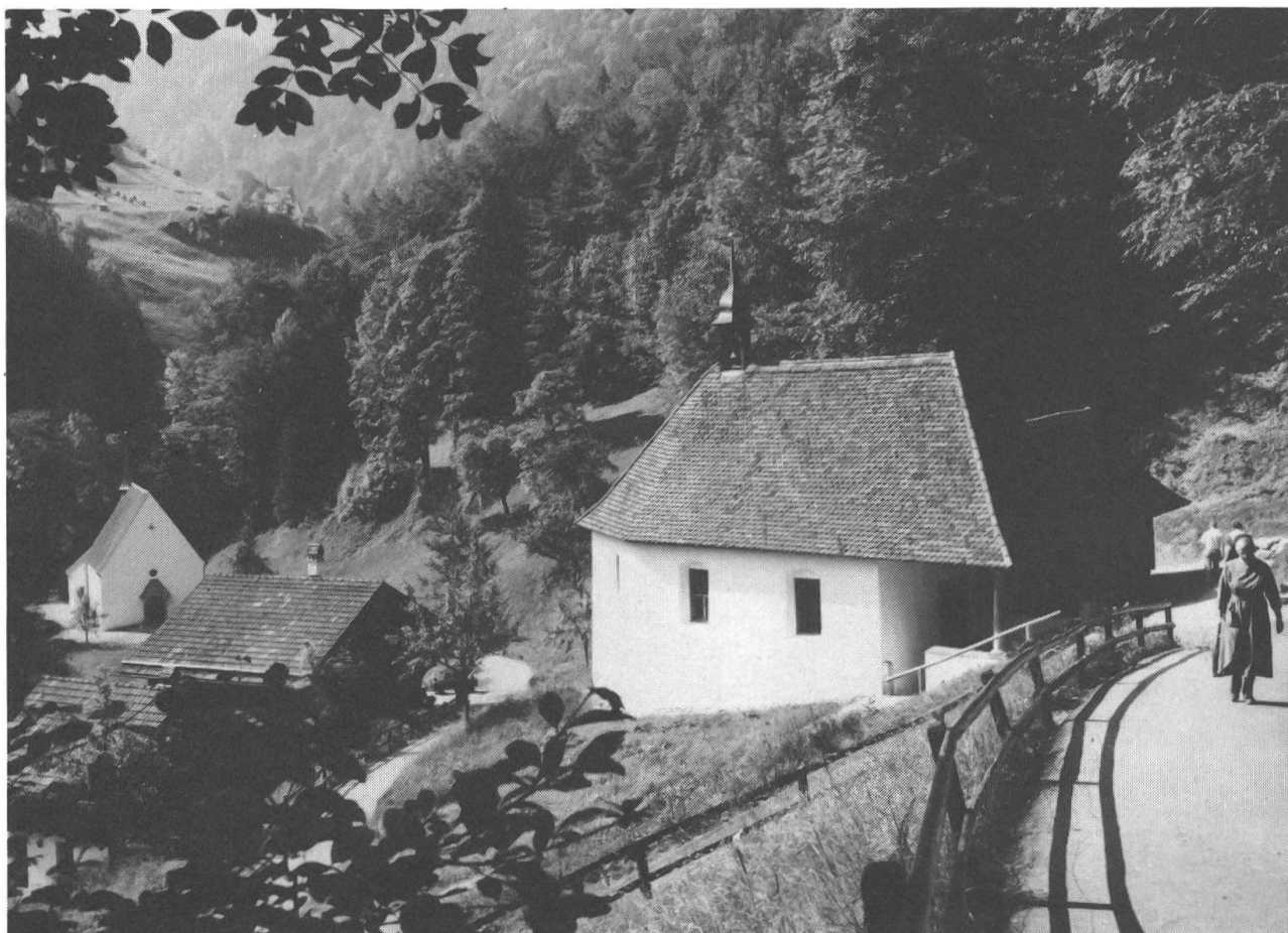
Der Ranft und seine Bauten: rechts die obere, links die untere Ranftkapelle, dazwischen erkennbar das Dach des Sigristenhauses.

starke Kruzifix an der Stirnwand des Chors. Dieser Kruzifix dürfte in der 2. Hälfte des 14. Jahrhunderts entstanden sein. Er hat durch den Restaurator seine ursprüngliche Fassung zurückerhalten. Die Madonna an der linken Chorschräge stammt aus dem frühen 16. Jahrhundert, ihr Gegenstück rechts ist eine Figur des heiligen Bruder Klaus aus dem 17. Jahrhundert und zwar die verkleinerte Kopie einer älteren Figur aus dem Geburtshaus.