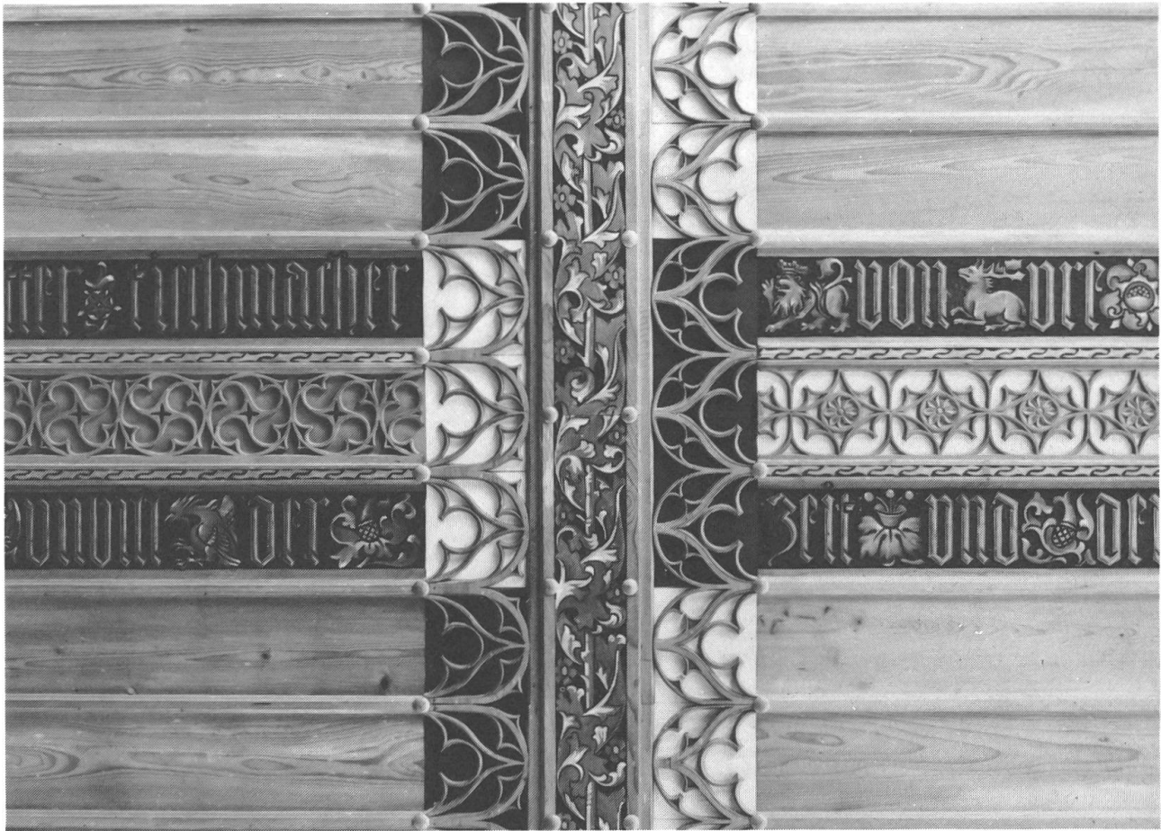
Ausschnitt aus der reich geschnitzten, farbig gefassten Holzleistendecke, 1920 rekonstruiert.

jetzt in Schreinen auf den Seitenaltären einen neuen Standort gefunden haben: Auf dem rechten Seitenaltar eine Petrusstatue, die als letztes Bildwerk vom ursprünglichen Hochaltar in der Kapelle erhalten geblieben ist, und auf dem linken Seitenaltar eine Statue von Bruder Klaus, nämlich eine Kopie der Figur von 1504, die sich im Stanser Rathaus befindet.