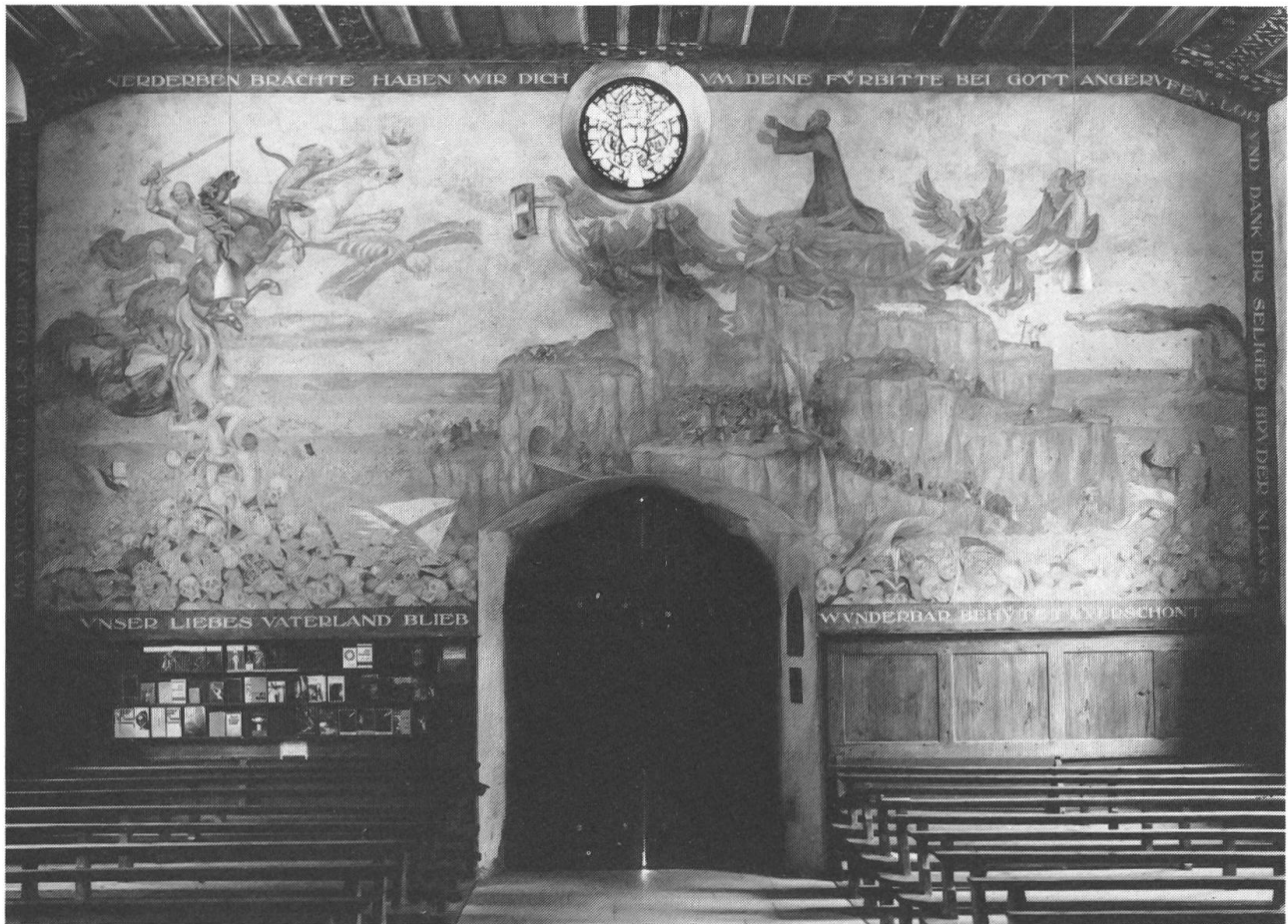
Das grosse Votivgemälde von 1921 vor der Restaurierung: Bruder Klaus bittet um Frieden, während rund um die Schweiz der 1. Weltkrieg tobt. Nach einem Entwurf von Robert Durrer, gemalt von Albert Hinter.

einige durch die barocken Fensterausbrüche vernichtet.