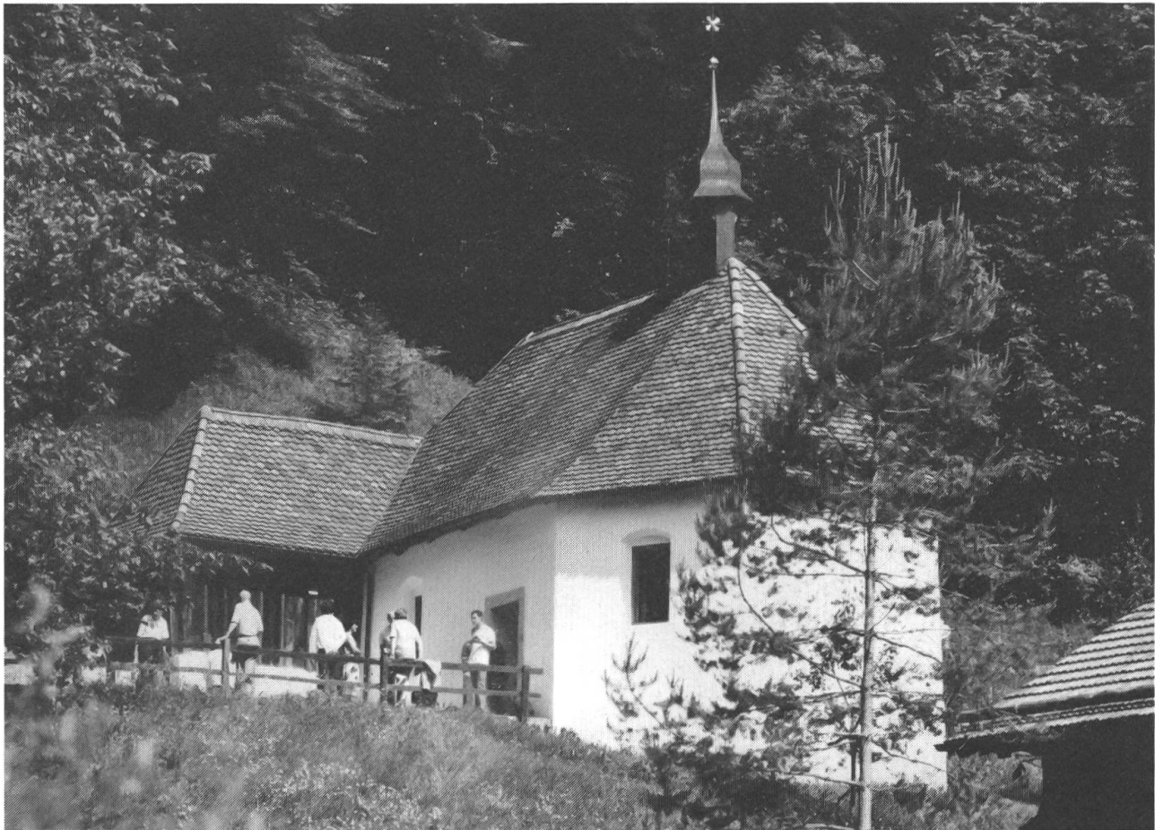
Blick auf die obere Ranftkapelle und die angebaute Eremitenwohnung von Bruder Klaus.

auffallen: Die Kapelle steht wieder rundum im Wiesland. Wir haben versucht, den Zugangsweg so zu führen, dass er die Harmonie von Landschaft und Architektur nicht stört.