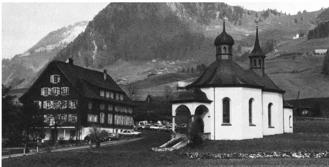
Die Kapelle von Grafenort konnte in diesem Jahr ihren 300. Geburtstag feiern.

Dass Grafenort früher Kaltenbrunnen hiess, ist gar nicht so abwägig. Der mitten durch die Talmulde fliessende Kaltibach verlieh der Gegend den Namen Kaltenbrunnen. Erstmals taucht dann der Name Grafenort im Talprotokoll vom 11. April 1642 auf. Neues verbreitete sich damals nicht so schnell wie heute. So ist es nicht verwunderlich, dass der Name Kaltenbrunnen auch später immer wieder auf-