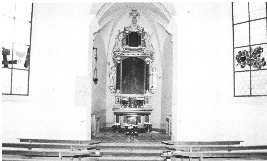
Gerade die schlichte Innenausstattung der Kapelle Grafenort ist es, was das Kleinod von Grafenort so liebenswert macht. (Bilder Beat Christen)

tauchte. Aber mit der Zeit bürgte sich der neue Name Grafenort immer mehr ein und Kaltenbrunnen verschwand vollends.