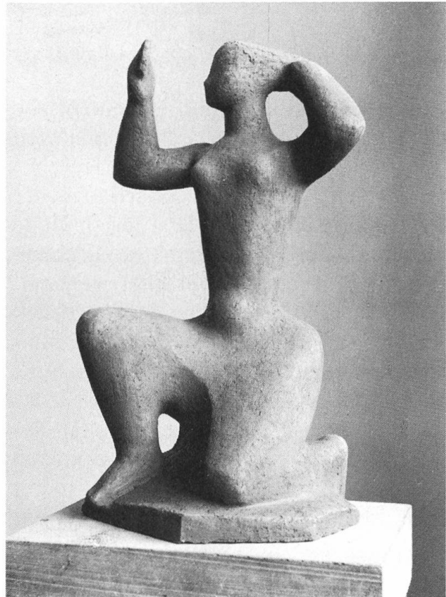
Eva. Terracotta. 1963. Ein Beispiel aus dem Alterswerk des Künstlers, gekennzeichnet durch eine neue Art von Stilisierung, die sich im Weglassen realistischer Details und in Durchbrüchen äussert, während die gestalteten Volumina frei und fliessen bleiben.

Hans von Matt war aber nicht nur ein Meister des geschriebenen, sondern auch des gesprochenen Wortes. Wer ihn einmal erzählen gehört hat, einen Abend lang im kleinen Freundeskreis, der wie gebannt an seinen Lippen hing, der kam aus dem Staunen kaum heraus. Wen hat er nicht alles gekannt! Da wurden Figuren heraufgeholt aus der Erinnerung – Künstler, Schauspieler, Originale – zu farbigem Leben erweckt und mit unvergleichlicher Mimik durch ihre skurrilen Geschichten