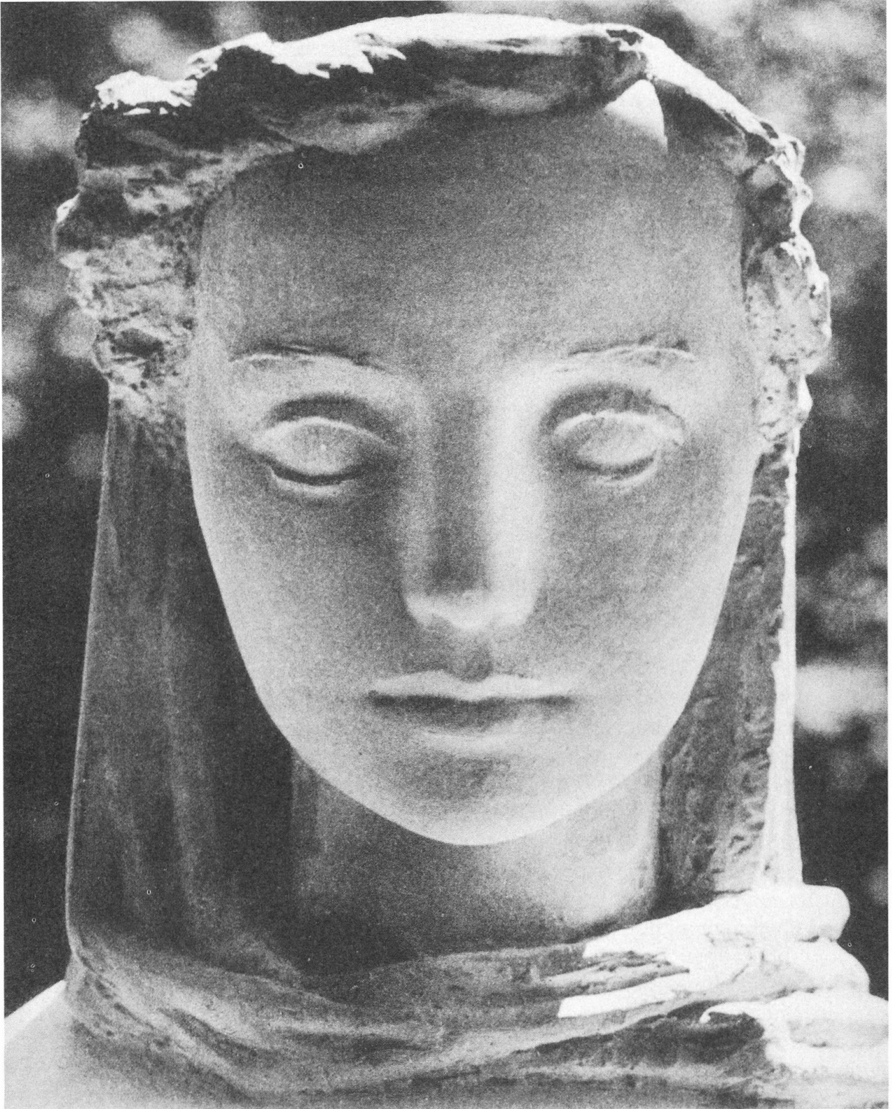
Die Muttergottes von Finsterwald. Gipsmodell des Kopfes. 1941. Eine hervorragende Arbeit aus der «klassischen Zeit» des Künstlers. Der Kopf wirkt gegenwärtig und jenseitig zugleich, Realismus, Stilisierung und Ausgewogenheit scheinen sich die Waage zu halten.