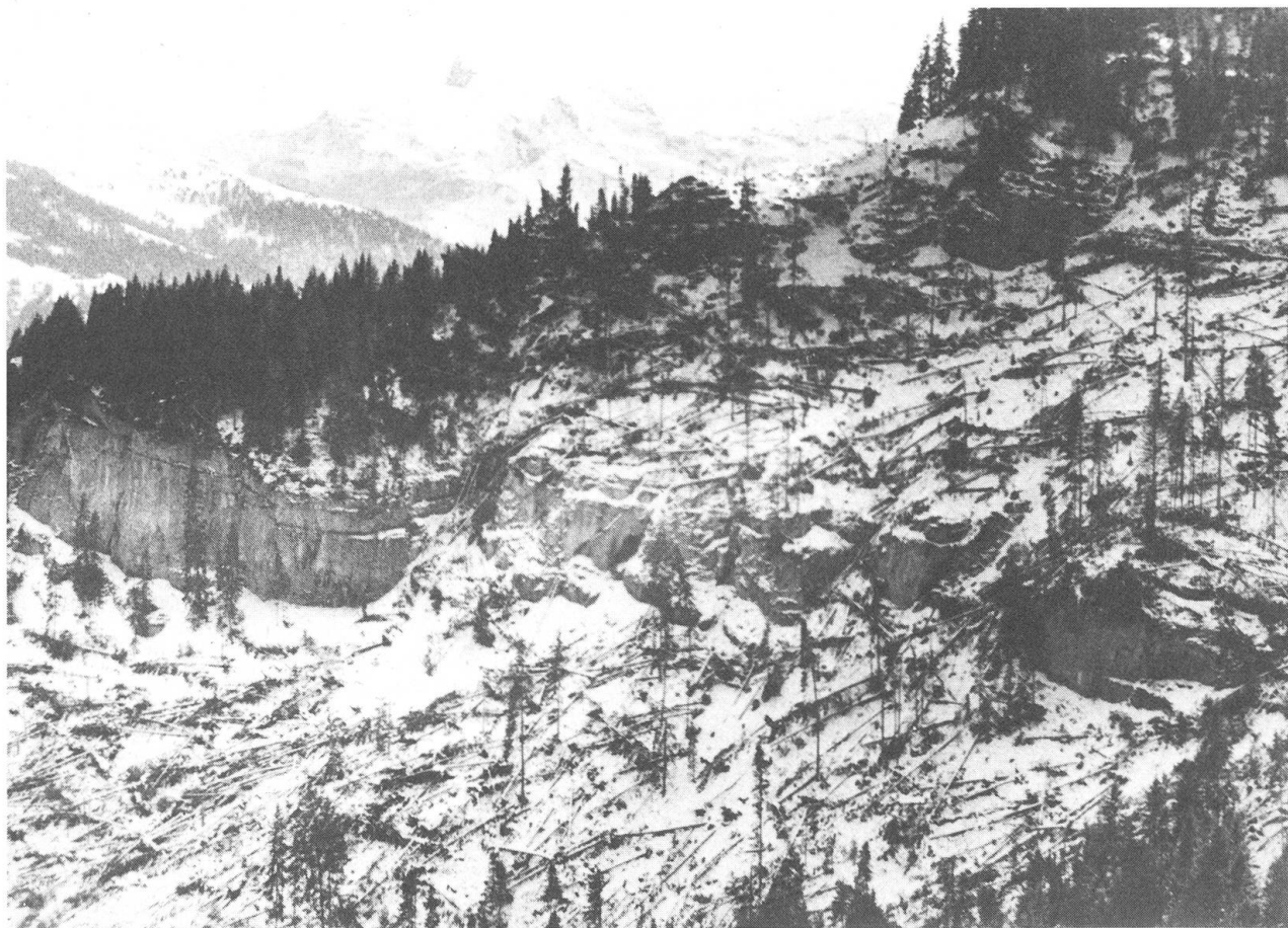
Weit abseits des Tales riss der Sturm grosse Löcher in den Stäfeliwald oberhalb Wolfenschiessen.

die Bäume, welche in den vergangenen Jahren so manchem Sturm getrotzt hatten. Am Morgen des 28. Februar bot sich in allen Gemeinden beim Anblick der Wälder ein trostloses Bild. Wie gelähmt standen die Waldbesitzer, aber auch Forstleute vor dieser Katastrophe. Die ersten Schätzungen des Schadensausmasses wurden im Verlaufe der Zeit bei weitem übertroffen. Rund eine Woche nach den orkanartigen Stürmen präsentierte das Oberforstamt Nidwalden erstmals detaillierte Zahlen über die Waldschäden im Kanton Nidwalden, welche die Stürme