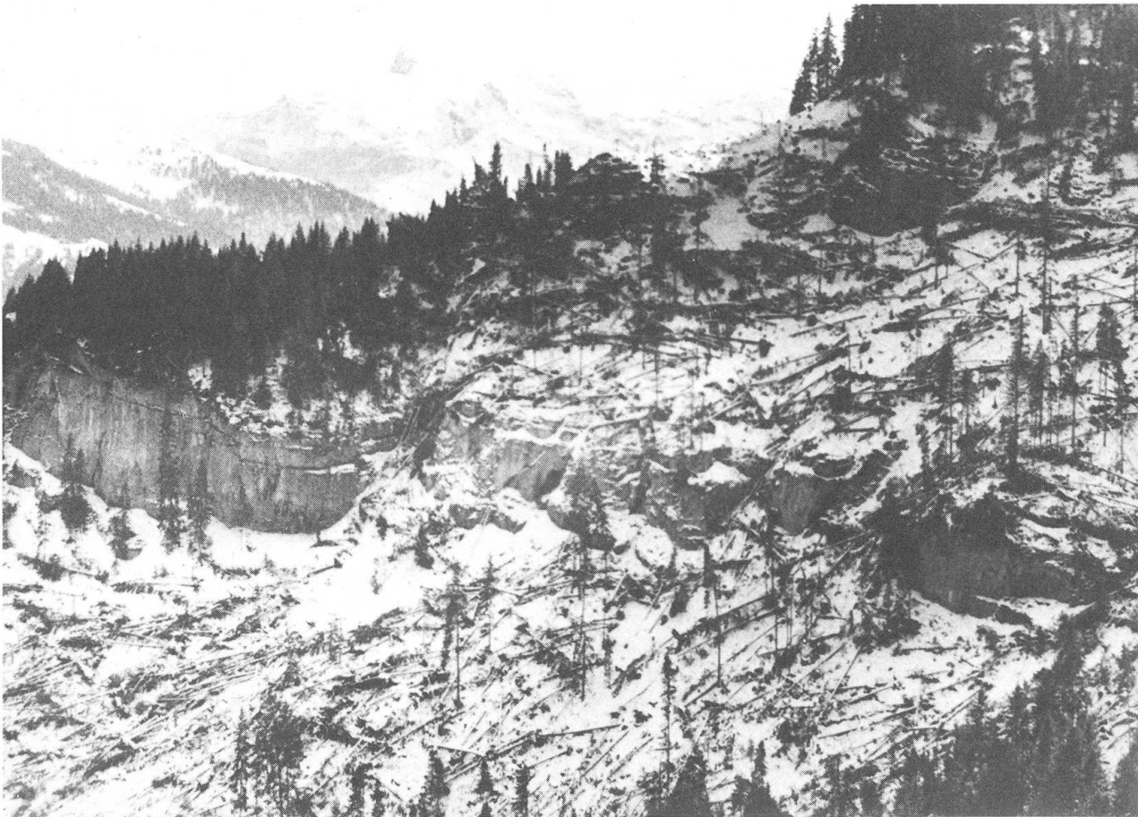
Weit abseits des Tales riss der Sturm grosse Löcher in den Stäfeliwald oberhalb Wolfenschiessen.

die Bäume, welche in den vergangenen Jahren so manchem Sturm getrotzt hatten. Am Morgen des 28. Februar bot sich in allen Gemeinden beim Anblick der Wälder ein trostloses Bild. Wie gelähmt standen die Waldbesitzer, aber auch Forstleute vor dieser Katastrophe. Die ersten Schätzungen des Schadensausmasses wurden im Verlaufe der Zeit bei weitem übertroffen. Rund eine Woche nach den orkanartigen Stürmen präsentierte das Oberforstamt Nidwalden erstmals detaillierte Zahlen über die Waldschäden im Kanton Nidwalden, welche die Stürme