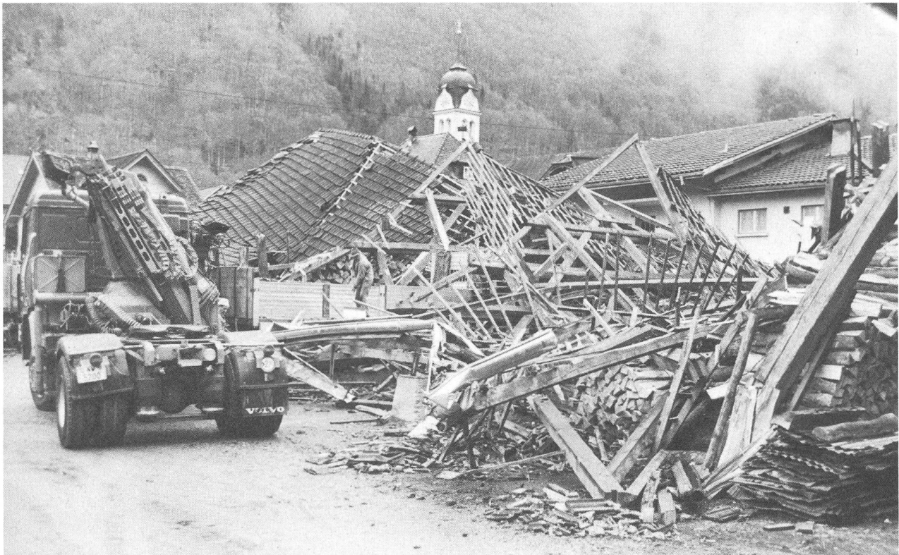
Kurzen Prozess machte der Sturm mit der Lagerhütte der Holzwollefabrik in Wolfenschiessen und zerlegte sie in Einzelteile.

Da beim Nadelholz die Gefahr des Befalls durch den Borkenkäfer am grössten ist, erliess das Oberforstamt Nidwalden die Weisung, dass vom geworfenen Holz zuerst das Nadelholz aufgerüstet werden soll. Beim sogenannten Laubholz wird mit dem Aufrüsten zugewartet, bis wieder Arbeitskräfte frei werden. Das bedeutete vor allem für die Korporationen Stans und Wolfenschiessen-Boden, dass die vom Wind gefällten Laubhölzer am Bür-