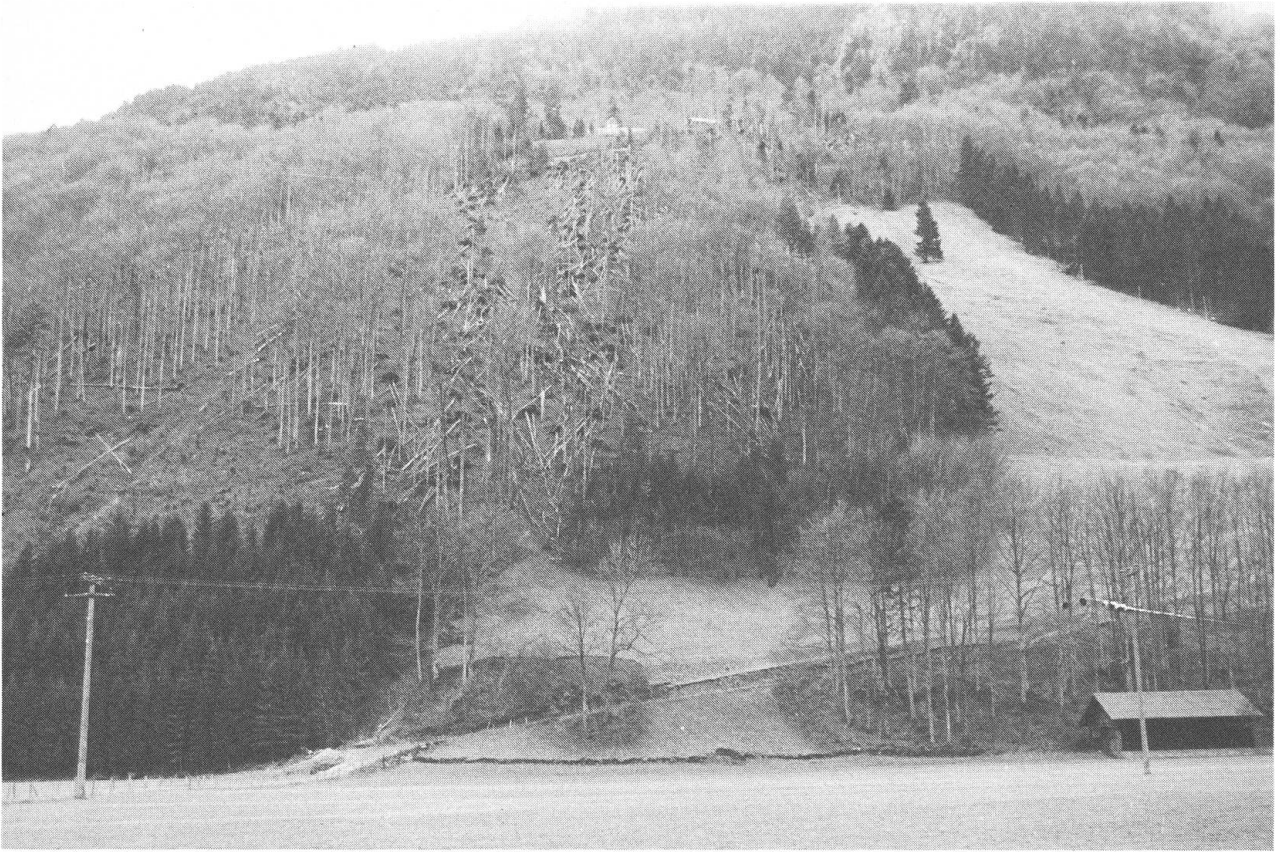
Bilder, zwischen denen bloss 24 Stunden liegen, aufgenommen am Dienstag, 27., und Mittwoch, 28. Februar 1990.