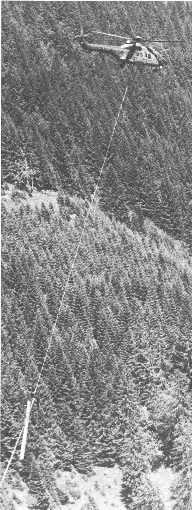
Eine grosse Hilfe zum Herausholen von Windholz im steilen, schwerzugänglichen und unwegsamen Gelände ist der Helikopter.