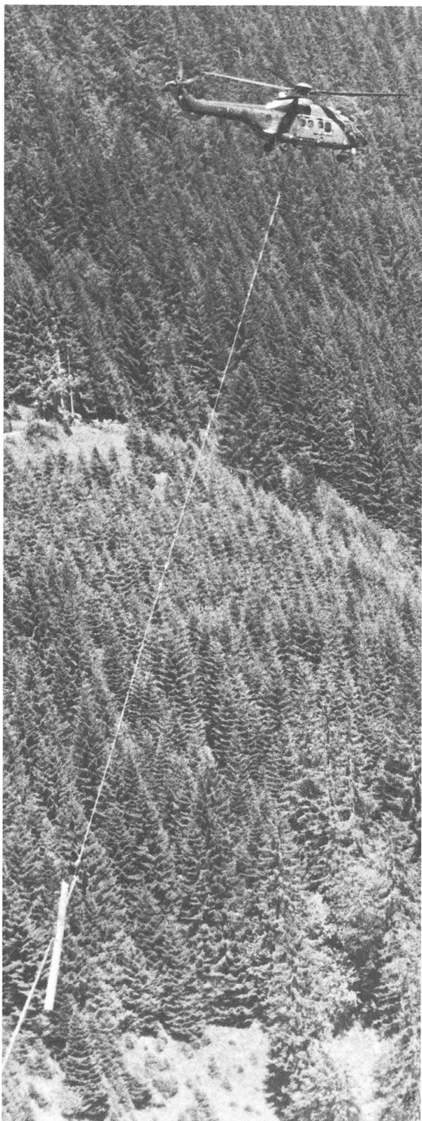
Eine grosse Hilfe zum Herausholen von Windholz im steilen, schwerzugänglichen und unwegsamen Gelände ist der Helikopter.