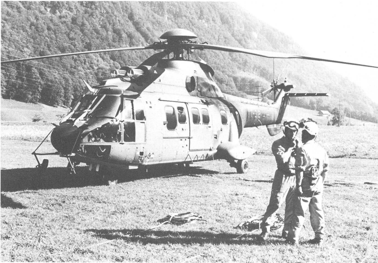
Für die Behebung der Sturmschäden stellte die Schweizer Armee einen Super Puma zur Verfügung, welcher auch im Kanton Nidwalden im Einsatz stand.

genberg und im Bereiche der Bettelrüti/Wellenberg erst ab dem Winter 1990/91 aufgerüstet werden können.