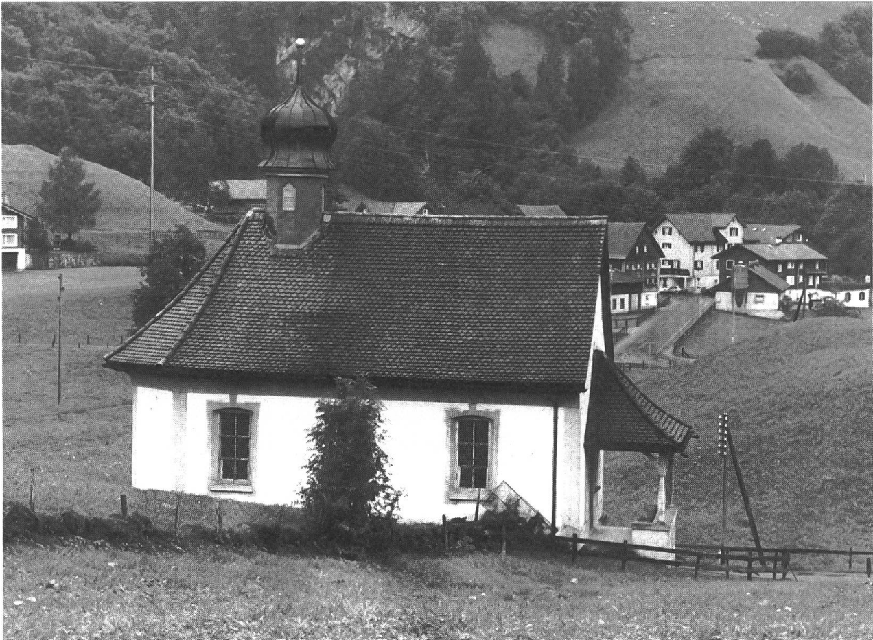
Die Heiligkreuz-Kapelle in Emmetten wurde im Jubiläumsjahr der Eidgenossenschaft 200 Jahre alt.