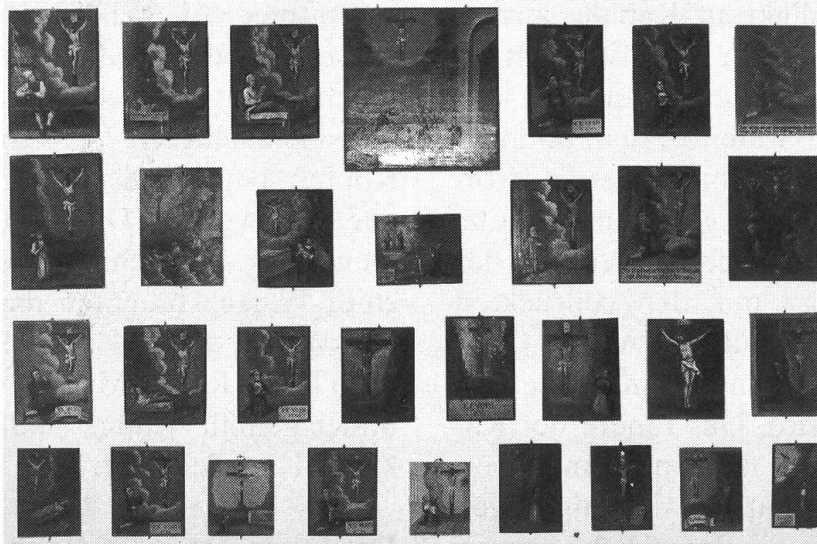
Die 4,5 Meter breite Holztafel «Der Totentanz»

den dreissiger Jahren an der Eingangswand der Heiligkreuz-Kapelle angebracht. Bereits im Jahre 1881 machte ein Professor auf diese Totentanztafel aufmerksam. Hellrote Borten umrahmen die 23 quadratischen Einzelfelder. Unter den Bildern wurden Begleitverse angebracht,