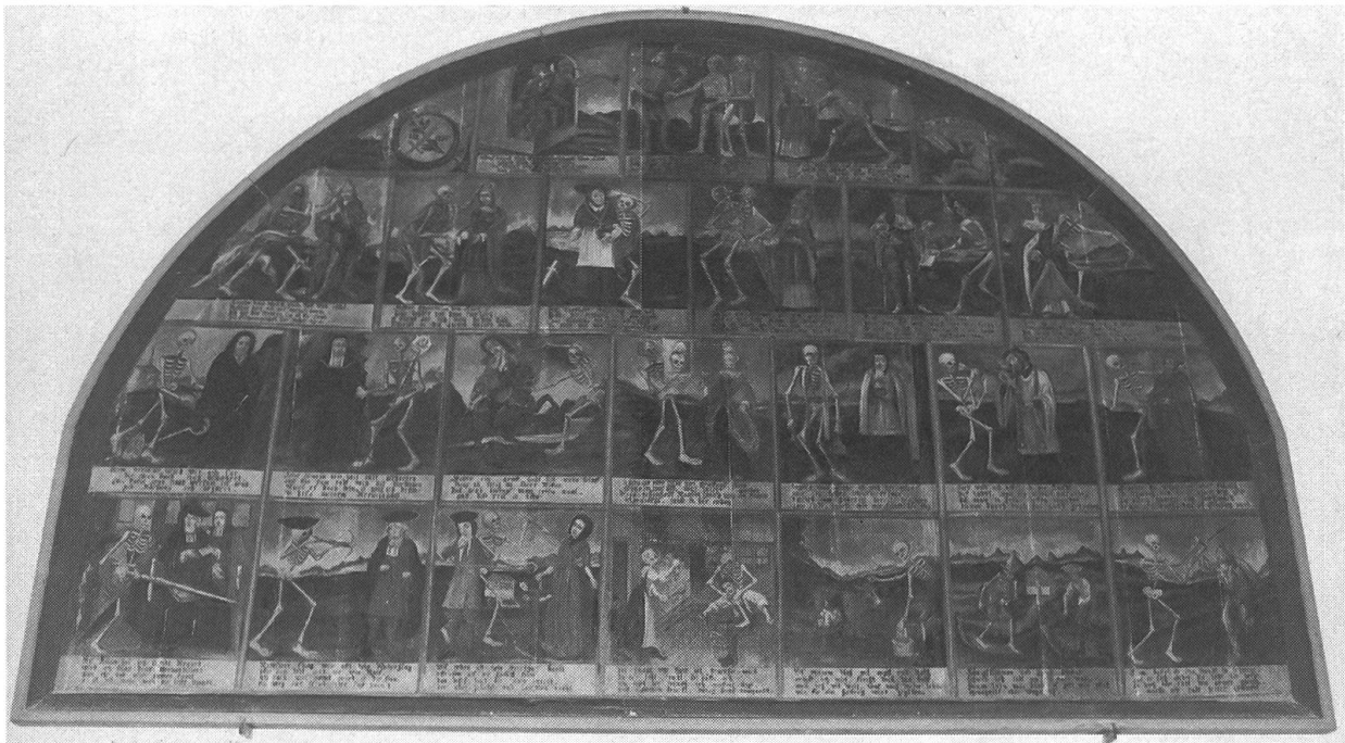
In der Kapelle zeugen unzählige Votivbilder von der grossen Kraft, welche die Gläubigen bei ihren Wallfahrten erfahren durften.