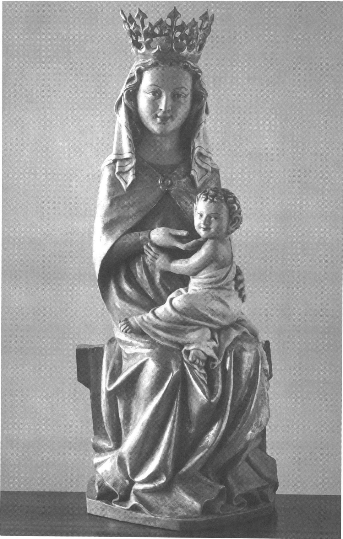
Gnadenbild von Maria Wiesenberg, Holzstatue aus dem 14. Jahrhundert