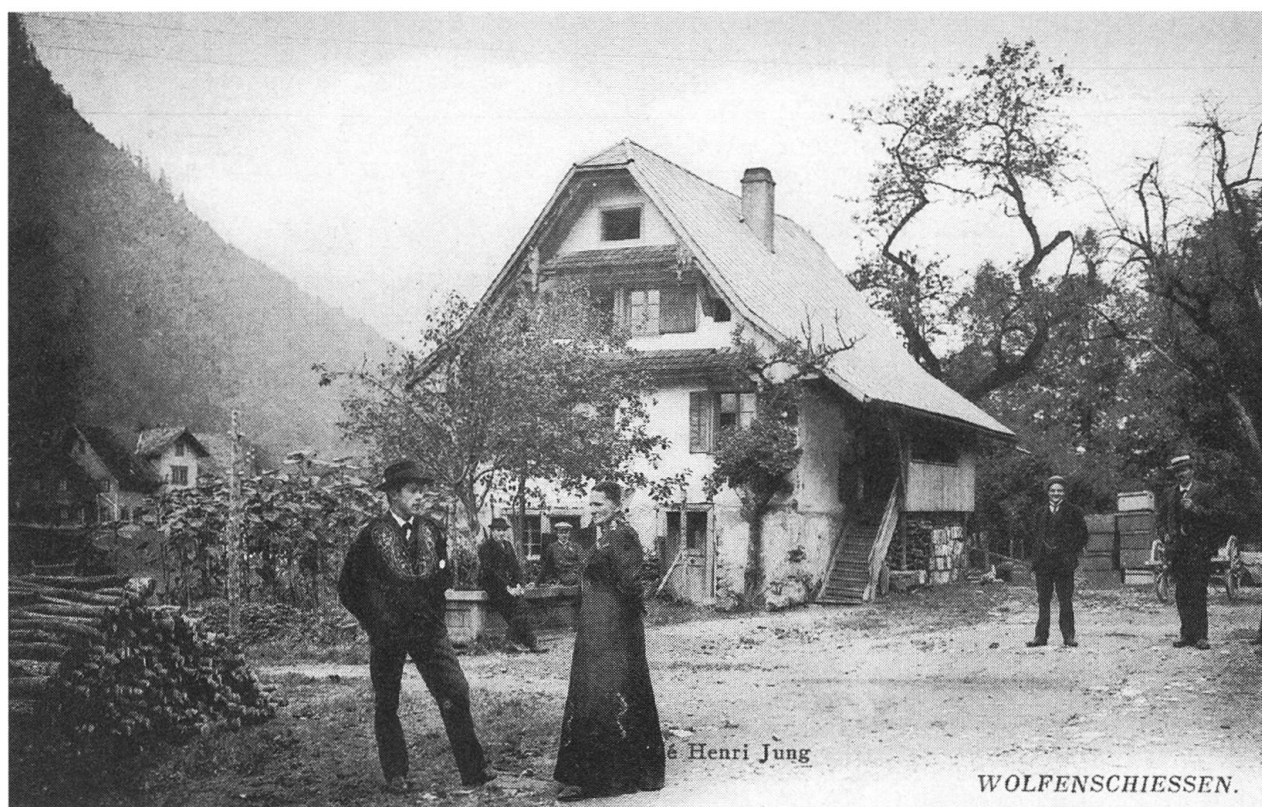
Ein «Bijou» abseits der Hauptstrasse – s'Doktor Huisli, Wohnhaus des legendären «Tirli-Dokter»

Amerika, nahe der Stadt Milwaukee, im Staate Wisconsin. Nach fünf Jahren, am 18. Dezember 1869, konnte er mit 14 andern Prieseramtskandidaten die heilige Priesterweihe empfangen.