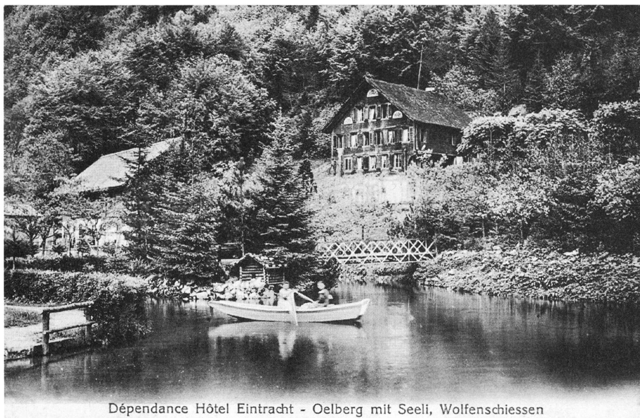
Dépendance Hôtel Eintracht - Oelberg mit Seeli, Wolfenschiessen