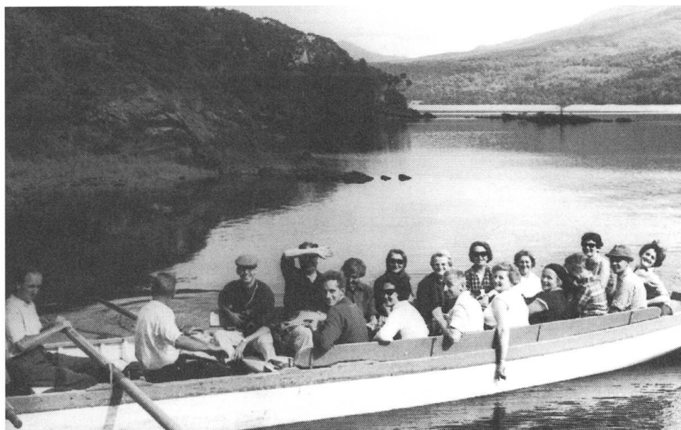
Auf der Bootsfahrt über die Killarney-Seen unterhalten uns die Ruderer mit irischen Sagen.

nicht wenig, als ich ihm von unserem geplanten Abstecher ins «Jakobsland» erzählte.