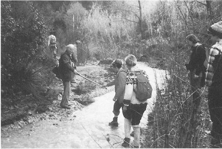
Überquerung des Flusses Alphaios...

die Römerwelt. Die Unterkunft war echt französisch in kleinen, eher bescheidenen Hotels und Dependancen. Dafür wurde ausgezeichnet getafelt, weit besser als in den heutigen Viersternehotels!