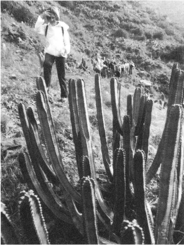
Winterwanderung durch eine exotische Landschaft mit den «Kandelaber-Kakteen». Die Dorftaverne findet man nur, wenn Einheimische einem den Weg weisen.

Innerhalb und ausserhalb der eleganten Hotels wurde gejodelt, getanzt und Entlebucher Kaffee gekocht. Am begeisterten Echo fehlte es nicht, und die Engländer spendeten grosszügig Whisky.