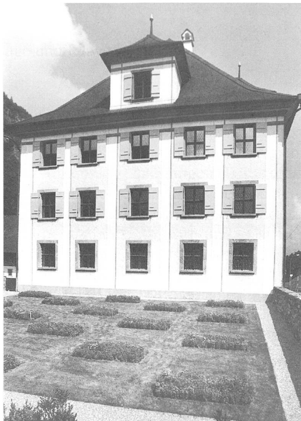
Nach einer umfassenden Renovation erstrahlt das Herrenhaus wieder im alten Glanz. Ebenfalls neu gestaltet wurde der Barockgarten.