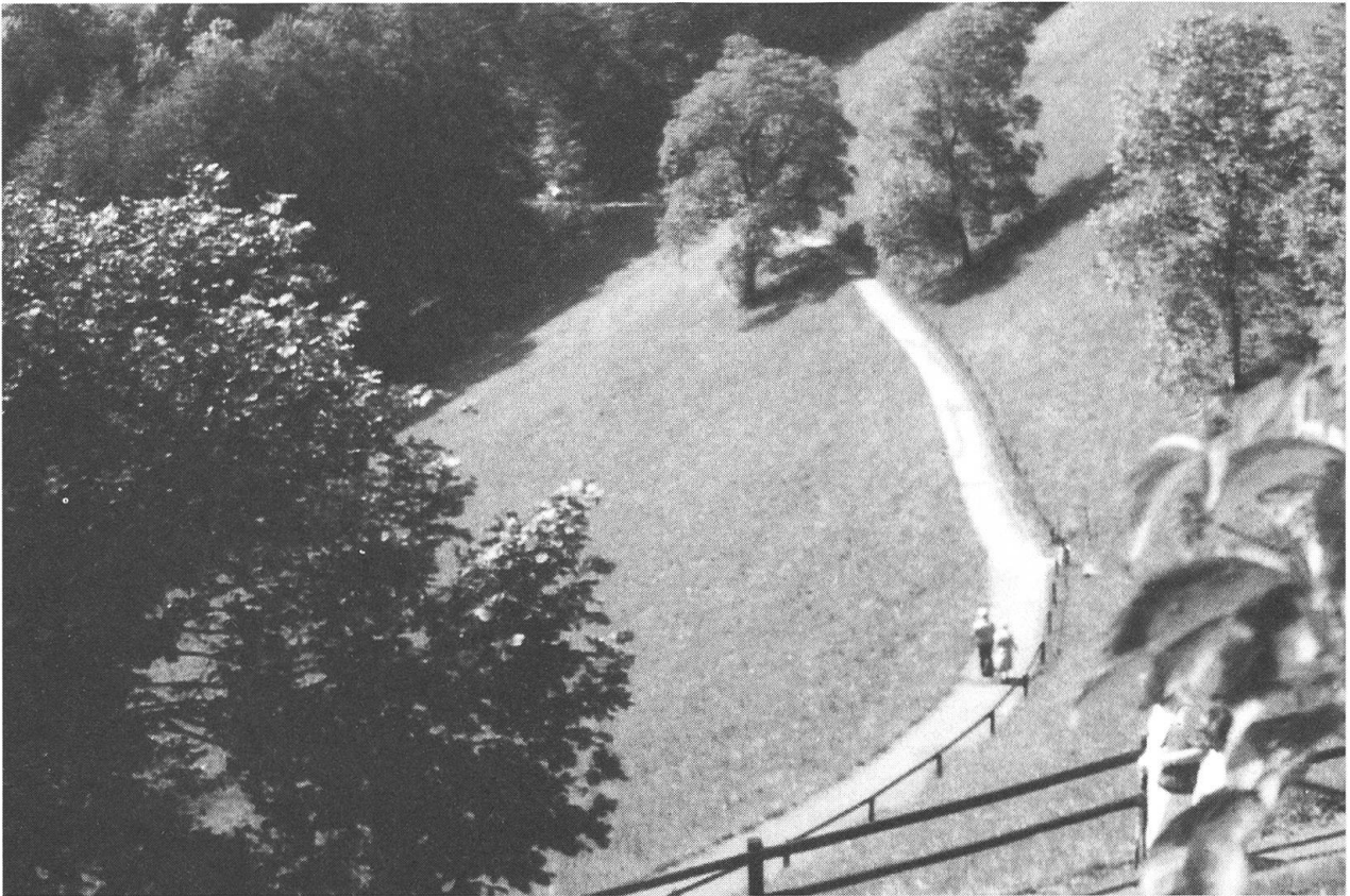
Der steile Ranftweg, den Frau Dorothea von Flüe oft betrachtete, wenn ihre Gedanken sich mit ihrem Mann, Bruder Klaus, beschäftigten.

In diesen Ereignissen liegt für mich ein grosser Trost für die vielen Eltern heute, deren erwachsene Kinder so ganz andere Wege gehen in Glaube und Kirche, in Sexualität und Partnerschaft. Sie wählen ganz andere Lebensgestaltungen, als ihre Eltern es ihnen vorgelebt haben. Zuviele Eltern martern sich mit Schuldgefühlen!