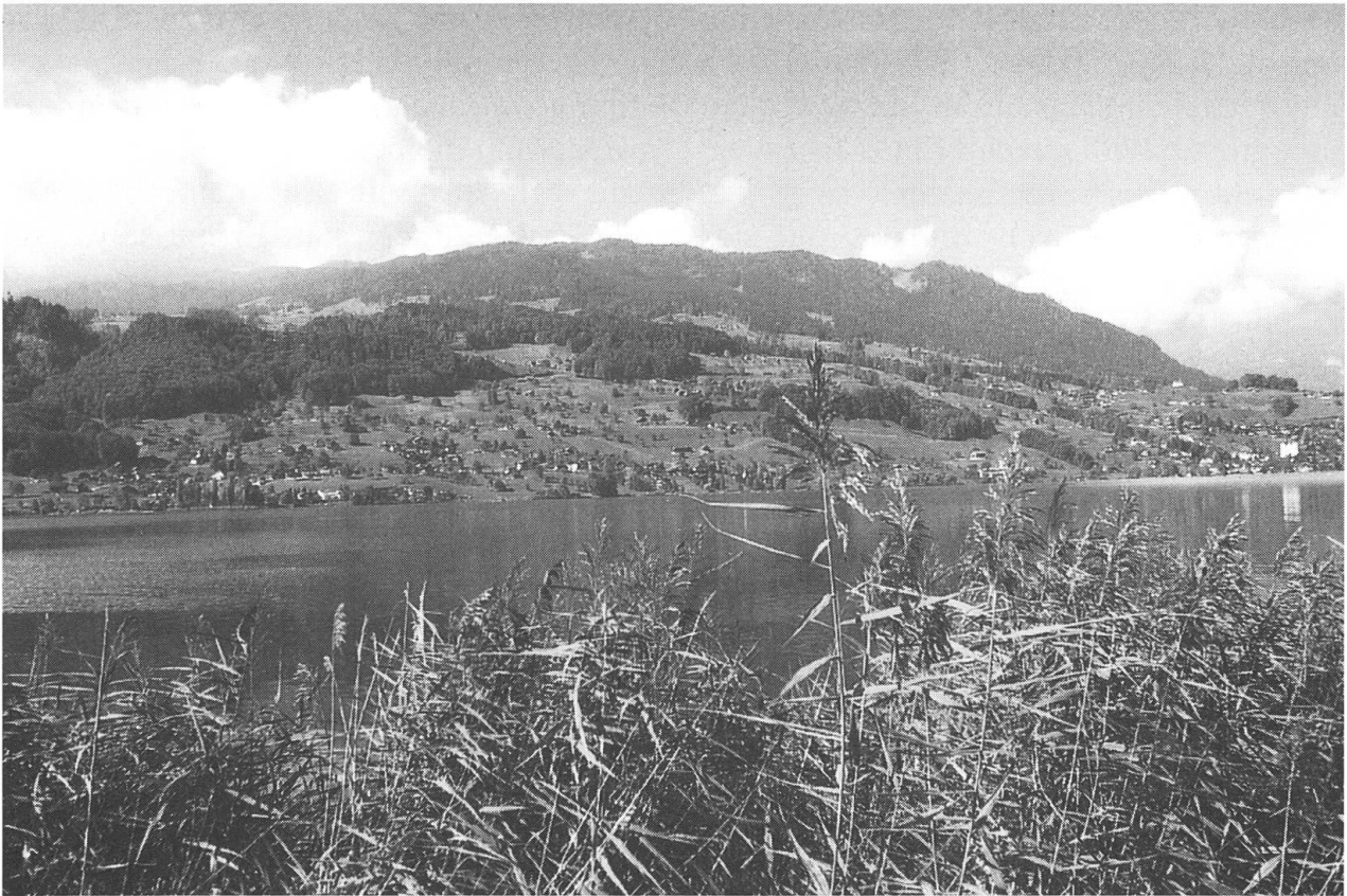
Die Schwendi über dem Sarner See, wo Dorothea von Flüe aufgewachsen ist.

unseren Altersunterschied, an das grosse Haus und die vielfältigen Aufgaben dachte. Und wenn ich seine innere Kraft spürte! Aber genau diese Kraft zog mich auch zu ihm hin und wir gaben uns das Ja-Wort.