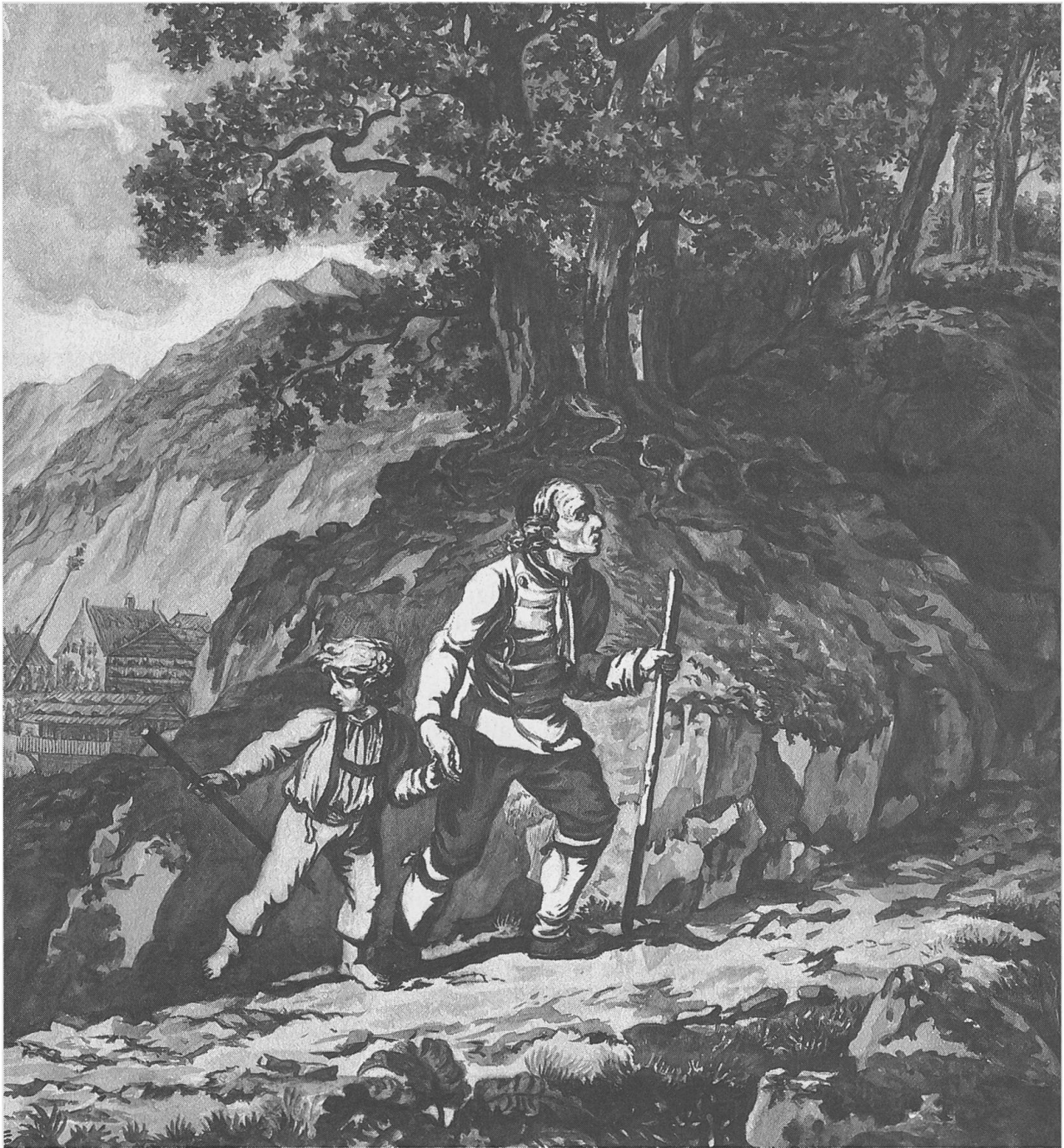
Zu uns komme Dein Reich

heit. Das vergisst sich besonders leicht im Rausch des Rechthabens. Daheim die Landsgemeinde, draussen die Vogteien – hier liegt gewiss ein böser Widerspruch. Und dennoch, als im Februar 1798 diese Vogteien frei wurden, was geschah? Fast überall wurden Landsgemeinden einge-