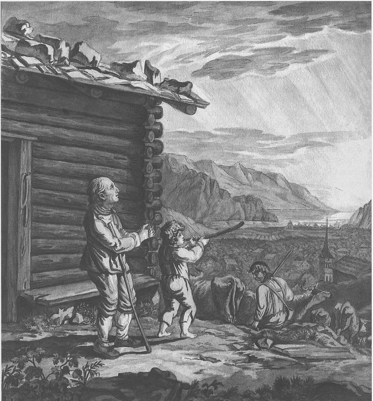
Vater unser im Himmel, geheiligt werde Dein Name

wurde das Feuer eröffnet morgens um 4.30 Uhr.