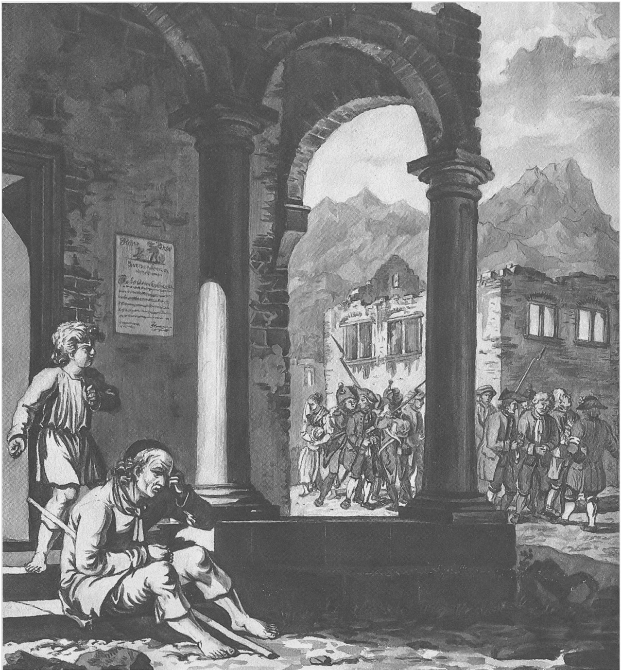
Sondern erlöse uns von dem Bösen