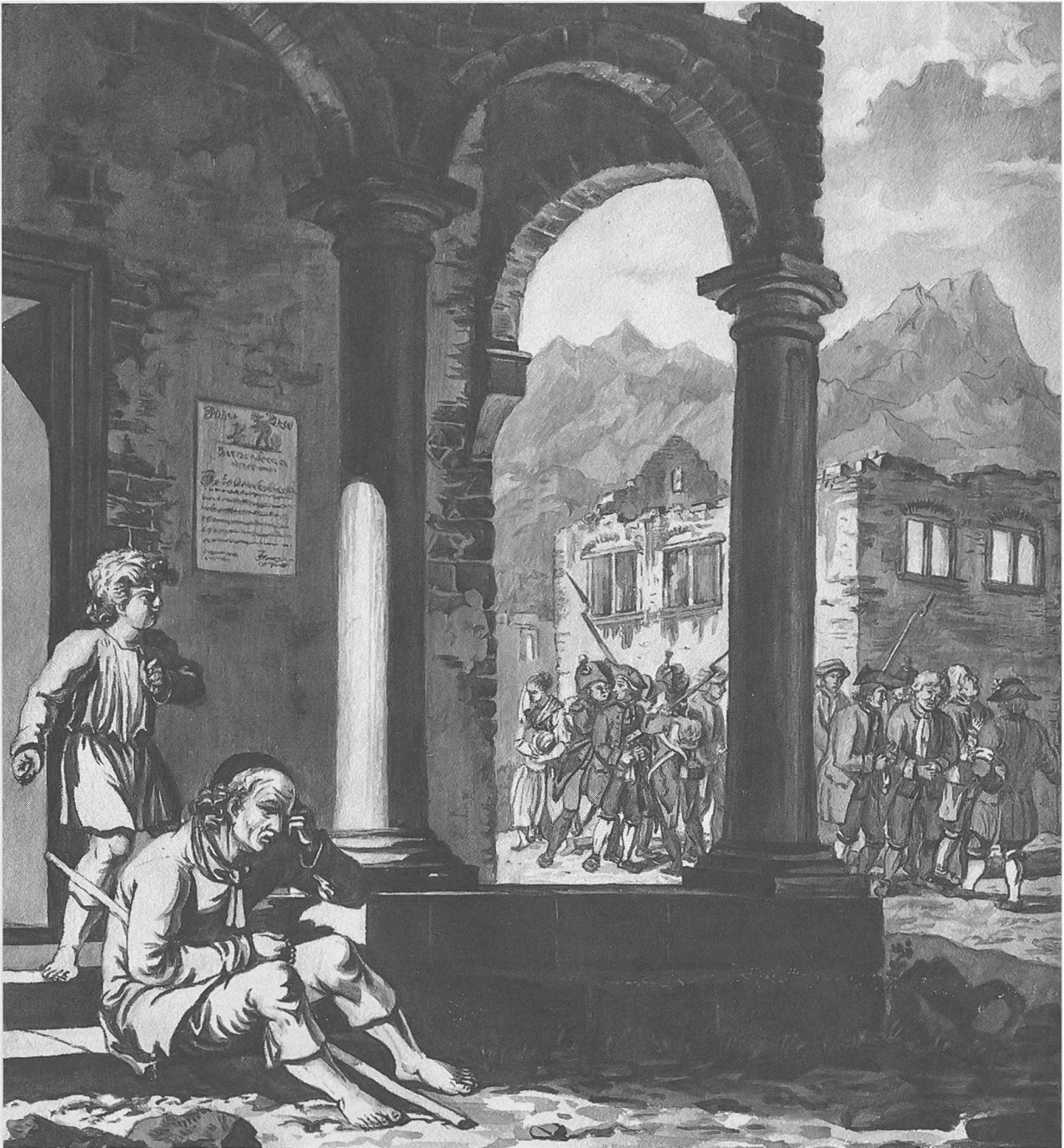
Sondern erlöse uns von dem Bösen