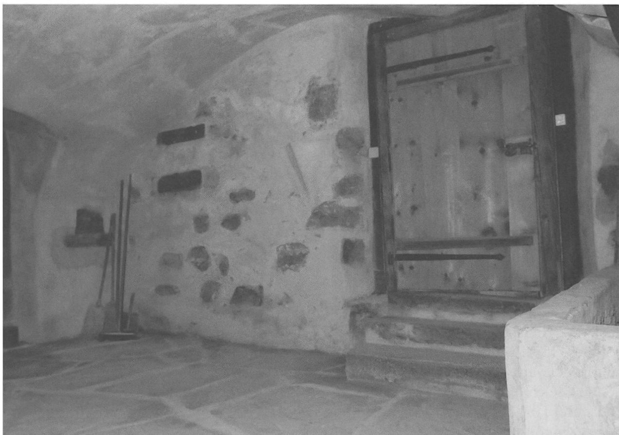
Im gewölbten Keller sieht man links das «Lichtloch». Dort konnte man beim Gang in den Keller eine Kerze so hinstellen, dass sie sicher keinen Brand verursachte.