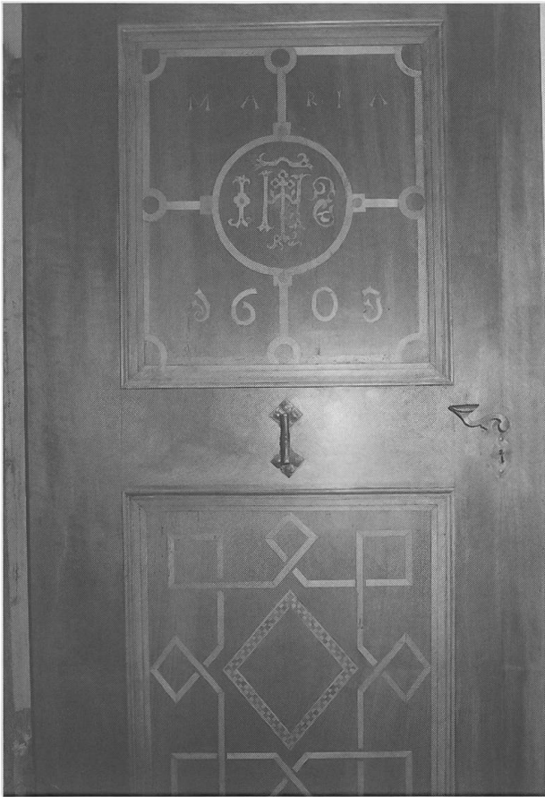
Diese hübsch eingelegte Türe zeigt die Jahreszahl 1601.