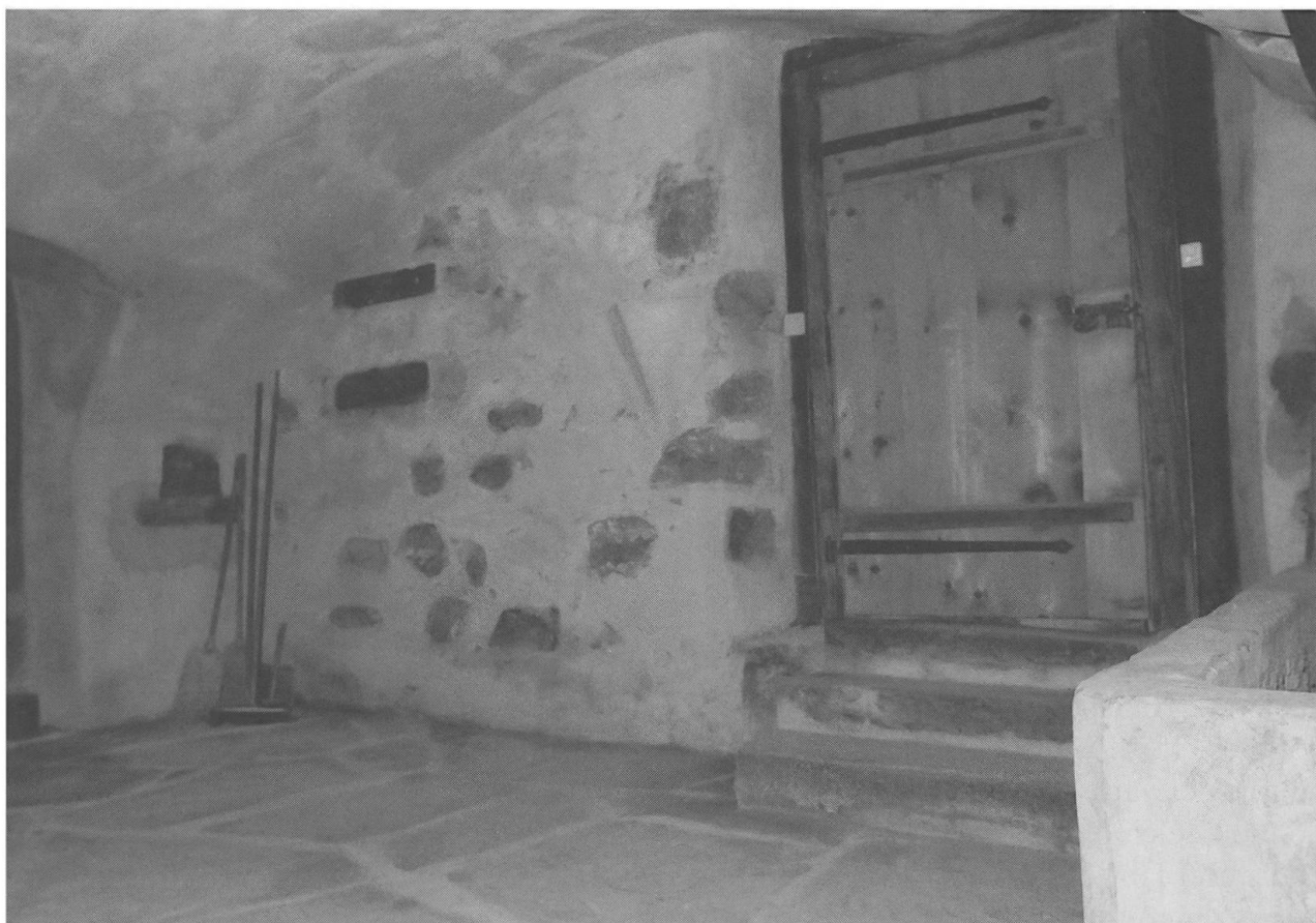
Im gewölbten Keller sieht man links das «Lichtloch». Dort konnte man beim Gang in den Keller eine Kerze so hinstellen, dass sie sicher keinen Brand verursachte.