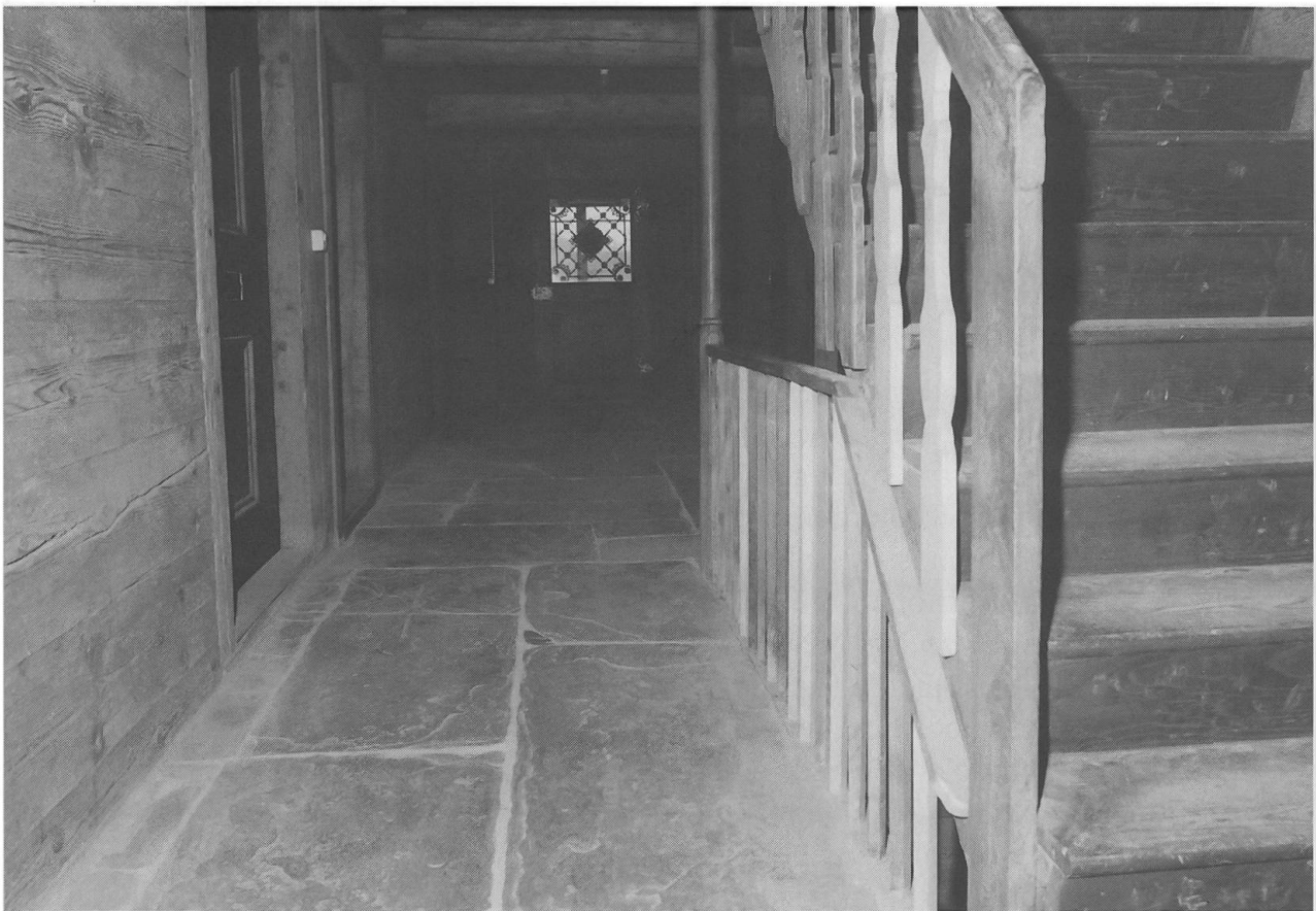
Man sieht die Haustüre, den Gang mit dem Schieferboden und seitlich die Blocktreppe.

Um sichere Anhaltspunkte für die Restaurierung und die zukünftige Farbgebung zu erhalten ging der Restaurierung eine sorgfältige Bauuntersuchung voraus, die nicht nur die baustatischen und konstruktiven Gegebenheiten, sondern auch restauratorische Abklärungen zum Ziele